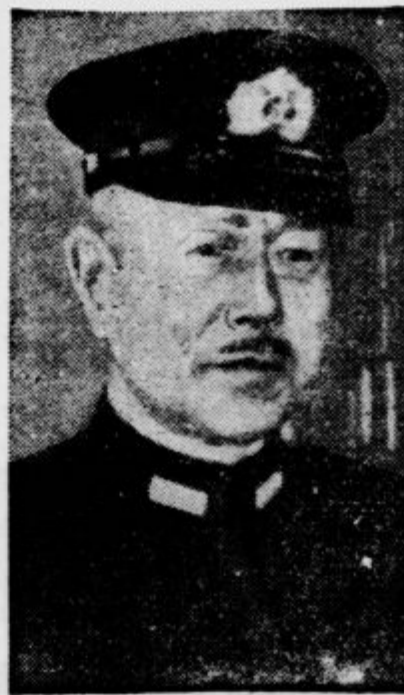
Admiral Suetō, japonski notranji minister, je zbudil v evropskem svetu ogromno pozornost s svojim govorom, v katerem je zavzel stališče proti belokožcem ter proglasil za načelo japonske politike »Azija Azijcem«.