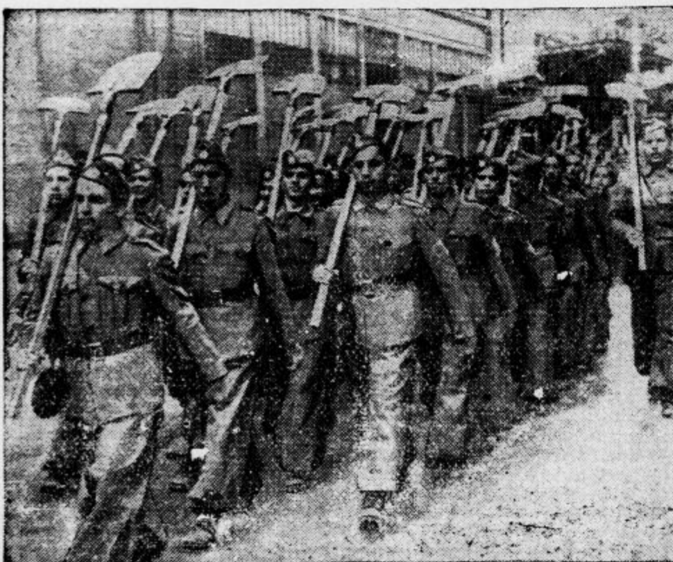
Po vzorcu nemških delavskih taborišč je tudi grška vlada organizirala delavske bataljone. 1200 mladih delovnih moči je na ta način pridobila samo v Atenah, kjer bodo tlakovali ulice.