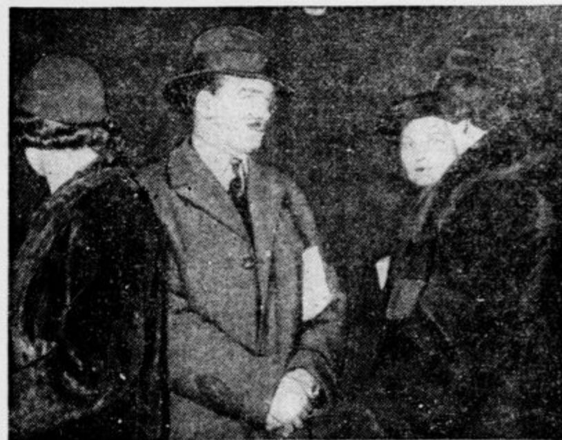
Angleški zunanji minister Eden je prispel zadnje dni na kratek oddih v Francijo. Nastopil je na postaji v Lyonu (slika).