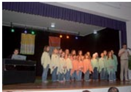
Otroški prekmurski pevski zbor Metuljček