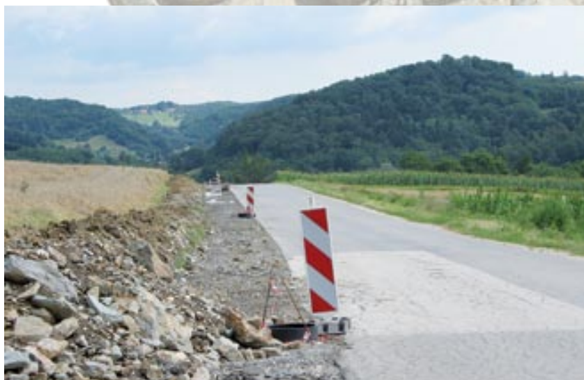
Izgradnja kolesarske steze ob cesti Grad – Kruplivnik

Dobra odskočna deska za razvoj športno-doživljajskega in sonaravno usmerjenega turizma je nekdanji Begunski center Vidonci z odlično lokacijo za to zvrst turizma. Tako imenovani »all in one« turistični center bi bil namenjen šolam, družinam s celodnevniimi programi za odrasle in otroke, kolesarjem ter enodnevnim gostom in obiskovalcem s ponudbo pustolovskega parka Goričko, ki ponuja enkratno doživetje v naravi z avtohtonimi lokalnimi jedmi, organizacijo piknikov ipd. V adrenalinskem parku bi goste pričakala tipična gorička vas z gostinsko ponudbo, manjšim centrom dobrega počutja (wellnessom), konferenčnimi prostori in manjšim muzejem. Prenočitvene zmogljivosti bi imele 12 apartmajskih enot v tradicionalnem slogu. Spremljevalna infrastruktura pa bi ponujala plezalno steno, pustolovski park, manjši bazen, otroška igrala, igrišča za badminton in odbojko na mivki, izposojajo koles, trampoline in poligon za lokostrelstvo. Uresničitev projektov ne bo samo ugodno vplivala na razvoj turizma, temveč bo ponudila tudi dodatna delovna mesta v občini.