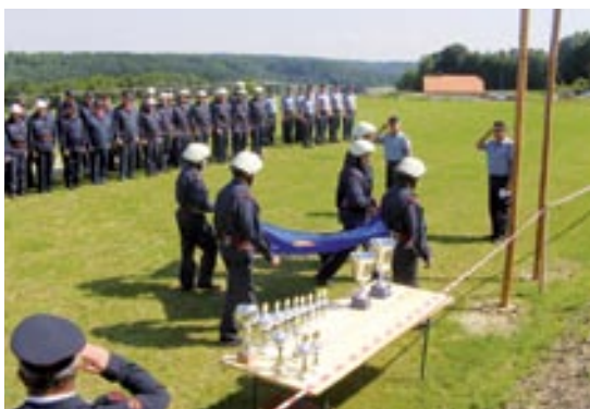
Zbor desetih

V soboto, 21. junija 2008 se je v Kovačevcih odvijalo občinsko gasilsko tekmovanje. Vse skupaj se ga je udeležilo 12 desetih iz občine