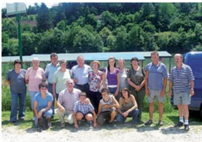
Člani društva na izletu

kjer so na ogled stari stroji, stara kmetijska mehanizacija in voščene lutke, ki prikazujejo delo na deželi nekoč. Imeli pa so tudi možnost ogleda muzejske zbirke o Koroškem plebiscitu in tisočletja stare kostnice, kar so si ravno tako ogledali. Ko so Libeliče skorajda prečesali, so komaj čakali, da se skrijejo soncu, vročini in se odžejajo. Tako so se odpravili do pivovarne Relax, ki so si jo ogledali ter pivo celo poskusili. Tam jim je bila predstavljena tako proizvodnja kakor tudi receptura originalnega koroškega piva – Matjaževega (svetlega) in Flosarskega (temnega) piva. Da pa ne bi bilo izleta prehitro konec, so si rezervirali še splavarjenje po reki