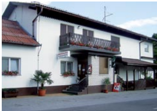
Današnja podoba Gostilne »Pri veselem Goričancu« lepo sovпада v okolje

v tem primeru, saj so Zdravčevi složna družina, kar se nemara vidi tudi tako, da vsak s svojo močjo prispeva k še lepši in boljši prihodnosti gostinske dejavnosti, družinske tradicije v vseh pogledih. To se prav lepo vidi v njihovi prijaznosti in pripravljenosti ter uslužnosti, pa naj si bo to do še tako zahtevnih gostov. Za svoje goste so vedno odprti za razna praznovanja, kot so gostije, praznovanja rojstnih dni, obletnic in še in še, kjer imajo prostora za okrog 150 gostov. Poleg gostinstva se ukvarjajo tudi z vinogradništvom in sadjarstvom. Imajo okrog 4.000 trsov, iz katerih pridelujejo okusno