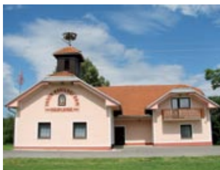
Vaško-gasilski dom Kruplivnik