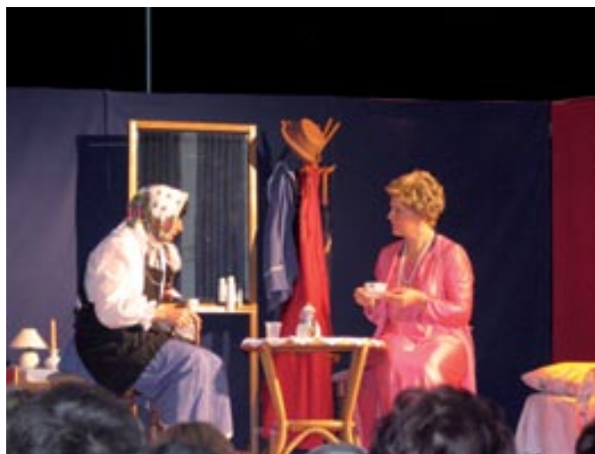
Sostanovalki v domu starejših