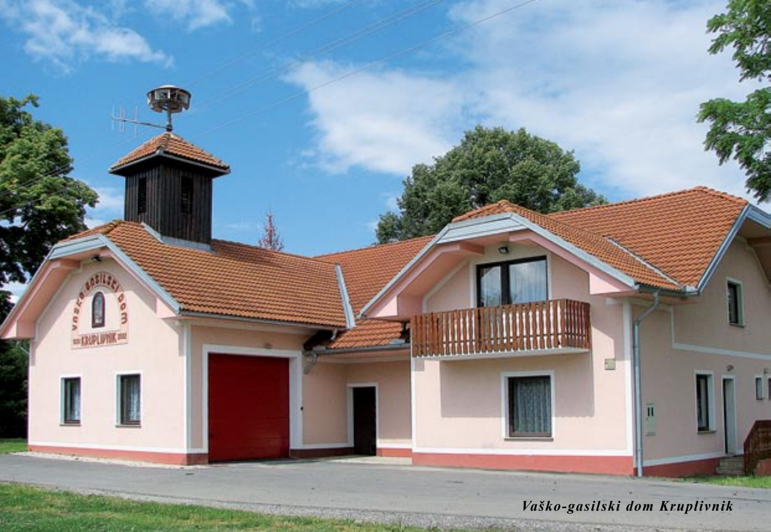
Vaško-gasilski dom Kruplivnik