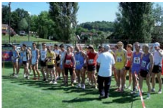
Člani na startu

Športno društvo Grad in Združenje atletskih sodnikov Murska Sobota je v sodelovanju z Občino Grad in Krajinskim parkom Goričko pripravilo že 5. državno prvenstvo gorskih tekačev Slovenije gor/dol, obenem je bila to druga tekma za Pokal Slovenije v gorskih tekih, Pokal Pomurja v rekreativnih tekih POM-P 2008 in Osnovnošolsko tekmovanje v krosu OŠ Grad.