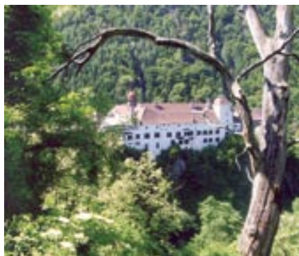
Grad Herberstein