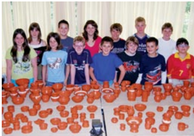
Mladi lončarji

Da nas je mladih lončarjev 13, vemo, koliko izdelkov smo naredili letos, pa bi težko prešteli. Tudi med učenci nižjih razredov je zanimanje za lončarjenje veliko. Tako so se učenci 2. razreda spoprijeli z glino v okviru tehniškega dne.