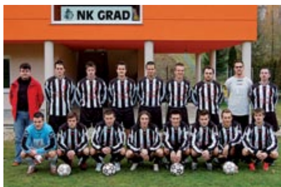
Ekipa članov v sezoni 2007/08

1968 je ekipa izven konkurence nastopala v takratni PNL (Pomurski nogometni ligi). Ob ustanovitvi klub še ni imel lastnega igrišča, pred začetkom tekmovalne sezone 1968/69 pa ga je uspel ob zagnanem, seveda izključno prostovoljnem delu, zgraditi v bližini takratne žage na »Marofu«.