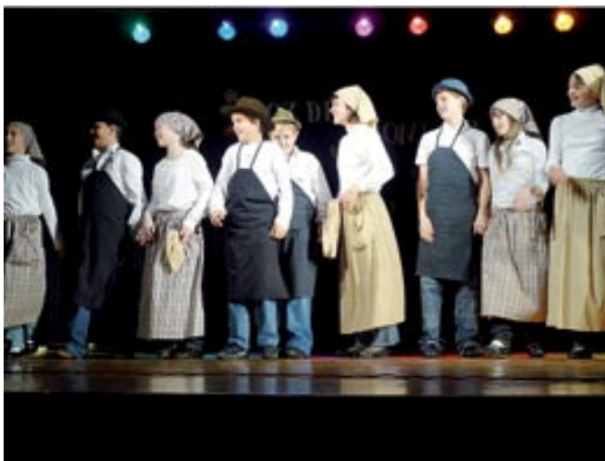
Mladi z Dolnjih Slavečev so zaplesali