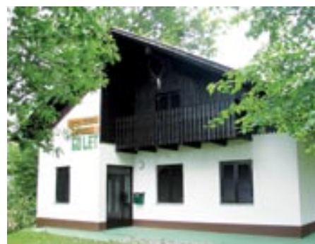
Lovski dom Radovci