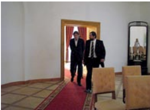
Simoniti v poročni dvorani

Minister za kulturo je izrazil priznanje za doseženo in dobre želje za nadaljnji razvoj parka, izjavil pa je tudi, da je pričakoval, da je že več gradu obnovljenega. Zanimalo ga je tudi potencialno partnerstvo investitorjev pri nadaljnji obnovi gradu. Ministrstvo za kulturo je v svojstvu Republike Slovenije, kot lastnika gradu – spomenika, zagotavljalo sredstva za dosedanje obnovo gradu v kombinaciji s sredstvi EU, Javni zavod KP Goričko pa je kot upravljavec parka in gradu ministru tudi predstavil načrtovano nadaljevanje obnove gradu kot sinergijo finančnih virov resornih ministrstev, EU virov in možnega javno zasebnega partnerstva.