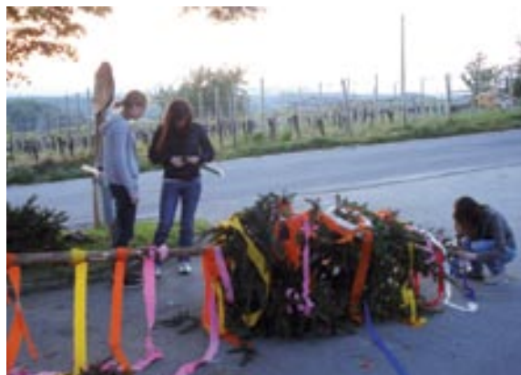
Dekleta so poskrbela za lep izgled mlaja

V Radovcih se je v času prvega maja zvrstilo dvoje kresovanj. Prvi kres je bil prižgan pri »Tišlarovon Jožeki«. Kljub temu, da se tega kresa ni udeležilo veliko vaščanov, pa so se vseeno tisti, ki so se ga, imeli lepo. Drugo kresovanje je organiziralo ŠD Radovci. Zaradi slabega vremena je bil kres prižgan 3. maja po odigrani prvenstveni