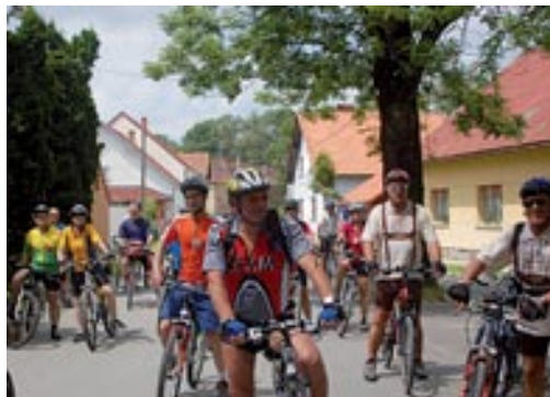
Kolesarji se peljejo iz gradu

iz avstrijske Tirolske, Koroške in Štajerske ter iz Slovenije je sledil start, ki je bil na mostu čez Muro v Gornji Radgoni. Pot jih je vodila naprej skozi Bad Radkersburg do mejnega prehoda Zelting/Zenkovci. Sledila je vožnja skozi Cankovo, Krašče, Ropočo, Pertočo, Motovilce in mimo Belega križa na Grad. Po 21 kilometrih so kolesarje na grajskem dvorišču pričakali zvoki romske glasbe Male Lange in