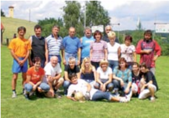
Ženske so se v nogometu pomerile z veterani

Ajax, čeprav so bile druge ekipe mnenja, da jim ta dan ni zagodlo vreme, ampak sodnik. V igranju nogometa so se preizkusile tudi ženske proti ekipi veteranov. Znanje ženskega nogometa ni bilo slabo, ampak vseeno so bili