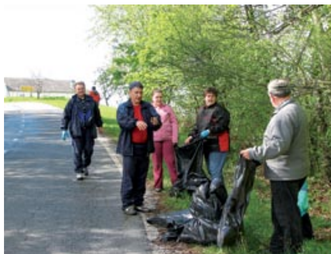
Skupina v Radovcih

Tudi Občina Grad že nekaj let ob dnevu Zemlje