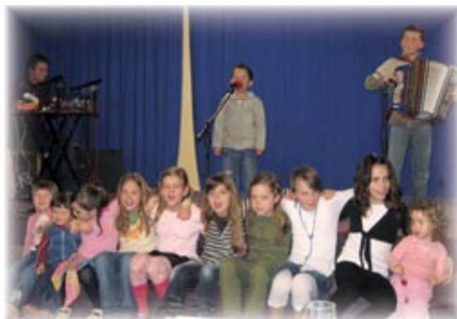
Otroci so poskrbeli za kulturni program

Člani DŠKT »Lukaj« Motovilci tudi letos nismo pozabili na materinski dan oz. dan žena. V zahvalo predstavnicam nežnejšega spola za celoleten trud in delo, ki ga opravljajo, smo pripravili v prostorih gasilskega doma družabni večer in