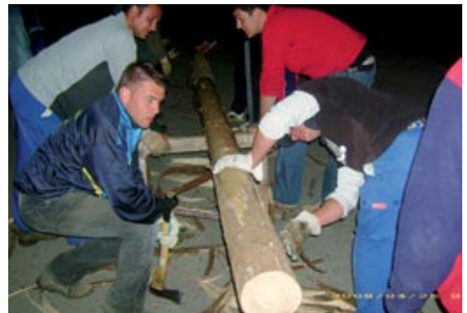
Priprava in krasitev mlaja

Seveda si člani društva srčno želijo, da bi bilo takih