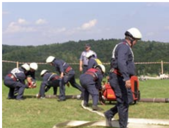
Desetina Kovačevcev

Da pa je bila ta pot posuta z grenkimi izkušnjami, z večkrat povzdignjeni glasovi a hkrati z veliko požrtvovalnostjo, nam lahko potrdi peščica zanesenjakov, ki je leta 1978 začutila potrebo, da se končno tudi v Kovačevcih nekaj začne dogajati na področju gasilstva. Takoj na začetku so si zadali smelega načrta - gradnja prostorov za skladiščenja gasilske opreme in dejavnosti gasilstva. Zaradi zavisti in pohlepa določenih vaščanov se je ta gradnja zavlekla.