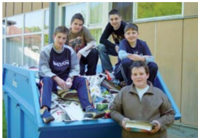
Po napornem delu se prilježe počitek

Za ta projekt smo se odločili zato, ker živimo v okolju, za katerega je značilno, da med letom pade najmanjša