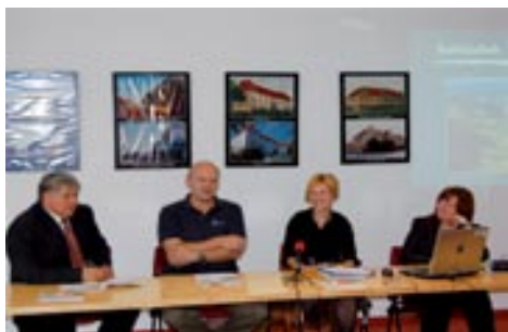
Predstavitve knjige