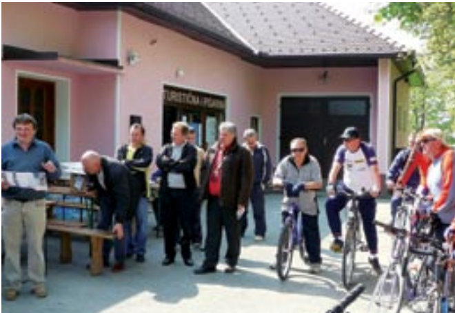
Predstavitve Kačove kolesarske poti