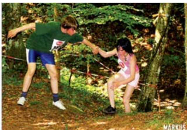
Na progi si tekači tudi pomagajo

Vabimo vas, da drugo leto okusite slast navijanja, če že ne tekmovalnosti oz. rekreativnega pohoda, kajti nekoliko smo bili razočarani nad obiskom pohodnikov, vendar so čast 6. pohoda »rešili« naši upokojenci, ki so vsako leto naši redni gosti, za kar smo jim seveda nadvse hvaležni.