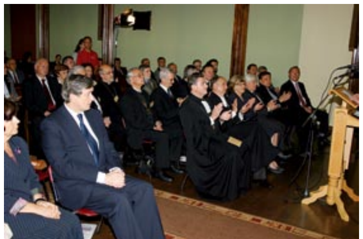
Utrinek s Trubarjevega simpozija v Ljubljani