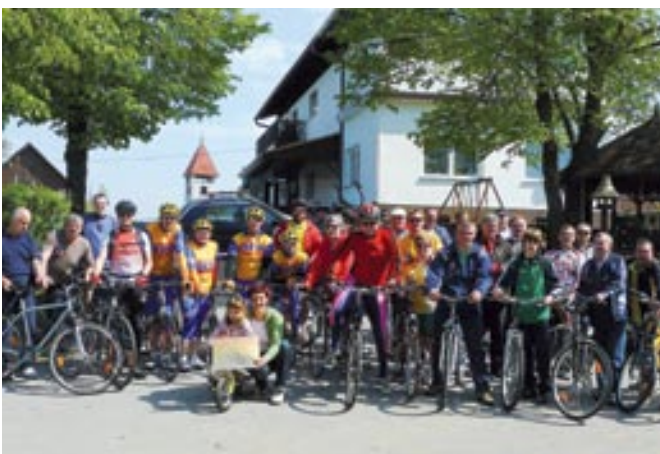
Zbrani kolesarji

Dnevi z dneva v dan tečejo hitreje. Tako hiti tudi leto. Vedno znova vse teče hitreje in skoraj neopazno. Ob tem ritmu življenja smo dočakali tudi 30. april - predvečer 1. maja, praznika dela. Kot vsako leto, so se tudi letos »slavečki moški« podali v gozd, kjer so posekali »majpan«. Običaja nikakor nismo zapustili. Ponovno smo poskrbeli za mlaj, katerega so postavili pred gasilskim domom na Dolnjih Slavečih, kakor tudi