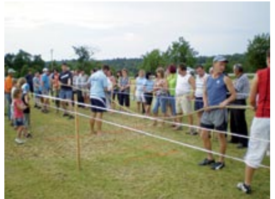
Meritev moči v vlečenju vrvi