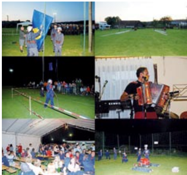
Nočno gasilsko tekmovanje

V noči s sobote, 5. julija 2008, na nedeljo se je v Motovilcih odvijalo že 10. tradicionalno nočno gasilsko tekmovanje za prehodni pokal »Vasi Motovilci«. Udeležilo se ga je 31 gasilskih desetini, od tega 7 ženskih. Pri članih so zmago slavili fantje iz Šratovcev, drugo mesto je zasedla ekipa PGD Korovci, tretji pa so bili naši prijatelji iz Savinjske doline, gasilci iz Braslovč. Pri članicah so zmago slavila dekleta iz Bodoncev, drugo mesto je pripadlo članicam Serdice, tretje mesto pa je osvojila ženska enota iz Gabrnika. Letos je bil ključ do uspeha