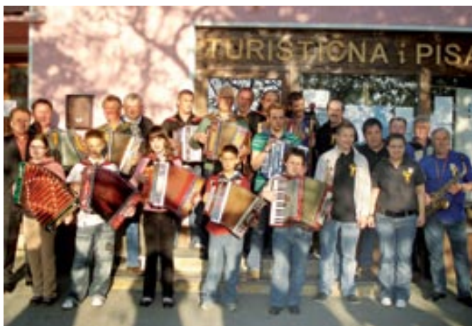
Skupinska slika udeležencev

V mesecu aprilu je v Radovcih bilo organizirano in izvedeno že kar 20. tradicionalno srečanje harmonikarjev z mednarodno udeležbo. Na prireditvi