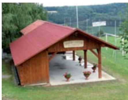
Športni center Radovci