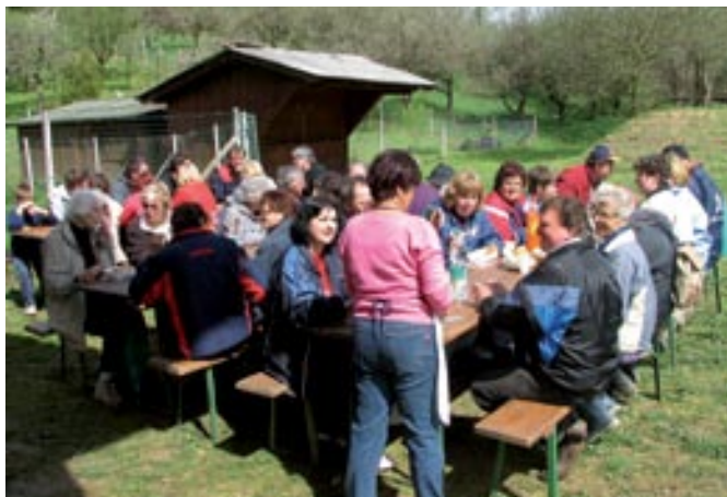
Udeleženci akcije so se okrepčali z bogračem

19. aprila. V akciji vsako leto sodelujejo društva in posamezni, osveščeni vaščani. Očiščevalne akcije se je letos udeležilo okrog 120 ljudi, ki so po vaseh čistili obcestne jarke, potoke, poti in skupne javne površine. Po koncu akcije so se vsi zbrali na nogometnem igrišču pri Gradu, kjer jih je čakal okusen bograč, ki so ga pripravili člani lovske družine Radovci. Občina Grad pa je vse udeležence očiščevalne akcije nagradila s kapami.