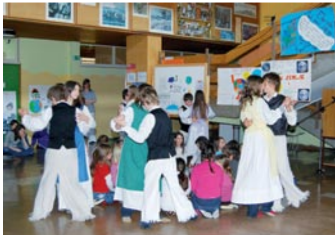
Tako se sučejo naši folkloristi