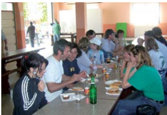
Pohodniki so si ob malici odpočili

Leto je naokrog in spet je prišel čas, ko smo prirejali Binkoštni pohod treh dežel. Kot veste, se letošnje leto vsi prazniki vrtijo prej. Tako je bilo tudi z našim pohodom. Že 10. maja 2008 se je začela veriga pohodov treh dežel, ki se prirejajo ob binkoštnih dneh. Tako se je prvi pohod odvijal v sosednji Madžarski 10. maja dopoldne in že, še isti dan popoldne, drugi pohod v okviru binkoštnih pohodov, v Avstriji – Fürstenfeldu. In že je bila nedelja, binkoštna nedelja, ko smo pohod izvajali mi, a komaj od 12. ure naprej. Kajti v nedeljo,