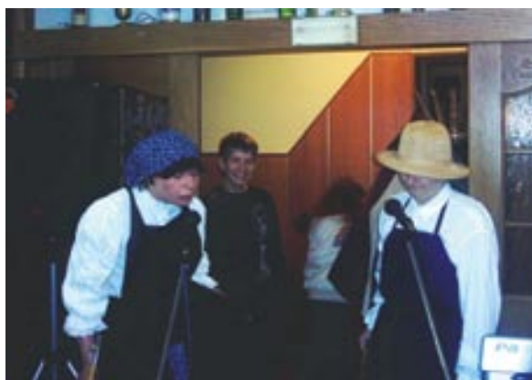
V kratkem programu so sodelovali tudi starejši.