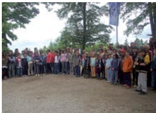
Otroci na Tromeji

Med potjo do Tromejnika so učenci obeh šol ob pomoči delavcev Narodnega parka Órség in JZ KP Goričko igraje in z doživetjem pridobili nekaj znanja o naravi in pomenu njenega varovanja ter le-to dokazali v naravovarstvenem kvizu. Namen prijateljskega srečanja je bil opozoriti javnost na naravi prijazen način življenja in na pomen čezmejnega naravovarstva ob dnevu evropskih naravnih parkov, okrepite stike med ljudmi ob meji, širiti vedenje o naravi in pomenu njenega ohranjanja ter motivirati ljudi za kulturno, z doživetji bogato, preživljanje prostega časa. Srečanje je bilo nadvse