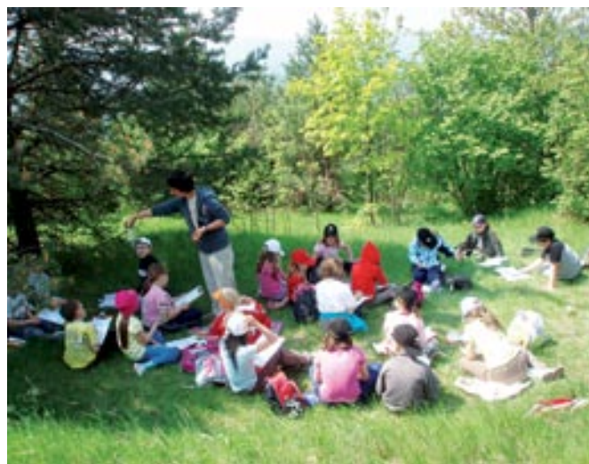
Tudi pouk v naravi je lahko zanimiv

Program dela je bil za učence zelo pester in zanimiv. Spoznali so okolico doma, spoznavali raznolik