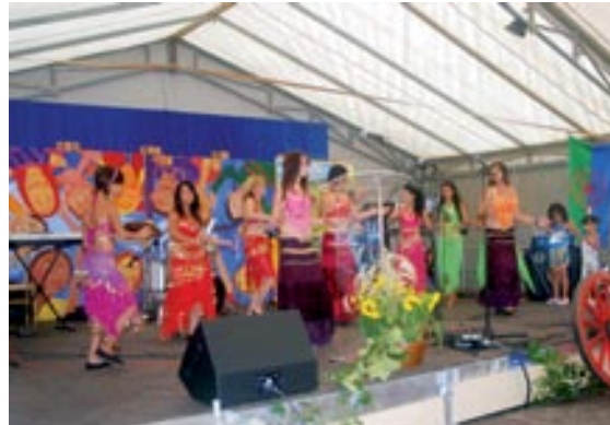
Združena RD Čapla, Pušča in Somnakune Čerhenji

Na grajskem dvorišču smo 18. julija letos prvič priredili festival romske kulture pod častnim pokroviteljstvom predsednika republike Slovenije, dr. Danila Türka. Dopoldanski čas smo namenili razpravi o prostorski problematiki romskih naselij v Krajinskem parku Goričko, kjer živijo