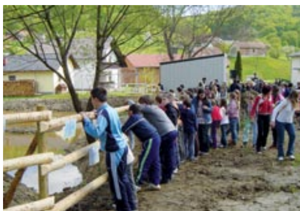
Učenci OŠ Grad pred obnovljeno Kačovo mlako

delo v projektu Eko šola kot način življenja. Programu so prisostvovali poleg otrok iz vrtca, učencev in delavcev šole, tudi starši, župan Občine Grad in predstavniki Javnega zavoda Krajski park Goričko. Po končanem programu smo nadaljevali v naravi, kjer je JZ KP Goričko obnovil Kačovo mlako.