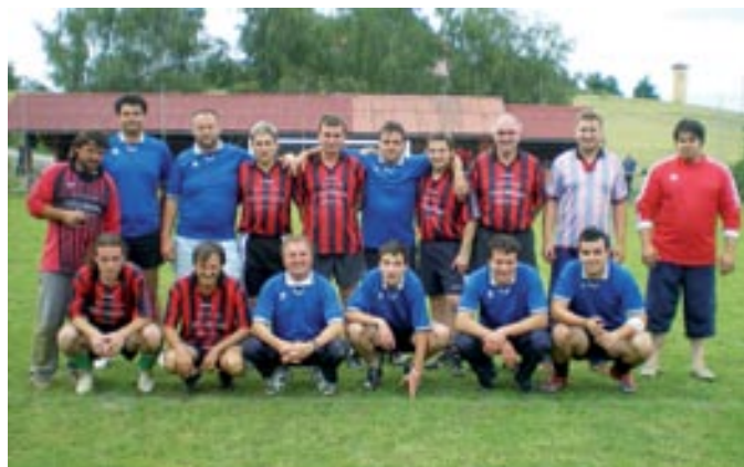
Zmagovalci Šandorov breg-Ajax v rdečih dresih, Drvaričev breg v modrih dresih

Moram priznati, da so ekipe bile dokaj izenačene, ampak se je na koncu jeziček na tehtnici le prevesil v tisto smer, kjer so v ospredju bile tudi izkušnje, moč in znanje. Tako je prvo mesto turnirja zasedla ekipa Šandorov breg-