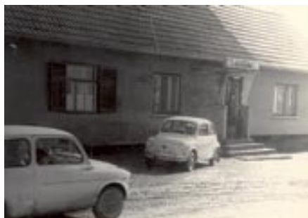
Prvotna podoba Gostilne »Pri veselem Goričancu«

je zapustil svojim naslednikom. Bil je človek veselega srca in odprtih rok čisto za vsakega gosta. Imel je posluh za gostinsko dejavnost, na kar so lahko njegovi najbližji zelo ponosni. Svoje delo je predal leta 1983, ko