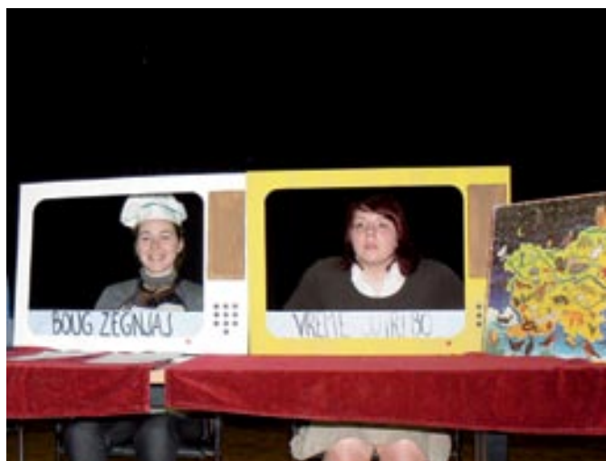
Skeč mladincev je vse pošteno nasmejaj

Tudi letošnji marec ni mogel miniti brez pozornosti na naše mame, žene in dekleta, ki so v tem času praznovala svoj praznik. Zato je prav, da znajo izkoristiti takšne priložnosti in se vsaj za en večer odklopiti od vsakodnevnih opravil, skrbi in dela ter nameniti ta čas