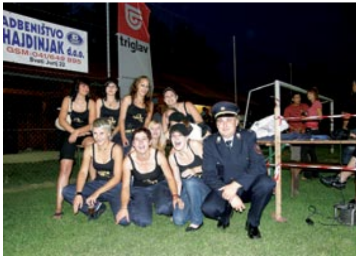
Pridne radovske čebelice

Seveda pa v Radovcih nobene prireditve ne moremo zaključiti, ne da bi postregli z dobro kapljico in hrano ter