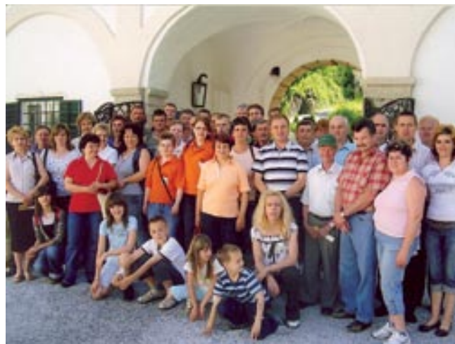
Skupinska na gradu Herberstein