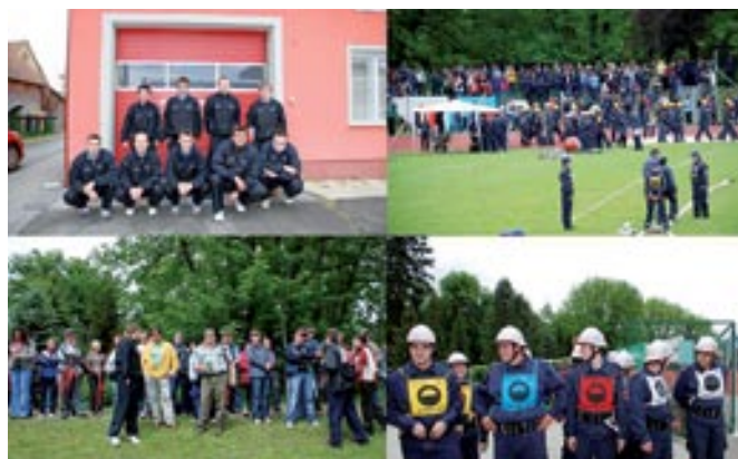
Na državnem tekmovanju

Prostovoljno gasilsko društvo Motovilci se je 28. julija 2007 z zmago na občinskem gasilskem tekmovanju v Kruplivniku uvrstilo na regijsko tekmovanje. Regijsko tekmovanje se je odvijalo v Križevcih, 9. septembra 2007. Na tem tekmovanju so z odlično opravljeno vajo dosegli tretje mesto in se tako uvrstili na državno tekmovanje. Državno tekmovanje je potekalo 18. maja 2008 v Ravnah na Koroškem. Tako so se člani