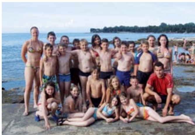
Na morje smo odšli, plavat se učiti!

Učenci 5.A razreda so se od 15. do 21. junija 2008 udeležili letne šole v naravi v Savudriji. Program je potekal po pripravljem načrtu in bil uspešno izveden. Pri pouku plavanja je bil poudarek na učenju tehnike prsnega in kravl sloga, na igratih v vodi in na skokih v vodo. Učenje plavanja je potekalo dopoldan in popoldan po dve uri in pol. Učence smo prvi dan ocenili in jih razvrstili v tri skupine, med plavalce, neplavalce in tiste, ki so že imeli nekaj znanja.