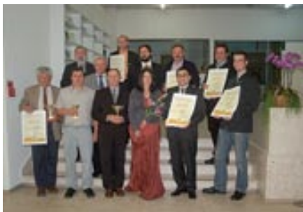
Dobitniki diplom in medalj

Podelitev diplom, srebrnih in zlatih medalj ter razglasitev šampionov v