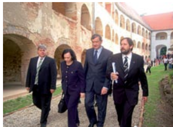
Predsednik si je z ženo ogledal grad

Romi v 23 zaselkih. Eminentna strokovna družina je razpravljala vse do druge ure in ob koncu sprejela tudi nekaj zaključkov. Več o tem lahko preberete na spletni strani www.park-goricko.org v rubriki aktualno/seminarji. Ob 16.30 sta na grad prispela predsednik