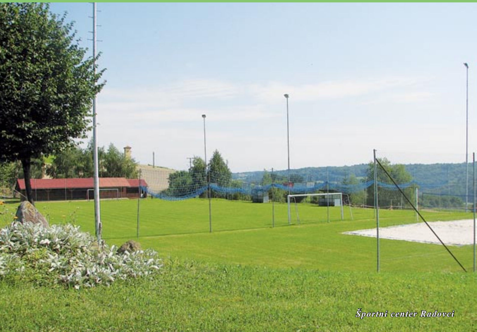
Športni center Radovec