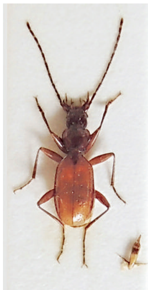
Slika 4: Anophthalmus egonis – naravna velikost 6,0 milimetrov.