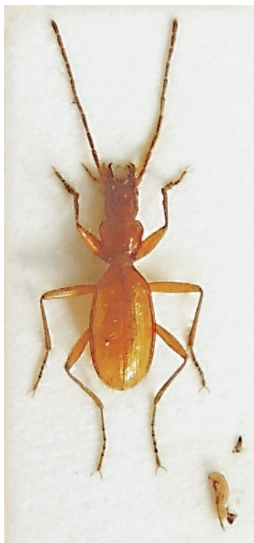
Slika 5: Anophthalmus micklitzi rovnicensis – naravna velikost 5,7 milimetrov.

klitzi rovnicensis , Laemostenus schreibersi , Aphaobius robustus , Bryaxis argus , Lep- tinus testaceus , Paederus littoralis , Catops subfuscus , Catops fuliginosus , Nargus wilkini , Choleva agilis , Choleva oblonga , Choleva sturmi , Cryptophagus pilosus , Cryptophagus distinguendus , and Oxylaemus variolosus . The cave Jama pri Lipniški skali is the classical finding place of the species Aphaobius robustus . The finding of the species Anophthalmus egonis was quite a surprise as this is the most southern find- ing place, 15 km distance from the so far known finding places of this species. Even more surprising was the finding of the species Anophthalmus micklitzi rovnicensis . The cave Jama pri Lipniški skali is only the second known finding place where this species was found, and is also 5 km away from the classical finding place.