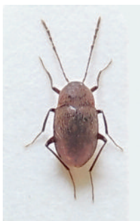
Slika 1: Aphaobius robustus – naravna velikost 2,8 mm.