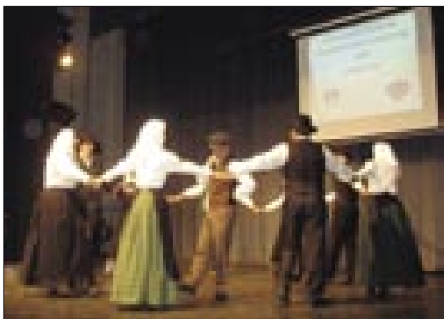
Sakalauvčari so se sükali v nauvi gvantaj

Organizatori so začnili vküpspravlati festival že januara. Na toj gali so steli nutpoka-