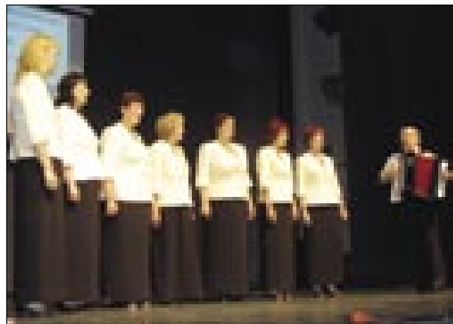
Sombotelke pesmarce se s pesmimi spominajo na rojstno krajino

je nutpokazala skupina Crazy Dancers , člani štere so plesali moderne, merkanarske plese na engleško muziko. Istina, ka so trn dobri bili, depa pitanje, če je tau na Narodnostni festival valon. Ovak je vsikša ciganjska skupina dvakrat duže na odri bila, kak je zgučano bilau. Gda so pa romske skupine zgotovile, so vsi zamaj odišli domau. Pri Rovatj sta zvekšoga vsikder dva zbora vküper spejvala, eške