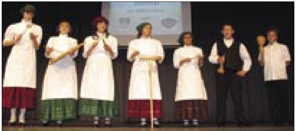
Sinički mlajši igrajo na paverske škeri

Že od zranka so leko najgir lidgé vidli razstave v auli MMIK-na. Fotografije so kazale, kak gnes manjšine živejo. Slovenci smo se nutpokazali s