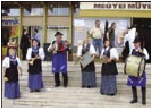
Vsigder veseli gorički goslarge so tö nej falili

leypo vrejmen, aj se muzičari vanej tö nutpokažejo. Ovak so se voditeli tak odlaučili,