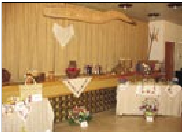
Porabje se je nutpokazalo z ročnimi deli

šest kejpami Karela Holeca , romske fotografije so kazale ciganijske držine. V trej kotaj so se manjšine pokazale s predmetami (tárgyak), Rovatke so na priliko vōdjali dela rezbarja (fafaragó). Gospaud, šteri je je naredo, je Vogrin, depa kak sodak je prišo v rovačko vesnico Petrovo selo. Gnes je fejst aktiven, dosta dela za ves, rezanja lesá je njagvi hobi. Na stolaj pa na stejnaj je leko lūstvo vidlo križe, svet-