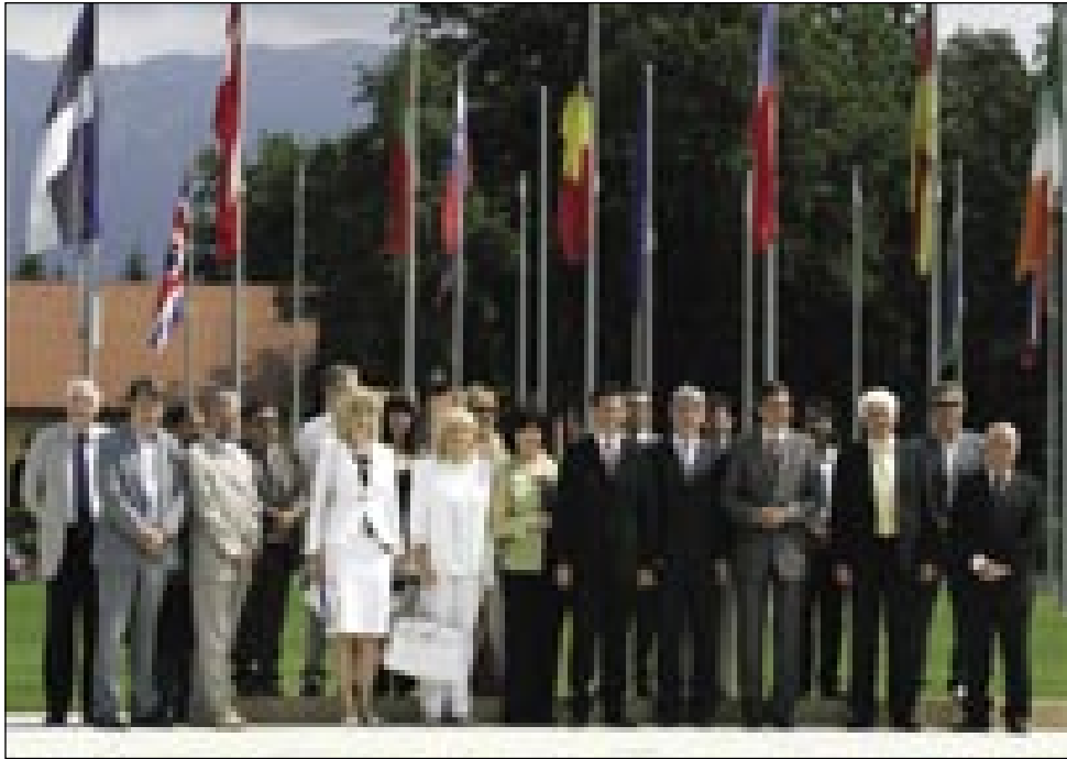
Politiki, referenti in organizatorji okrogle mize na Brdu pri Kranju