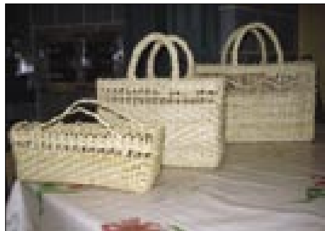
Lepau spleteni cejkri

»Velke cejkre, male cejkre, te za daritev cejker, stauce nutpletom, pa ešče papuče pletem.«