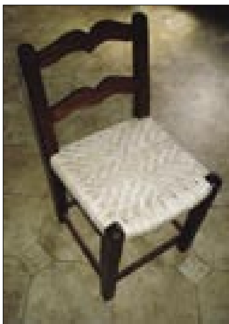
Stolec se tō leko nutspleté

»Tŭ v vesi nej, dapa na Slaskom tak do petnajset eurojev. Steri so menši, za tiste pa menje dajo. Ka so za dar, kama se eden glaž notra leko deje, za tiste tak pet, šest. Dapa kak pravijo, tau je nej plačano delo.«