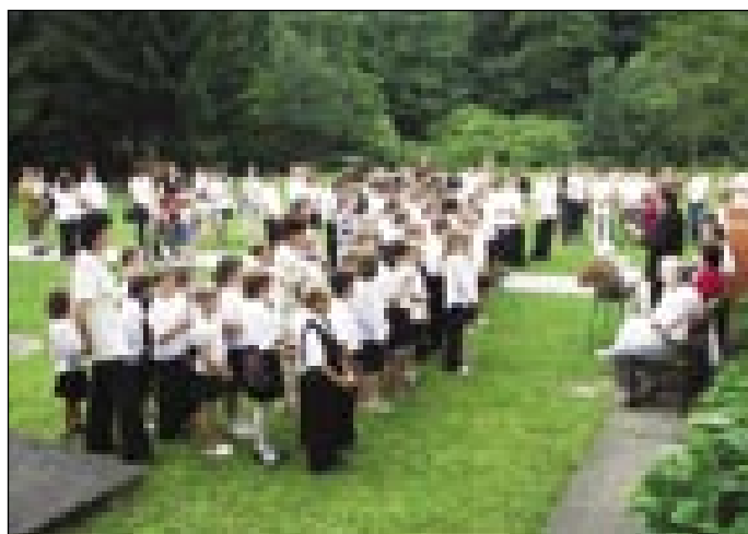
Učenci, učitelji, starši in gostje na zaključni slovesnosti DOŠ Gornji Senik

Septembra bo torej vse lepo in novo. Ne bomo več razmišljali