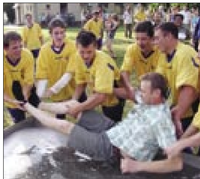
Tudi predsednik društva ni ostal suh

na vaščane. Vsako drugo nedeljo, ko ekipa igra doma, je skoraj cela vas - vsaj polovica - na tekmi in navija za fante z istim ali pa še večjim navdušenjem. Ekipa je odigrala 27 tekem, zmagala