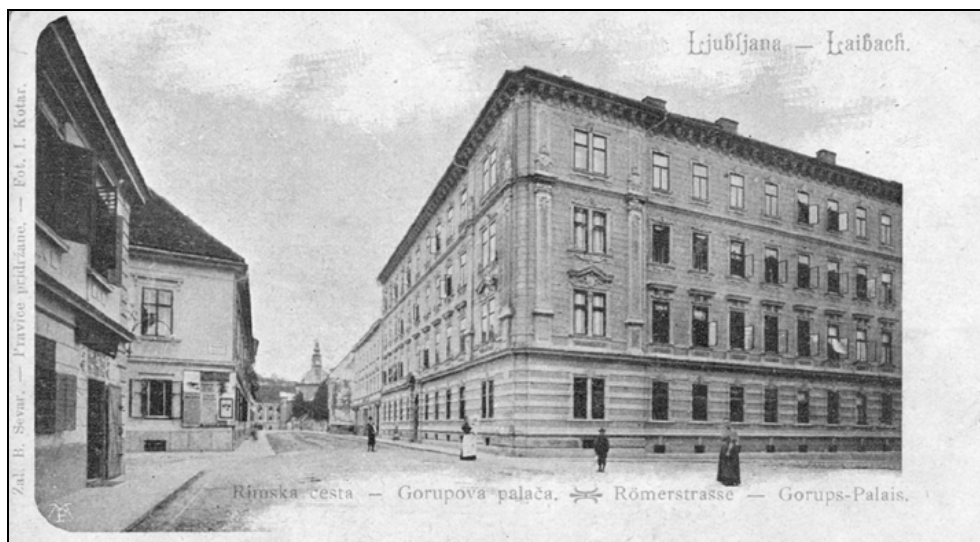
Gorupova palača, zgrajena na vogalu Rimske ceste 9 in sedanje Slovenske ceste.