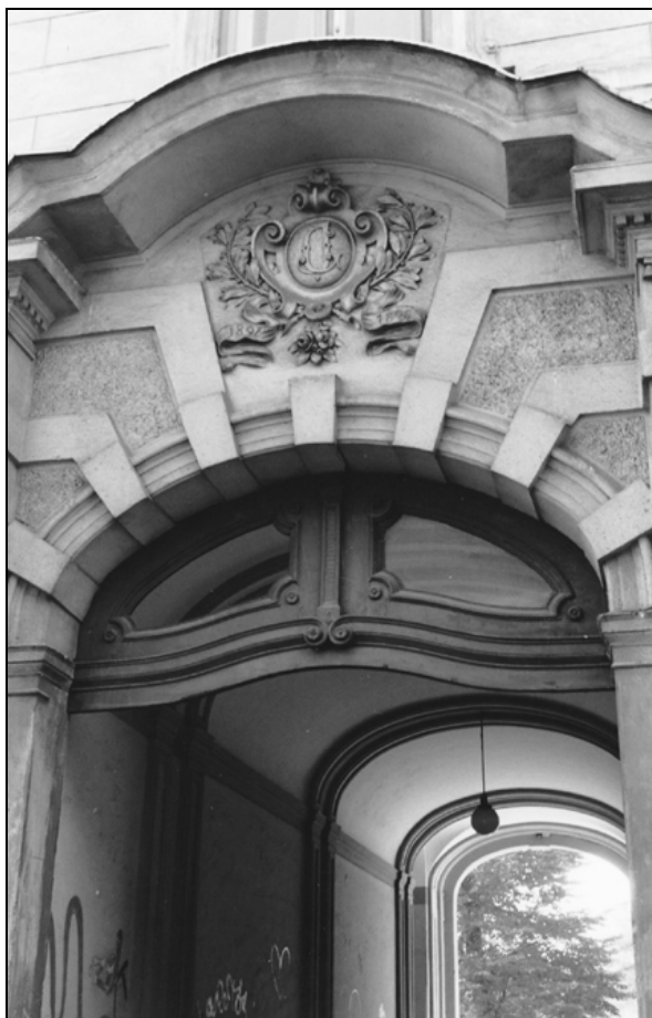
Gorupova palača, Rimska 7, vhodni portal z inicialami lastnika, 2009 (foto: Vesna Bučić).