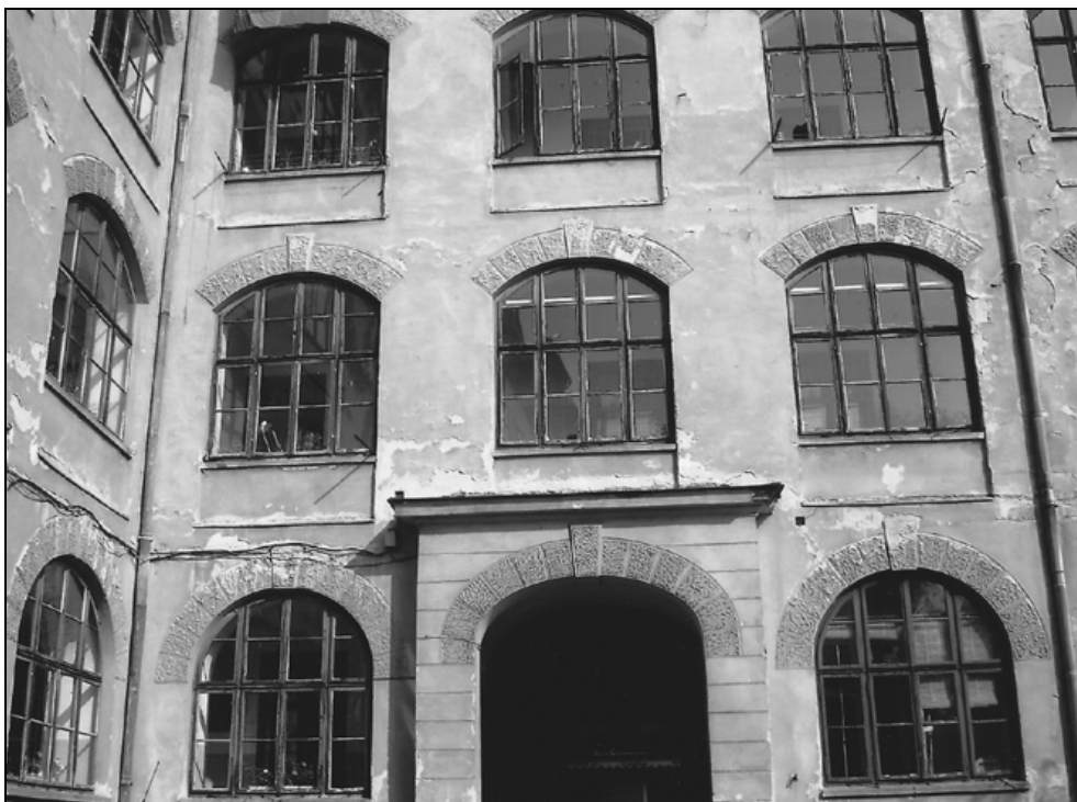
Gorupova palača, Rimska 7, dvoriščno pročelje, 2009.