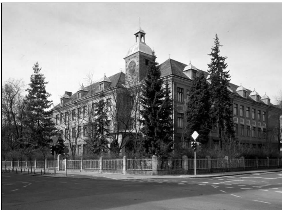
Mladika, nekdanji deklinski licej, danes Ministrstvo za zunanje zadeve RS, 1998 (foto: Miran Kambič, INDOK center, DKD Ministrstva za kulturo).

učilnic, risalnico, dvorano za ročna dela, nekaj kabinetov, knjižnico in telovadnico. Že tedaj so razpravljali o posebnem internatu za dekleta, ki so ga najprej načrtovali v prizidku šole. Denar je bil spodbuda za iskanje projektanta nove stavbe.