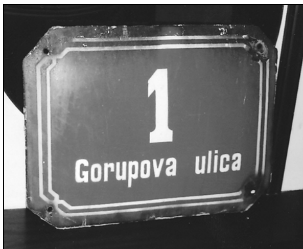
Tablica s hišno številko iz nekdanje Gorupove ulice (last: Alfred Whycombe Gorup, London).

Stanovanja v obeh hišah so bila za svoj čas udobna in zračna. Vodovod je bil speljan v hiše, prav tako kanalizacija. Toaletne prostore je imela vsaka stanovanjska enota. Sobe stanovanj so imele parket, pomožni prostori so bili opremljeni bolj špartansko, z ladijskim podom. Hodniki so imeli tla iz teraca.