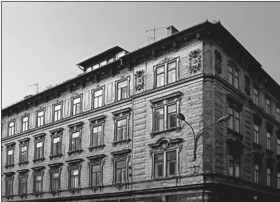
Gorupova palača, Rimska 7, vogal pročelja, 2009 (foto: Vesna Bučič).