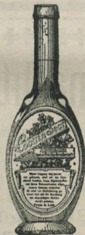
per Orig.-Bouteille 1 fl. 20 fr.

Amsterdamer Liqueur-Fabriks-Commandit-Gesellschaft in Mödling bei Wien.