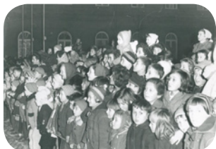
Prihod dedka Mraza v Maribor leta 1959

Nadaljujemo s spomini na 60 let delovanja ZPM Maribor. Dedek Mraz otroke v Mariboru obiskuje že 65 let.