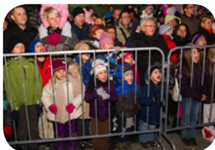
Prihod dedka Mraza v Maribor leta 2013