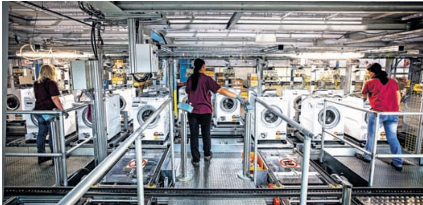
Proizvodi višjih in srednjih cenovnih razredov predstavljajo že četrtino prodaje Gorenja.

V tretjem četrtletju načrtujejo izboljšanje prodaje za vsaj tri odstotke v primerjavi z lanskim letom in deset odstotkov v primerjavi z letošnjim drugim četrtletjem. V zahodni Evropi naj bi ta narasla predvsem Nemčiji in Skandinaviji. Pomembno rast pričakujejo v Rusiji, kjer so trenutne napovedi prodaje skoraj na ravni tretjega četrtletja lanskega leta. Rast pričakujejo tudi na trgih zunaj Evrope. Če bo tako, bodo tudi izpolnili letošnje prodajne aktivnosti, na čisti poslovni izid pa bodo še vedno vplivale razmere v Rusiji in Ukrajini.