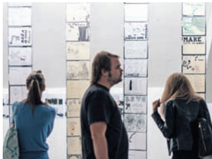
Brhka robotost v Pekarni

Nastala je razstava z naslovom V iskanju, saj je v iskanju ideje sam proces postal projekt. Večmedijska razstava bo v podhodu pri Vili Bianci na ogled do sobote, 29. avgusta, od 15. do 19.