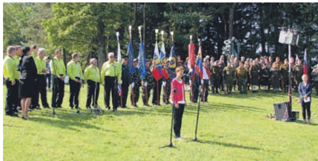
Zbrani so na nogah pričakali praporščake ter Duletovo in Novomeško partizansko četo, Šaleška konjenica je tudi letos ponesla vence na Grmado in Hribarski vrh, igrala je Godba veteranov Univerze za III. življenjsko obdobje Velenje, po slovesnosti pa je vse zabaval Ansambel bratov Avbreht.