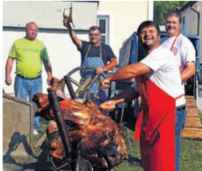
Stari trg je v soboto popoldne spremenil podobo. Živahno je bilo pod odrom in na starotrški tržnici. Vol, ki se je pekel vse od jutra, je sredi popoldneva že pošel.

Letošnji Starotrški dan, glavna prireditev Turističnega društva Šalek, privabil veliko obiskovalcev – Pester program nadgradila predstava, v kateri so reševali princesko