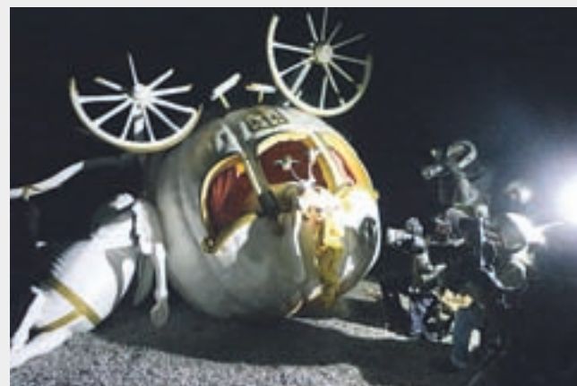
Banksy, Cinderella's crash scene, Dismaland, Tropicana Weston Super-Mare, 2015. (vir: The Guardian)

Ne bom rekla, da sem se zabavala ob opazovanju slik iz Dismalanda, niti slučajno, sestavljene domisljice presegajo meje še tako sarkastičnega črnega humorja. Sem pa začutila spoznanje resničnosti, ki ga je umetnik Banksy dobil ob svojih umetniških projektih po vsem svetu, ob boku vojn, človeškega trpljenja, kapitalističnega merjenja moči in poznavanja ozadij, ki pripeljejo družbo v stanje smrti moralnih vrednot, sprememb sistema vrednosti in na koncu izgube človečnosti in empatije.