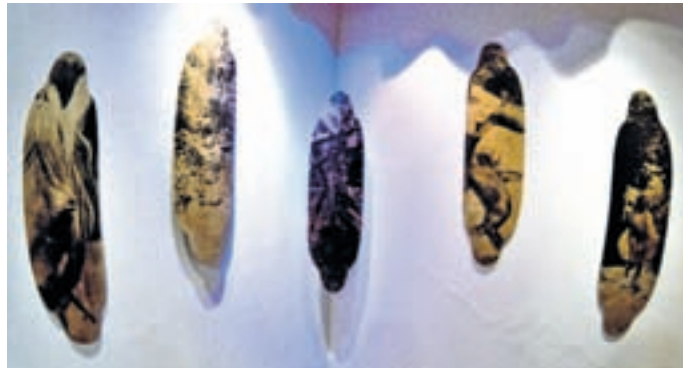
Sapindalografija v Galeriji eMce plac

in oblikovanje, se je izgubila v odsotnosti ideje za študijski projekt, ki jo je iskala v snu na blazini v obliki vprašaja, utrjenih mislih v beležki, pogovorih s partnerjem in skozi to v sebi sami. Absolventsko leto je preživela na