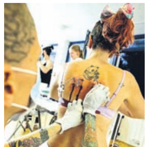
Kavlji se vstavljajo v kožo (tudi globlje, v maščobno tkivo) po celem telesu – odličnic, hrbta, prsi, trebuha, ritnic do kolen. Po suspenziji ostane občutek pritiska, sončne opekline, utrujenih mišic. Dan po suspenziji se iz ran iztisne zrak, ujet pod kožo, ki pravzaprav omogoča visenje, saj blaži bolečino. Rane pa se zacelijo v dveh tednih in pustijo le drobno brazgotino.

Izkušnja je odvisna od splošnega počutja, psihičnega stanja v življenjskem obdobju, razloga, zakaj se odločimo za suspenzijo. Načeloma se lahko suspendira vsak, »samo premagati moraš ego, ki ti govori, da ne mo-