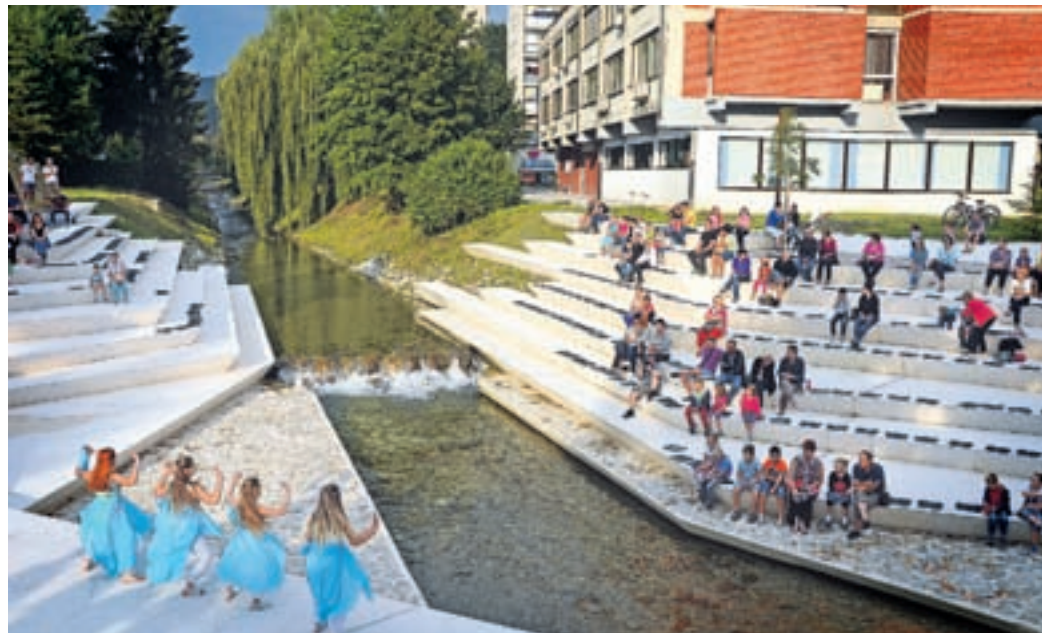
Eni so mlade plesalce opazovali z mostu, drugi so se udobno namestili na stopnice amfiteatra. Prizorišče, ki je najlepše poleti, bo zagotovo v prihodnjih tednih še kdaj oživel.