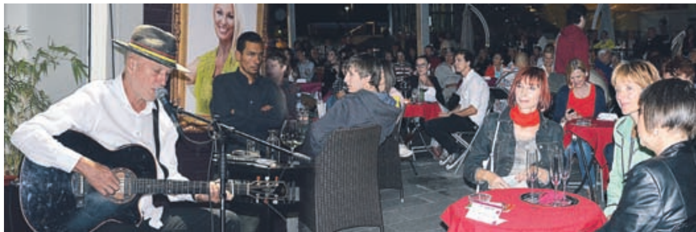
Vlado Kreslin tokrat ni le pel, svojo poezijo je res številnim obiskovalcem literarno-glasbenega večera tudi pripovedoval.