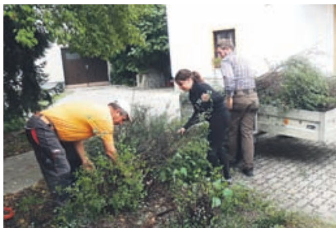
V akciji so dijaki skupaj z občinskim javnim delavcem urejali javne površine ali opravljali manjša vzdrževalna dela v občinskih objektih.

V okviru akcije »Porihtajmo si Šmartno« so dijaki opravljali različna dela, s katerimi so pripomogli k lepšemu videzu kraja. Večino delovnega časa so pomagali komunalnemu delavcu pri urejanju javnih površin in pokopališč – pri obrezovanju živih mej, pometanju pločnikov in dvorišč ter odstranjevanju plevel-