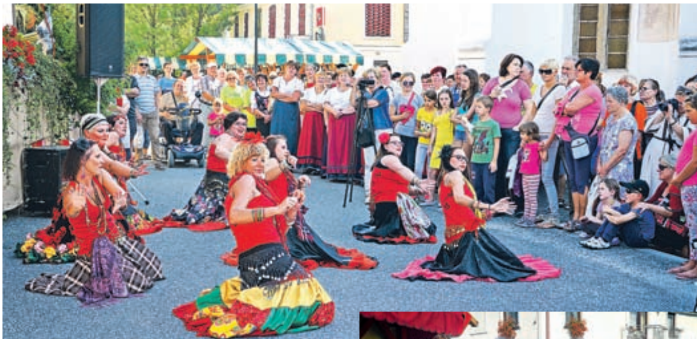
Med obiskovalce prireditev so se pomešali vitezi, princeze, ciganke, starotrška gospoda ...

Središče Šaleka, trg pod graščino, se je v soboto popoldne in zvečer res spremenilo v zgodovinsko prizorišče. Na vsakem koraku smo srečali srednjeveško gospodo in viteze, vmes so se pomešale ciganke, pa tudi drugi nastopajoči so utripu dogodka dodali svoje.