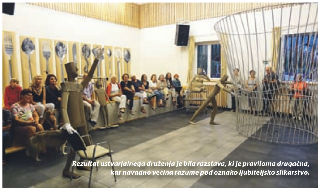
Rezultat ustvarjalnega druženja je bila razstava, ki je praviloma drugačna, kar navadno večina razume pod oznako ljubiteljsko slikarstvo.

nemo z nezahtevnimi detajli, ki so sestavni del določene teme. Iz tega nastane vedno nekaj krasnega. Pritegne me tudi kolektivni duh, mentorjeva čudovita pomoč pri reševanju vprašanj, čudovito okolje in odprti domačini, ki so vedno pripravljeni pomagati. Še bom rada prišla.«