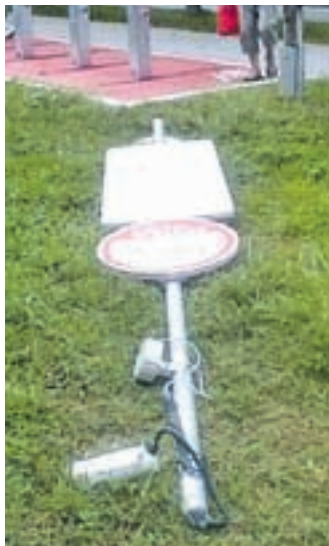
Komu je bil v napoto drog?