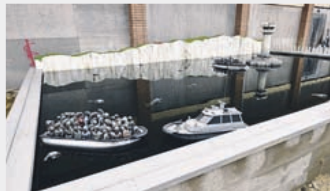
Banksy, Refugees scene, Dismaland, Tropicana Weston Super-Mare, 2015.

Tako! Sedaj ste tisti, ki vas je moja današnja tema pritegnila, že našli slike in si ustvarili o njih svoje mnenje. Za prilogo kolumne sem izbrala sliko 'Begunska scena', v kateri lahko z daljincem obiskovalci tudi vodijo čolne, tako tiste z begunci kot tudi patrolne oz. policijske.