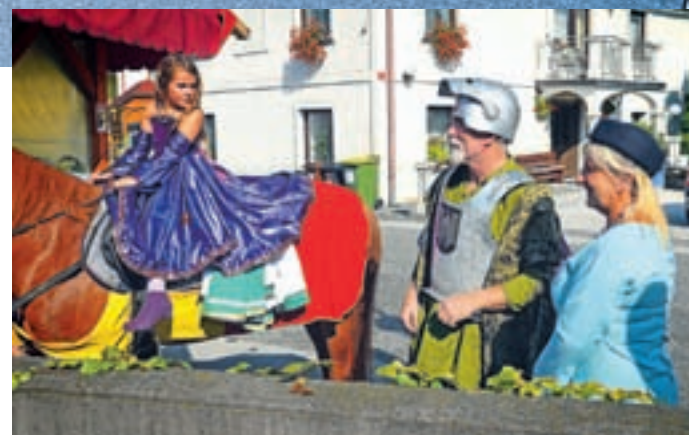
Reševanje začarane grofične, ki je dolga leta spala pod Šaleškim gradom, je bilo napeto. Končalo se je srečno.

Ko se je začelo mračiti, je bil čas za pravljico. Tokrat za Šaleško