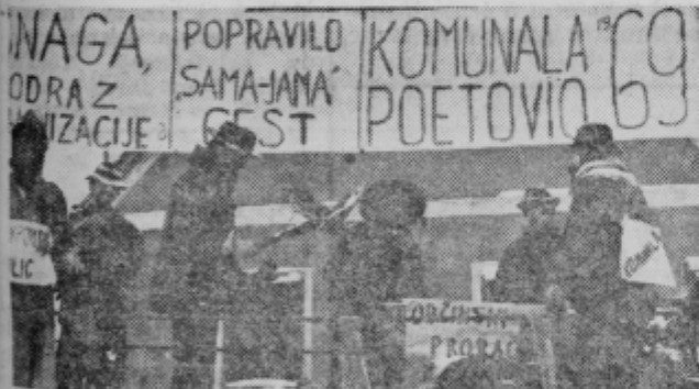
Kritika na račun slabega vzdrževanja ulic in cest...

Vsem, ki so nastopili, gre posebna zahvala, saj so kljub izredno slabemu vremenu, uprizarili pohvale vreden karneval. Pohvaliti je treba