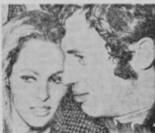
Slika prikazuje sedanja za- konca, ko sta še na »koruzie« živela v razkošni vili v Pa- rizu

Največ prahu sta v zadnjih mesecih v svetovnem film- skem svetu vzbujala Jean- Paul Belmondo in Ursula Andress. Posebej pa Jean, ki je pred leti trdil, da je nje- gov zakon večen.