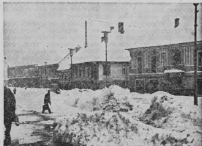
Pogled na center Slov. Bistrice