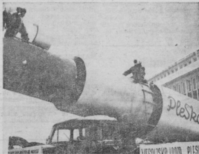
Vesoljska ladja »Pleskar« I, je vzbudila splošno pozornost. Bila je tako visoka, da sta veseljca večkrat pomislila na trda tla...

so tudi zapeli. Vmes so zaigrali tudi muzikanti. Med drugim sem se čudil volji in želji nastopiti v pustnem obredu. Vse kaže, da za Dravsko in Mursko polje, za Slovenske gorice in Haloze je