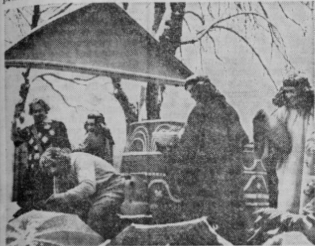
Ze stari Rimljani so radi pili vino in se veselili (Slovenske gorice)

bolizirala velike komunalne potrebe v ptujski občini. TP Panonija je prikazala delo »ustavnega sodišča«. Ze dalj časa iščejo trgovska, gostinska podjetja in občinska skupščina ustrezne takse za alkoholne pijače. Dogovori niso uspeli in TP Panonija je predalo zadevo ustavnemu