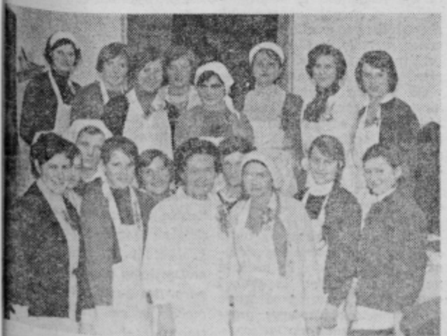
Udeleženke gospodinjsko kuharskega tečaja v Juršincih

● Pravi prijatelj muzike bo prislonal uho h ključavnici kopalnice, v kateri poje mlada dekleta.