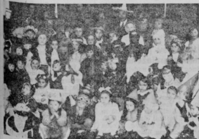
Tudi za najmlajše je pustno rajanje lepa zabava. Vsako leto se poveselejo v Narodnem domu

tudi prireditelje, ki prav tako niso klonili. V primeru primernege vremena bi bila prireditev prav gotovo mnogo boljša. Menim, da v tem primeru ne bi zamen pričakovali 20.000 obiskovalcev. ZR