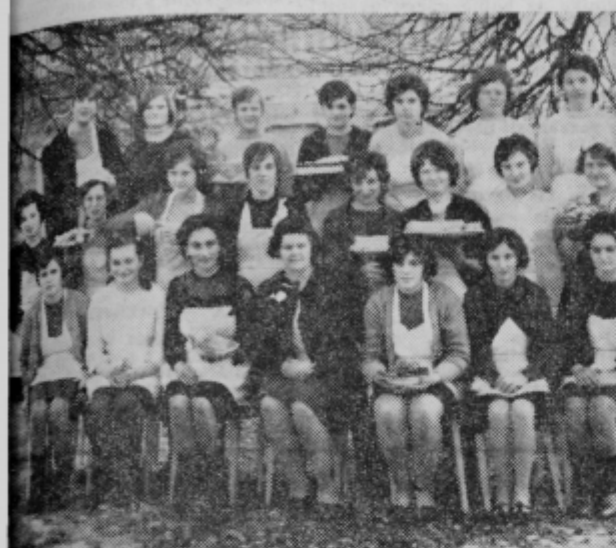
Bodoče velikonedeljske kuharice so za ta skupinski pometek pripravile tudi nekaj svojih specialitet, ki vabijo v pladnjeve in krožnike.