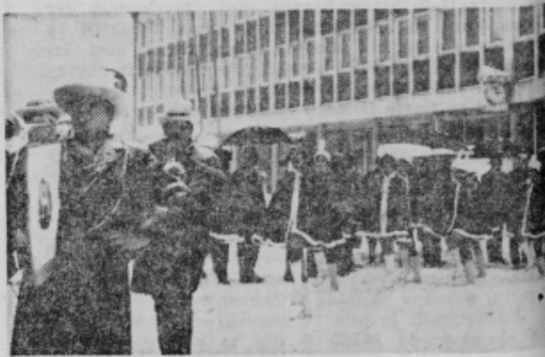
V karnevalskem spredu je strumno korakala tudi dekliška garda iz Deutschlandsberga v Avstriji

Prejšnjo soboto (15. februarja) se je končal v Bologni kongres Komunistične partije Italije (1 in pol milijona članov, 8 milijonov volivcev). Kongres je v bistvu nakazal pot za reševanje italijanskih notranjepolitičnih vprašanj, se izrekel za izstop Italije iz NATO pakta ter sploh proti blokovski politiki v svetu. Najpomembnejše stališče, ki ga je zavzel kongres v zunanjepolitičnih vprašanjih pa je, da je zavrgel »teorijo« o omejeni suverenosti soci-