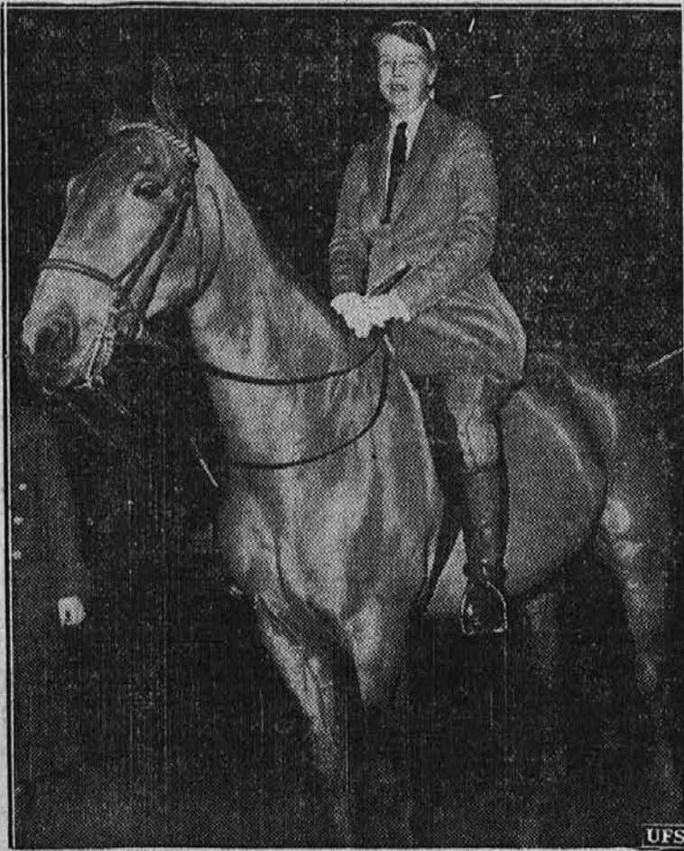
Prva gospa v deželi, Mrs. Roosevelt, je cela sportnica. Tukaj jo vidite na lepem pramčku, ko se je udeležila konjske razstave v Fort Myer, Va. Pa ji to že kar precej paše.