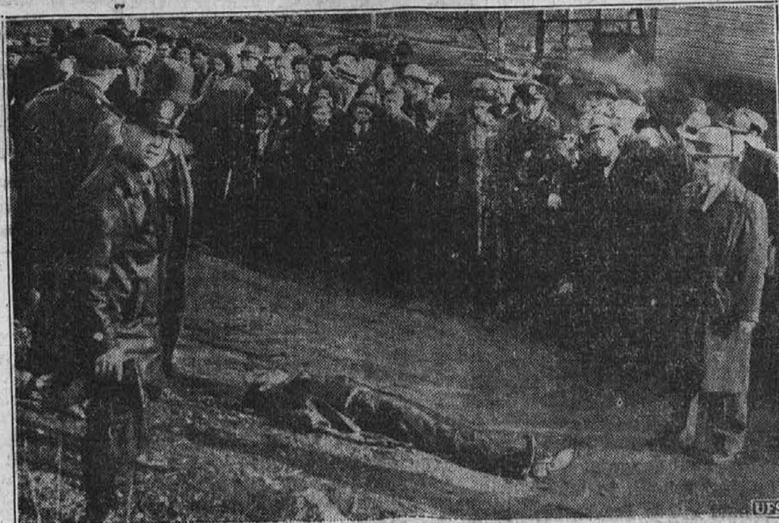
Nedavno je prišlo do streljanja v Columbusu, O. ko je policija zasačila v neki hiši štiri roparje, ki so malo prej izropali neko banko. Dva bandita, en policist in neki drugi možki so bili pri tem ubiti. Na tleh vidite ležati enega izmed roparjev, ki je padel zadet od krogel policije.

3 RINČNI NAJVEČJI ZIMSKI DOGODEK V CLEVELANDU • NOVI AKTI • ZANIMIVO • ZABAVNO 21. feb. do 6. marca Public Hall Prihranite 50% na vstopnicah Music Hall Box Office odprta zdaj Rezervirani sedeži 75c. $1.00. $1.25. $1.50