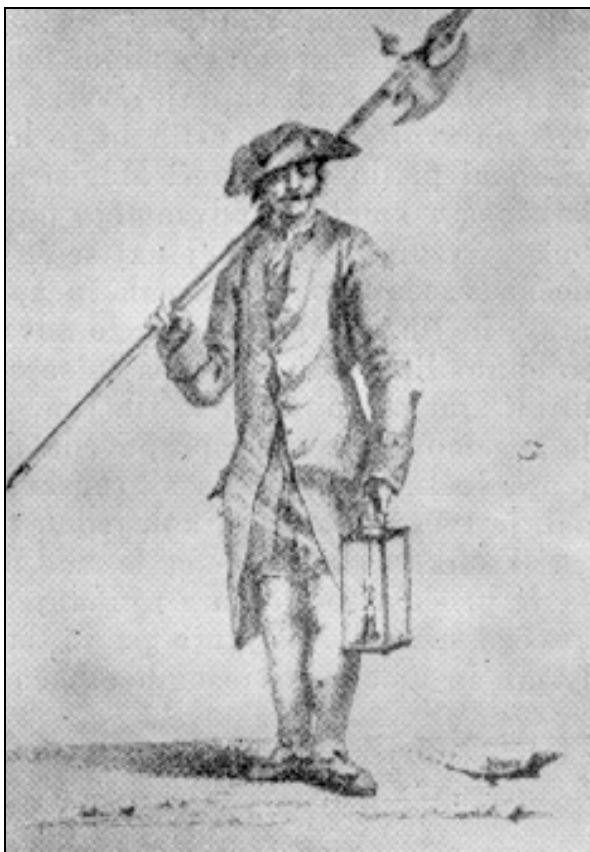
Nočni stražar, bakrorez J. Adama, konec 18. stoletja. (Josip Mal: Stara Ljubljana in njeni ljudje, Ljubljana 1957, str. 30)

Omenjena okrožnica notranjeavstrijskega gubernija z 31. maja 1786 je za cilj delovanja notranjeavstrijske policijske direkcije določila odvrčanje nesreč oziroma odpravljanje njihovih posledic, ščitenje življenja in premoženja prebivalcev, odpravo beračenja in klateštva ter pravočasno odkrivanje vsega, kar bi lahko škodovalo javni varnosti in blagostanju in izvajanje zakonov ter policijskega reda. Ukrepi v okrožnici so bili osredotočeni na prijavo tujcev in vodenje evidenc o njihovi navzočnosti. Magistratom in kresijam so naložili tudi vodenje tozadevnih protokolov, iz katerih bi v primeru izdane tiralice lahko ugotovili, ali se je določena oseba zadrževala v njihovem kraju. V tem pogledu so naložili vsem trem v notranjeavstrijski gubernij združenim deželam sodelovanje z graško policijsko direkcijo. V prilogi je bil dodan tudi vzorec protokola tujcev. 30