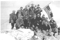
Radoveljski veterani na Triglavu

Spomnil je, da so prvič zastavo, ki je pomenila boj, svobodo in narod, ponesli na Triglav bohinjski partizani v letu 1944, naslednjic je zastava s simboliko svo-