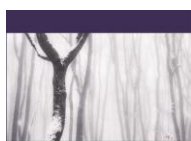
Integral Management and Governance: Basic Features of MER Model