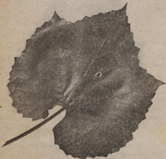
Tipičen list divjaka »BB 5«.

Kdor bi želel tozadevno še več pojasnil, ali bi se hotel natančneje poučiti o poteku poizkusov, naj se obrne na vinorejski in sadjarski oddelek Kmetijskega urada v Gorici, Via Trieste št. 43.