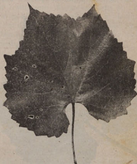
List divjaka »B B 5«.

Pri tem je bil najsrečnejši Teleki, ki je začel vzgajati divjake na debelo. Na mednarodnem poljedelskem kongresu na Dunaju je bil od Telekija vzgojen