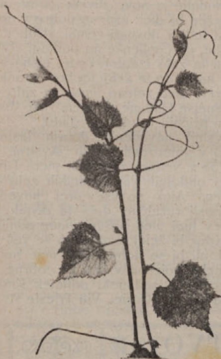
Veja divjaka »B B 5«.

Ko je leta 1890 avstrijsko poljedelstvo ministrstvo zvedelo, da se je na Francoskem izkazal divjak Berlandieri, je sklenilo, da naroči iz Francije večjo količino teh divjakov, in sicer križanke Riparia Berlandieri (420 A, 34 E. M. itd.) Berlandieri Rupestris. Ti divjaki so dejansko pokazali boljše lastnosti od prejšnjih Rupestris Monticola in Solonis.