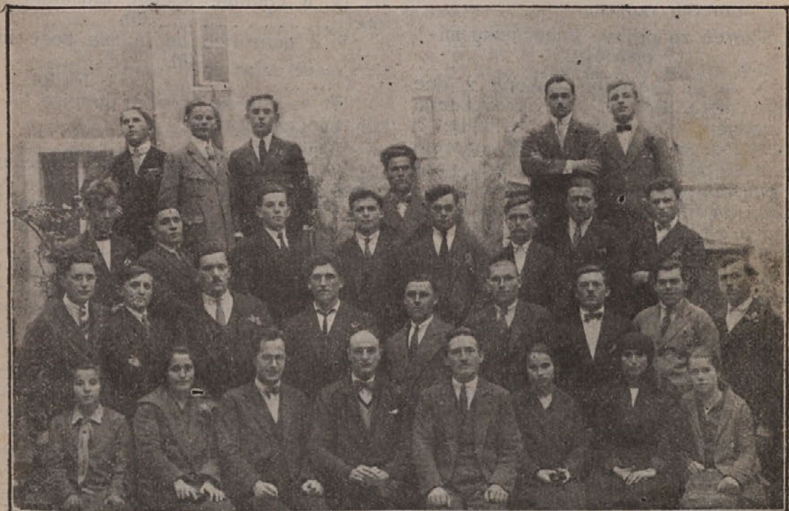
Udeležniki IV. zadružnega tečaja v Trstu.