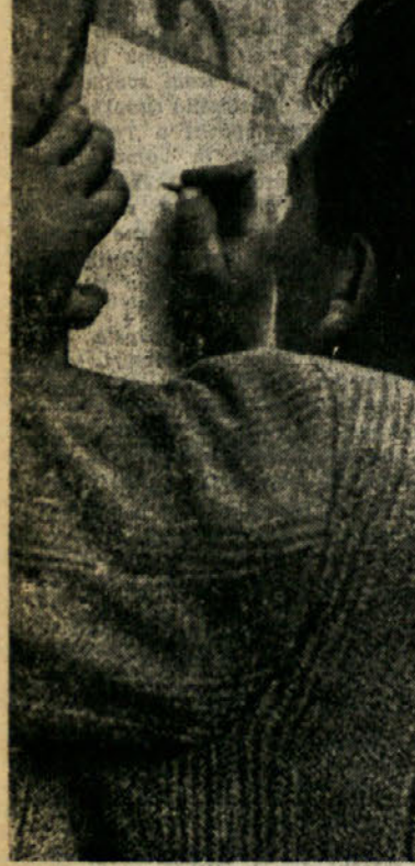
Da preprečimo novo vojno, zahtevamo s podpisom stočkolmskega poveljstva trajen mir in delo ter popolno razorožitev vseh veselij.