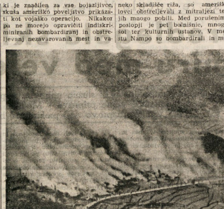
Ameriški vojniki na Korejo izkazujejo svoje gjunastvo na najbolj brutalen način...