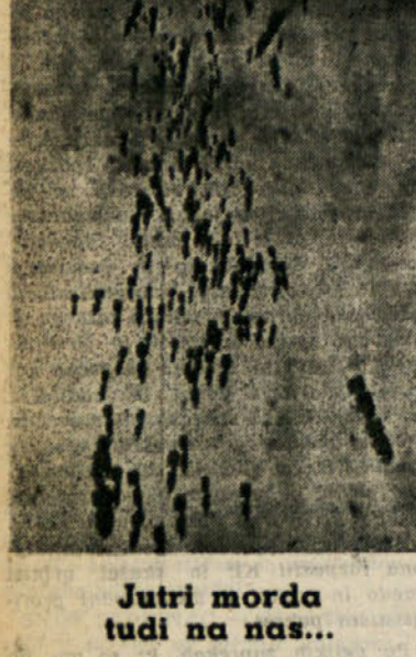
Jutri morda tudi na nas...