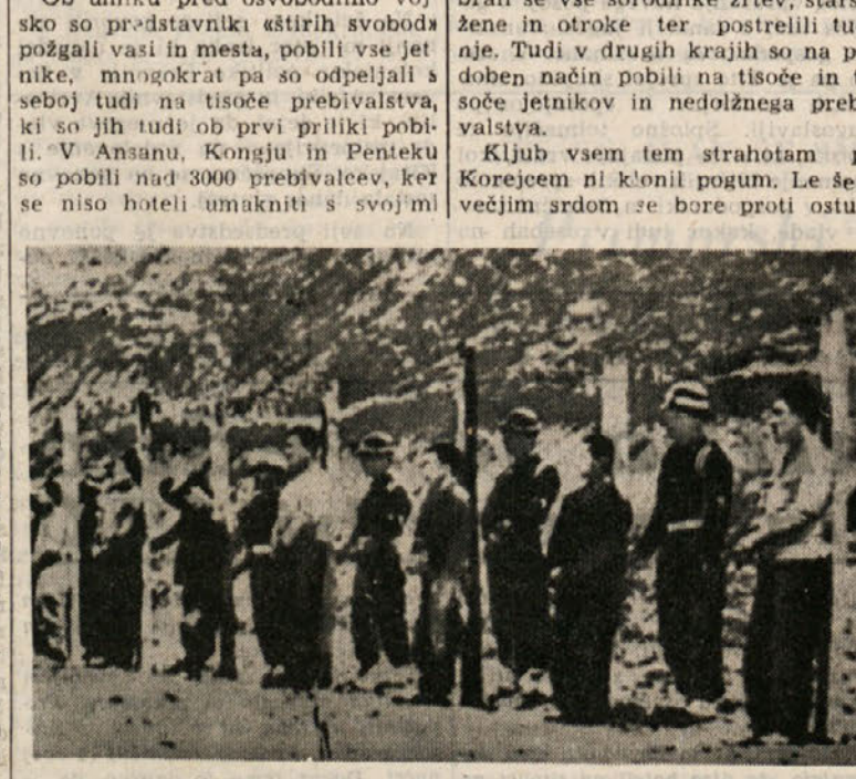
V mučenju, širjenju, množičnih pokoljih in drugih grozotah, se ameriški napadalec v ničemer ne razlikuje od SS-ovskih nacističnih hord...