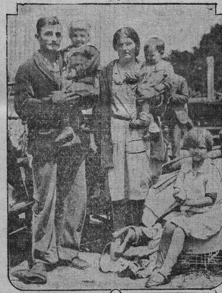
Družine tekstilnih štrajkarjev, ki so bile vržene iz kompijskih hiš na cesto, v Gastonia, N. C.