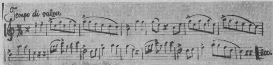
Sl. 6. Melodija valčka, ki ga igrajo pri plesu