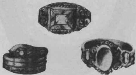
Sl. 1. Zaročni prstani