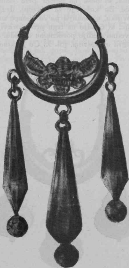
Sl. 3. Primer uhana, s katerim se okraši nevesta na dan poroke

Po končanem obredu se sprevod zopet zbere. Sedaj je nevesta ob moževi strani. Ustavijo se pri izhodu v atriju cerkve. Začne se najzanimivejši del obreda. Ob možnarju z blagoslovljeno vodo stoji starešinka in ponuja novici kolač. Nevesta ga pomaka v blagoslovljeno vodo, se z njim pokriža, nato se obrne s hrbtom proti množici in vrže kolač čez ramo, kot simbol, da vrže s kolačem vse mladostne, neresne misli. Medtem igra orkester. Množica se med seboj veselo prereka, kdo bo dobil največji kos kolača. 5