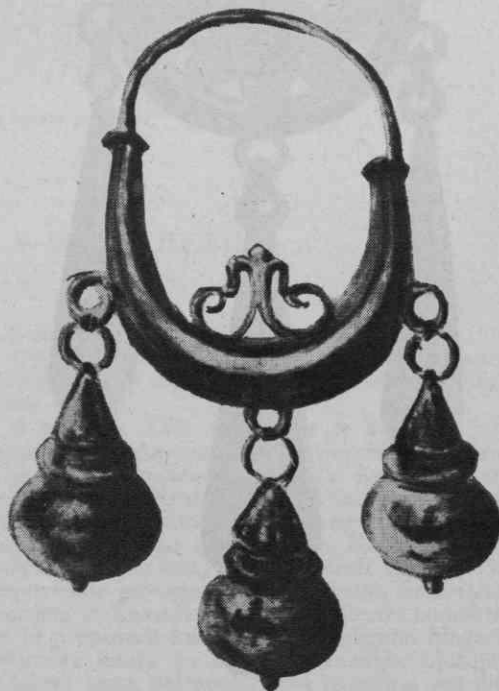
Sl. 2. Primer uhana, s katerim se okrasí nevesta na dan poroke

Z muzikantom na čelu se spreved pomika proti cerkvi. Prva za godbo gre nevesta s pričó. Sprevod zaključuje stara ženica — starešinka, ki nese na belem prtu nanizane kolače. En kolač je za nevesto, drugi za duhovnika, najmanjši pa za znanca in prijatelje, ki čakajo na trgu pred cerkvijo in radovedno sledijo poročnemu obredu. Medtem igra orkestrina. (Sl. 5.) Če je komplet-