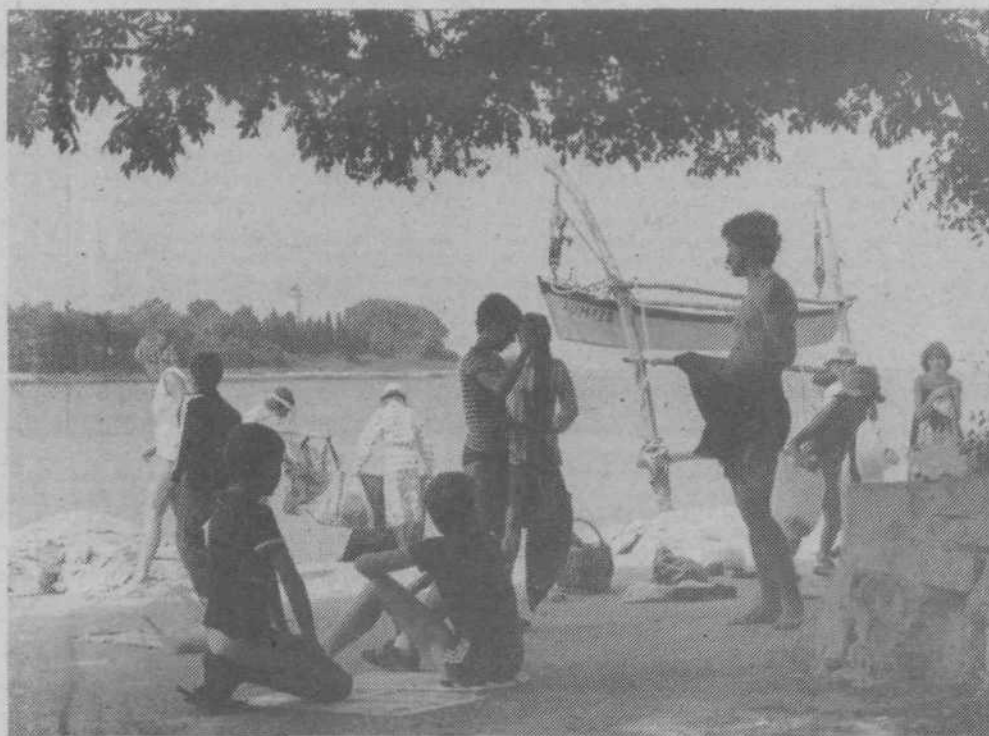
OTROCI, GREMO V ISTRO