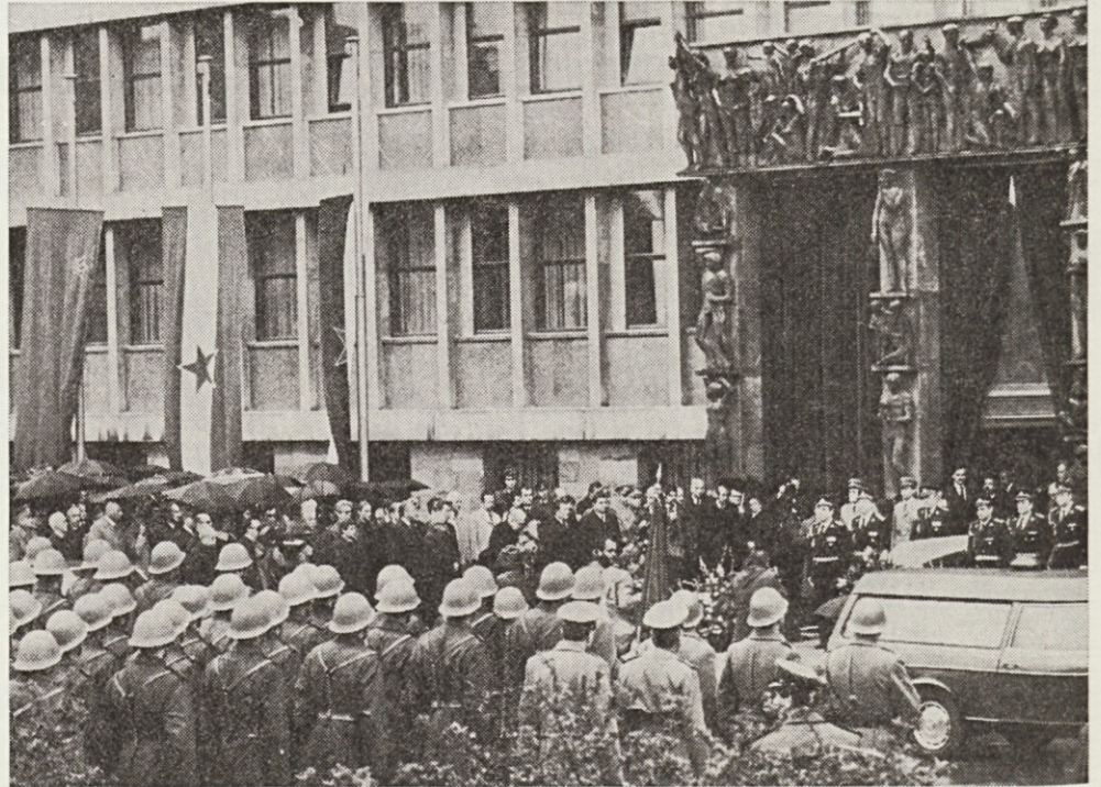
MESTO HEROJ SE POSLAVLJA — Predsednik Tito nam je bil oče, voditelj in učitelj