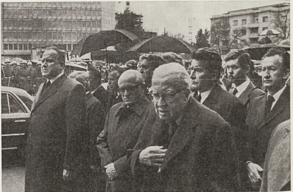
SOLZE SO ZADNJI POZDRAV, JOKAJO TUDI HEROJI