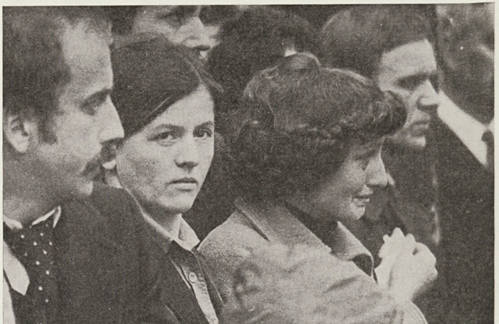
TO JE ODLOČNOST, ENOTNOST, MOČ, TO JE TIHA, TAKO ČVRSTA OBLJUBA, DA Z OPTIMIZMOM GLEDAMO V JUTRIŠNJI DAN. HVALA TI, TOVARIŠ TITO