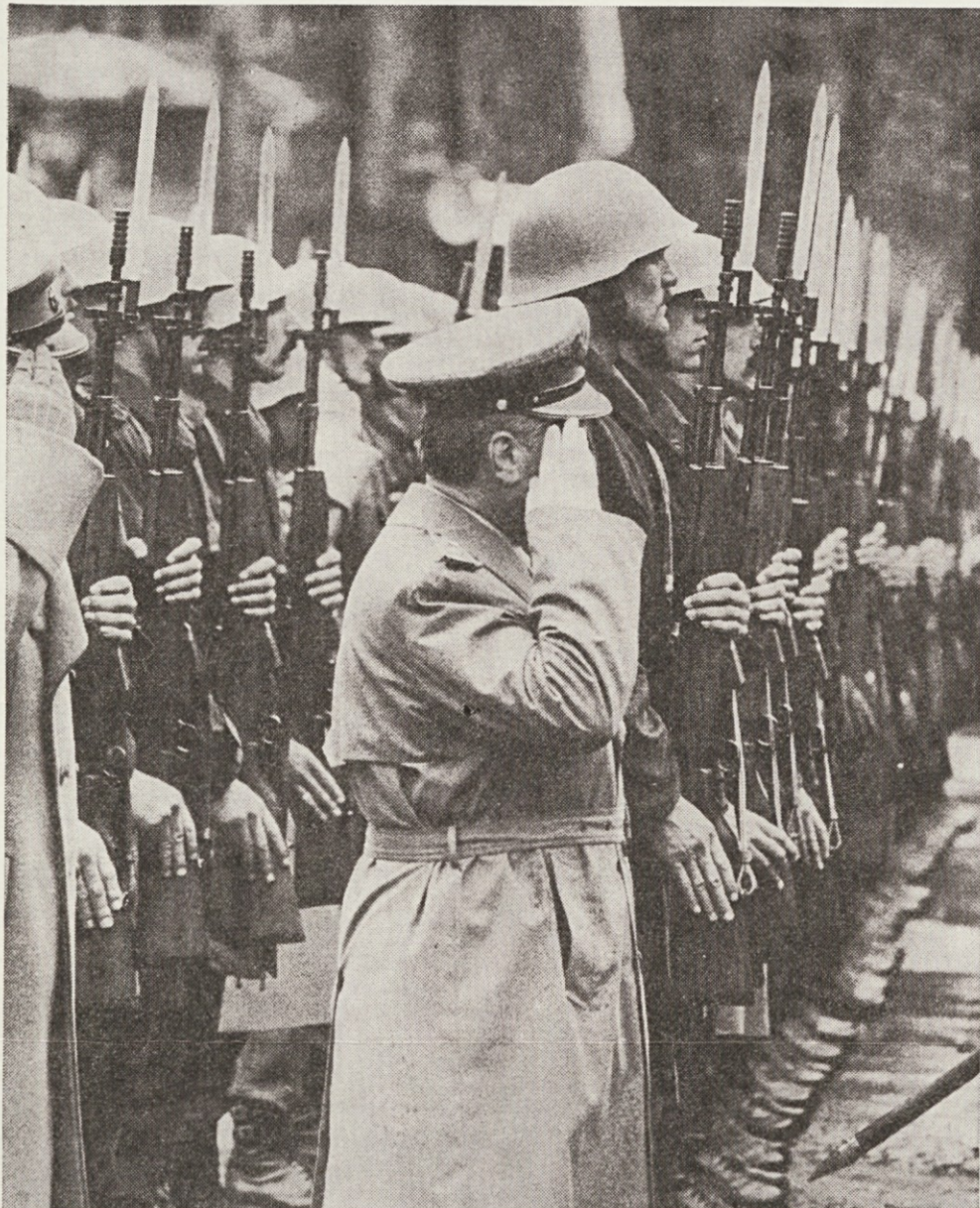
ZADNJI POZDRAV VRHOVNEMU POVELJNIKU — Ohranite bratstvo in enotnost, našo največjo pridobitev