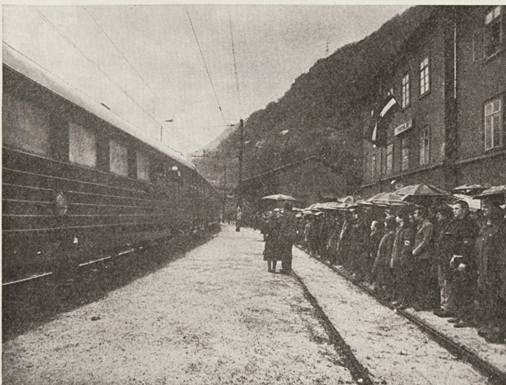
ODHAJA VELIKAN, OSTAJA NJEGOVA VELIČINA

ZAPUŠČA NAM SVOBODO KOT ŽIVLJENJE, MIR KOT SREČO IN SOCIALIZEM KOT PRAVICO