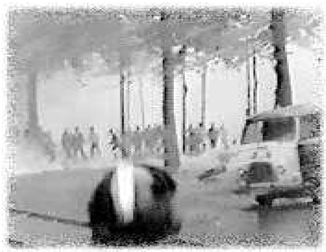
Guy Debord: Družba spektakla

sedanjega sveta, še manj pa oblikovati projekt njegovega popolnega prevrata, če nismo sposobni odkriti njegove skrite zgodovine in če ne podvržemo celotne zgodovine mednarodnega revolucionarnega gibanja (ki ga je pred stoletjem začel zahodni proletarijat) odkriti, kritični in natančni analizi. "Gibanje proti celotni organiziranosti starega sveta se je že zdavnaj končalo" (IS 7). Propadlo je. Njegova zadnja zgodovinska manifestacija je bila španska delavska revolucija, poražena v Barceloni maja 1937. leta. Toda njegovi uradni "porazi" in "zmage" morajo biti sojeni v luči njihovih morebitnih posledic in ponovno osvetljenih bistvenih resnicah. V tem pogledu se strinjamo s Karlom Liebknechtom, ki je na predvečer svoje nasilne smrti rekel, da so "nekateri porazi v resnici zmage, medtem ko so nekatere zmage sramotnejše od vsakega poraza". Tako je prvi veliki "poraz" delavstva – Pariška komuna, v resnici njegova prva velika zmaga, saj je takrat zgodnji proletarijat prvič demonstriral svojo zgodovinsko sposobnost svobodnega organiziranja na vseh področjih družbenega življenja. Medtem pa se je njegova prva velika "zmaga" – boljševistična revolucija, izkazala za njegov najbolj katastrofalen poraz. Zmaga