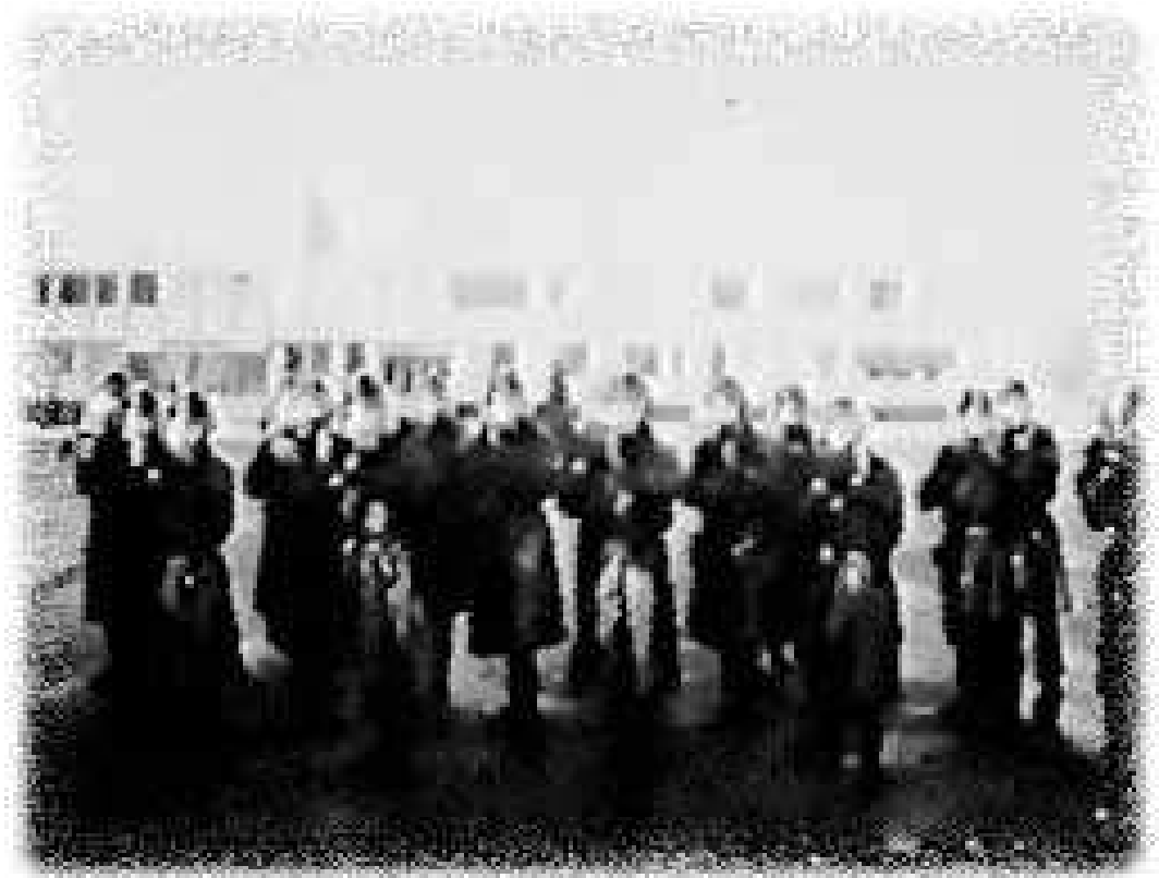
Guy Debord: Družba spektakla

12 Zadnje avanture "Zveze komunističnih študentov" in njenih katoliških vrstnikov kažejo na to, da so se vsi ti študenje povezali na osnovi enega principa: brezpogojni podrejenosti nadrejenim.