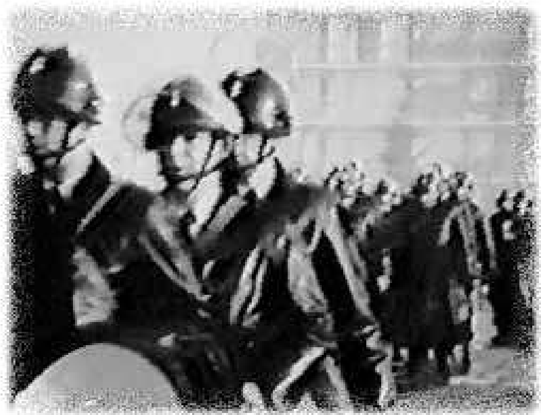
Guy Debord: Družba spektakla

postala institucionalna organizacija nevednosti; sama "visoka kultura" pa je postala degradirana na proizvodnjo profesorjev po tekočem traku, med katerimi so vsi kreteni in katerih večino bi že srednješolsko poslušalstvo izžvižgalo. Toda študent se vsega tega ne zaveda, še naprej s spoštovanjem posluša svoje gospodarje, zavedno potlači ves kritični duh, ki ga še premore, in se raje potopi v mistično iluzijo "biti študent" (biti nekdo, ki je resno predan učenju resnih stvari), v upanju, da mu bodo na koncu profesorji zaupali končno resnico sveta. Do takrat pa – menopavza duha. Prihodnja revolucionarna družba bo seveda ves trušč predavalnic obsodila kot čisti hrup oziroma verbalno onesnaževanje. Že zdaj "biti študent" ni nič drugega kot neokusna šala.