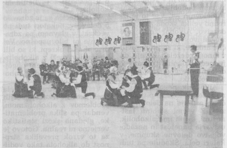
Folklorna skupina KUD Jaka Rabič z Dovjega

Bled ing. Bajt Franc ter poudaril, da je bila dosežena še ena delovna zmaga. Z novo tovarno v Mojstrani je postala naša družba bogatejša; delavcu pa s tem trenutkom dani boljši delovni pogoji za ustvarjanje dohodka. V bodoče pričakujemo od Mojstrane boljše rezultate kot do sedaj, kajti v starih prostorih in s pomanjkljivo strojno opremo tega ni bilo mogoče doseči. Ta pridobitev