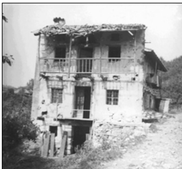
Zapuščena vrhblevna hiša na Vrbovlju leta 1953 (Šarf F. 1953, fototeka SEM).