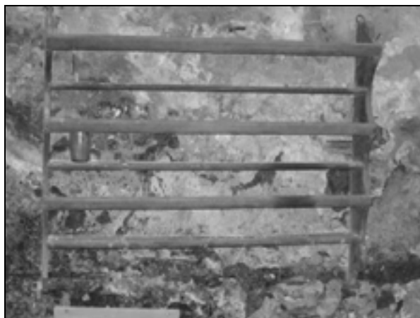
Sklednik v kuhinji zapuščene hiše v Brestju.

Običajno shrambno pohištvo za obleko so bile skrinje. V bogatejših hišah so jih imeli več in so vanje shranjevali tudi pridelke. 101 V bogatejši bali kmečke neveste so bile skrinje okovane z železnim okovjem ter ključavnico in so bile vredne 5 do 10 goldinarjev. Revnejše neveste iz sloja zakupnikov so imele skrinjo brez okovja in ključavnice v vrednosti od 10 krajcarjev do 2 goldinarjev. Dražje skrinje so bile narejene iz orehovine, cenejše pa iz smrekovine. Zaradi majhnega števila omar so bila v hiši številna slepa okna, kamnite ali lesene police, kamor so lahko odlagali posodo in orodje. V vsaki hiši je bil v kuhinji značilen lesen sklednik, na katerega so odlagali lesene ali glinene krožnike. Tako je npr. v inv. 578 popisani sklednik z 10 glinenimi krožniki. 102 Drug pogost kos pohištva je bila tako imenovana vinkla ali mentrga , kamor so shranjevali moko pa tudi kruh. Izrazit pokazatelj socialnega statusa je bila omara, ki jo dobimo v 19 inventarjih. 103 Postavljena je bila v mezadu pa tudi v kuhinji. Cenejše (okoli 20 krajcarjev) so bile narejene iz smrekovega, dražje iz macesnovega lesa in so imele že kredenco