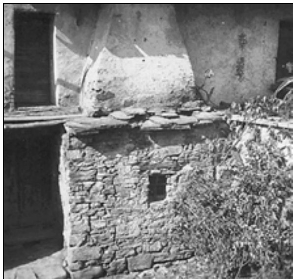
Izpahnjence-žbatafur, pokrit s skrlami v Vedrijanu št. 36.

gosto ni bil niti ometan. 16 Za 18. stoletje nam to potrjujeva dva vira: terezijanski kataster, ki v popisih za obravnavano območje vsebuje skop opis večine hiš, 17 in dobri dve desetletji mlajši opis stavb, ki spremlja vojaške zemljevide. 18 Iz terezijanskega katastra je razvidno, da so bile kmečke stavbe že v 2. polovici 18. stoletja grajene iz kamna ter pokrite z opeko ali kamnitimi skrlami. 19 Nekaj več o bivališčih kmečkega prebivalstva Brd izvemo iz Cenilnih elaboratov za kmetijska zemljišča, ki so del franciscejskega katastra. Za celotno obravnavano območje je zapisano, da so bile hiše grajene iz kamna in pokrite s strešniki ali skrlami, vendar so bile majhne 20 in v precej slabem stanju, le hiše posestnikov so bile v povprečnem stanju. 21 Nekatere stavbe so se že začele širiti, tako da so se izločila samostojna zidana gospodarska poslopja: hlev, 22 klet in žitna kašča. Stavbe so dobile tudi vrhnje nadstropje. Podrobnejše podatke o gradnji in številu