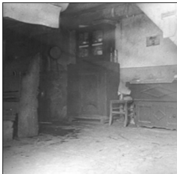
Ognjišče in oprema v kuhinji leta 1953 (Šarf F. 1953, fototeka SEM).