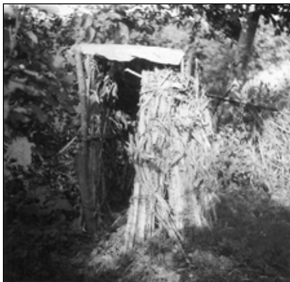
Stranišče iz koruzne slame pri družini zakupnikov v Krasnem leta 1953.

je začinjalo postavljanje enostavnih zunanjih stranišč v večjem obsegu šele v času pred in po 1. svetovni vojni. 131