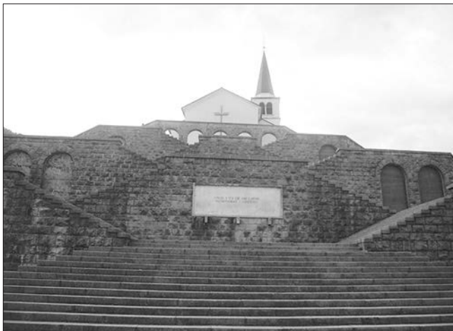
Kostnica v Kobaridu.

T. i. sites of memory/lieux de memoire (koncept, ki ga je prvi oblikoval francoski zgodovinar Pierre Nora), »kraji spomina«, kostnice, vojaška pokopališča, so bili pomembni tudi za afirmacijo nacionalne pripadnosti, še zlasti na etnično mešanem mejnem območju, kjer neka skupna identiteta še ni bila oblikovana. Pri tem je Italija zlasti na mejnih, »spornih« območjih imela še večji interes za spodbujanje obiska v namen utrditve nacionalne identitete prostora. Na primeru študij prostora se pokaže, kako določena skupnost selektivno izbira in določa njegovo/svojo identiteto, kar se kaže tudi v obmejnem prostoru, kjer v krajih spomina, spomenikih in komemoracijah interpretira »svojo« preteklost. Spomeniki in obeležja tako simbolizirajo