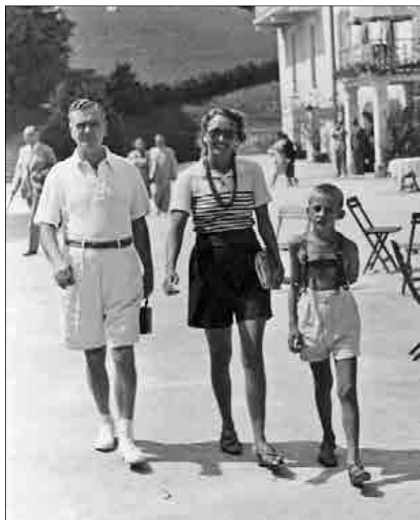
Družina na nedeljskem izletu, 1939.

Po drugi vojni je povprečna doba bivanja v zdravilišču Dobrna znašala od 11 do 14 dni, tujci so tu bivali od 3,4 do 7,6 dni. 78 Med gosti so prevladovali