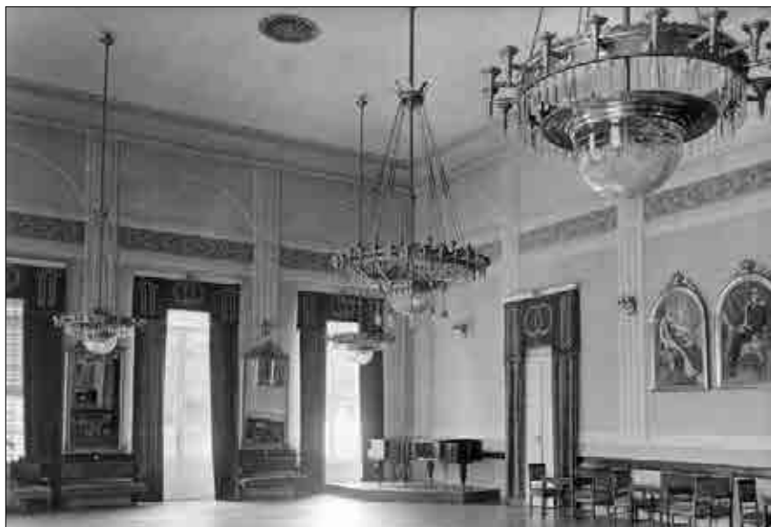
Reprezentančna, večnamenska zdraviliška dvorana, trideseta leta 20. stoletja (Muzej novejšje zgodovine Celje).