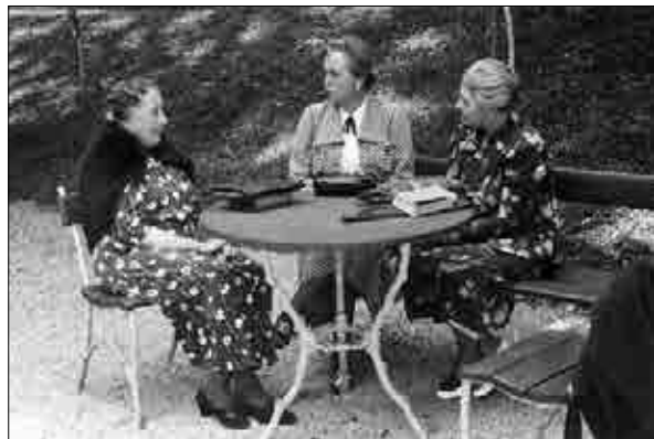
Sproščen klepet v parku, 1940 (Muzej novejšje zgodovine Celje).

Pomembno je bilo, da se je s prihodom v zdraviliško okolje vsak posameznik oddaljil od svojih običajnih poslov in vsakdanjih skrbi. 58