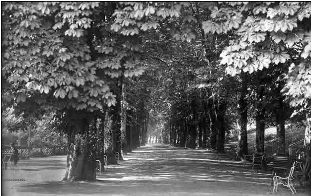
Kostanjev drevored, trideseta leta 20. stoletja (Muzej novejšje zgodovine Celje).