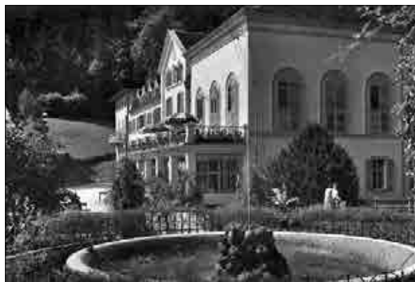
Zdraviliški dom, prva polovica 20. stoletja (Muzej novejšje zgodovine Celje).

Med prvo svetovno vojno so zdravilišče preuredili v lazaret, po vojni pa so toplice spadale najprej pod ministrstvo za narodno zdravje, v letih 1922–1929 pod mariborsko oblast, končno pa jih je – podobno kot Rogaško Slatino –, prevzela banska upra-