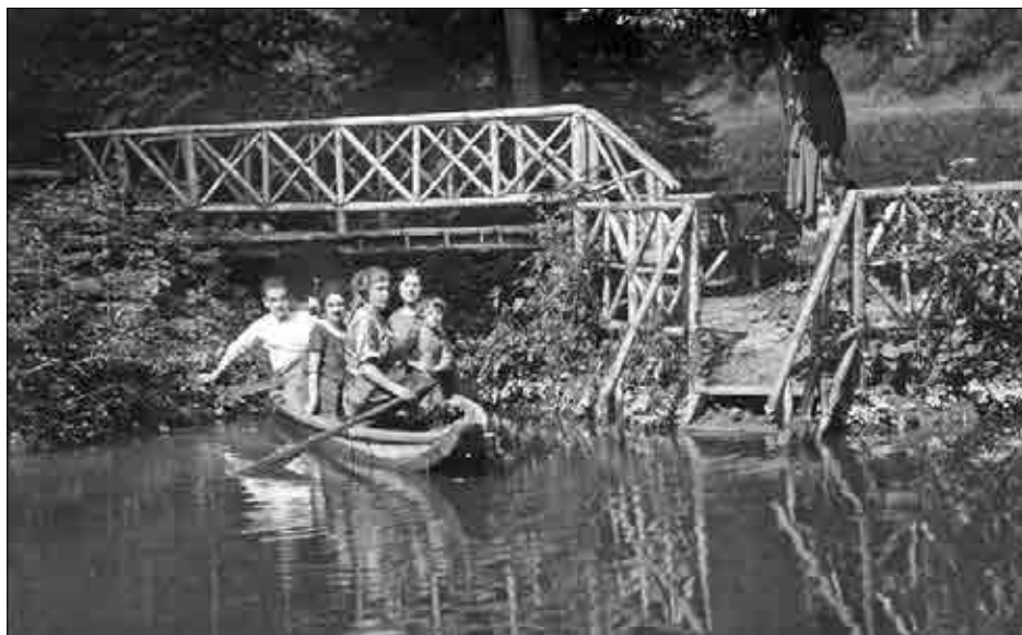
Odkrivanje skritih kotičkov v naravi, trideseta leta 20. stoletja (Muzej novejšje zgodovine Celje).