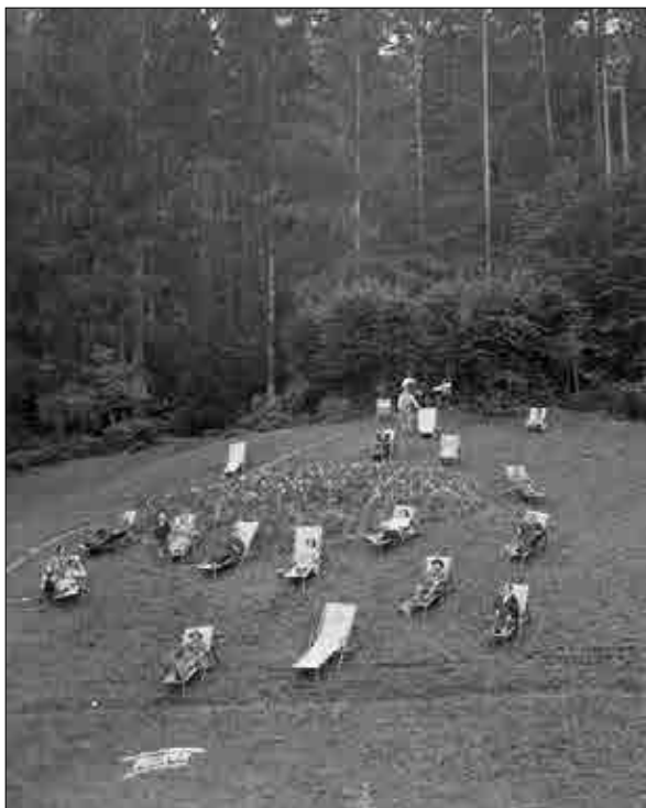
Poleg kopanja v termalni vodi so se na Dobrni posluževali tudi sončnih kopeli, trideseta leta 20. stoletja (Muzej novejše zgodovine Celje).

Na prelomu 19. v 20. stoletje je Dobrna postala eno najbolj obiskanih zdravilišč v monarhiji. Termalno kopališče se je z redno nameščenim stalnim zdravnikom spremenilo v zdravilišče. 63 Tudi število