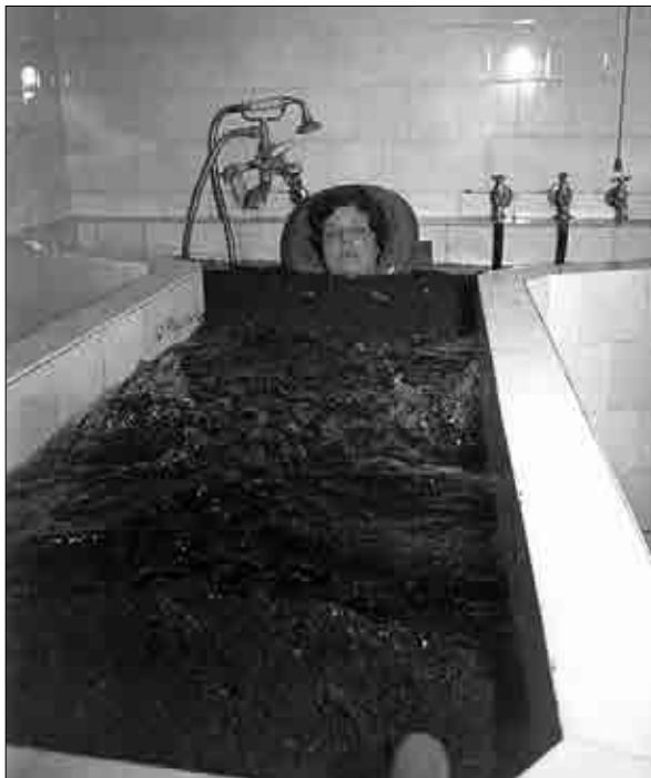
Terapija z blatno kopeljo, prva polovica 20. stoletja (Muzej novejšje zgodovine Celje).

tisti, ki so jih na zdravljenje poslali zavodi za socialno zavarovanje; čas njihovega bivanja v zdravilišču je bil od dva do tri tedne. 79