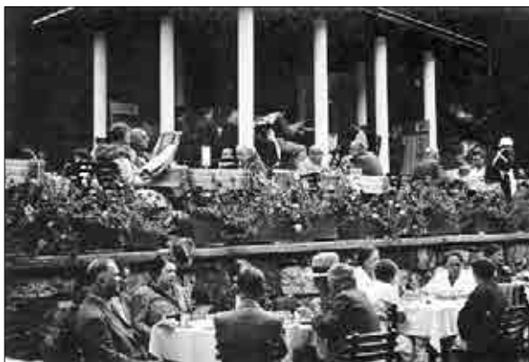
Kavarna je v toplicah predstavljala eno osrednjih družabnih točk, 1937 (Muzej novejšje zgodovine Celje).

Dobrna je že od nekdaj slovela kot zdravilišče za zdravljenje ženskih bolezni, zlasti neplodnosti. Z leti, ko so uvedli peloidno, elektro- in mehanoterapijo, so se uspehi zdravljenja še izboljšali, zato se je Dobrna uvrstila med najbolj priznana evropska zdravilišča za ženske bolezni. Je tudi priznana zdravilišče za zdravljenje bolezni lokomotorne sistema ter zdravljenje poškodb in rehabilitacijo športnikov. Termalna voda Dobrne je zdravilna tudi za bolnike s perifer-