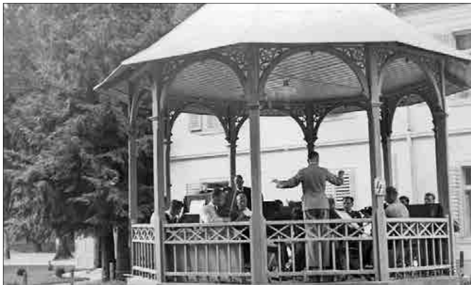
V zdraviliškem parku so se gostje zabavali ob glasbenem paviljonu, 1935.

Toplice Dobrna so v 19. stoletju torej uvrščali med t. i. naravna oz. akrototermalna, 41 pa tudi klimatska zdravilišča. 42 Poleg naravnih danosti je bila namreč termalna voda tista, ki je omogočila razvoj zdravilišča in zdravstvenega turizma na Dobrni. Posledično so sredi 19. stoletja poleg izraza toplice začeli uporabljati tudi izraz zdravilišče. 43