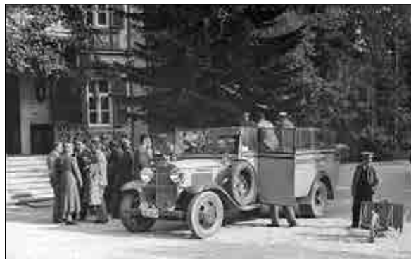
Prispeli so novi gostje, 1937.

Leta 1927 je Dobrna, podobno kot Rogaška Slatina, za prevoz gostov dobila avtoomnibus in »sta imela na vsakem letovišču oba voza dovolj zaposlenosti«. 12 Dobrna je tudi po drugi svetovni vojni seveda obdržala avtobusno povezavo s Celjem, vendar je bila sprva, zlasti med vikendi v času sezone, nezadostna. Želeli so si tudi povezave z Rogaško Slatino ter Zagrebom in Ljubljano, 13 obstajale so celo ideje o gradnji električne železnice med Celjem in Dobrno. 14