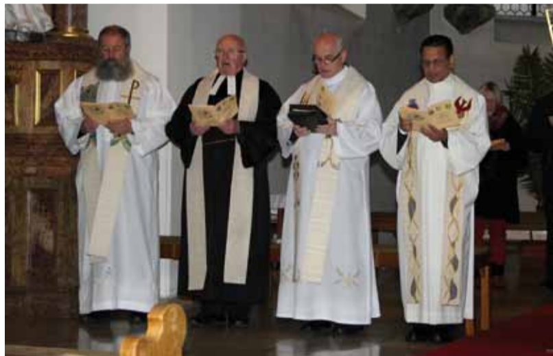
Tudi nedeljsko bogoslužje so sooblikovali duhovniki iz pobratenuj občin

Vrhunec tokratnega srečanja je bil seveda svečani večer ob podpisu listine o pobratenuju med Lešnico in Hirschaidom, ki je potekal v veliki dvorani Regnitz. Vse zbrane je sprejel