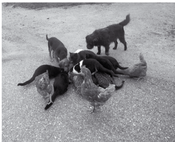
Sožitje na domačem dvorišču