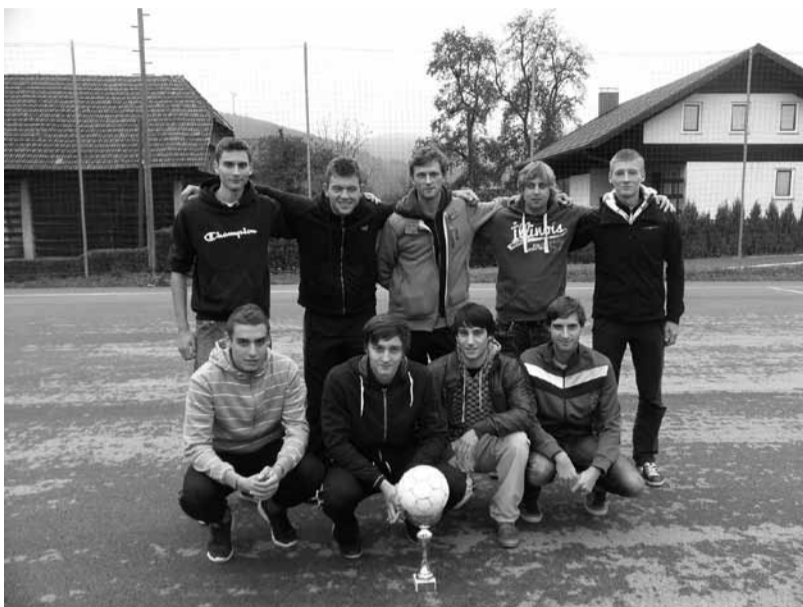
Mladi Ambrušani, prvaki 2. lige

V drugi ligi so se za ekipama ŠD Ambrus mladi in Fortuna No1 na tretje mesto nekoliko presenetljivo, a zasluženoma uvrstili igralci ekipe KIP Slovenski dimnik, katere jedro ekipe je iz okolice Zagradca. Tekmovalca v 2. ligi je zaznamovala velika izenačenost, saj na koncu 5. in 11. ekipo loči le 8 točk. Najboljši strelca v 2. ligi je postal Pri-