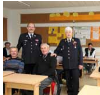
Utrinki iz razprave o prostovoljstvu in izmenjavi dijakov