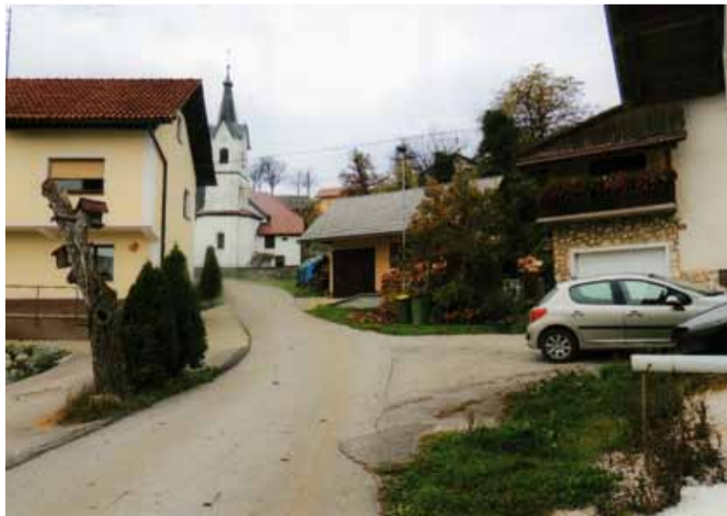
Staro naselbinsko jedro je v dolu okoli cerkve sv. Magdalene. Tam je bil včasih izvir, ki pa je danes prekrit.