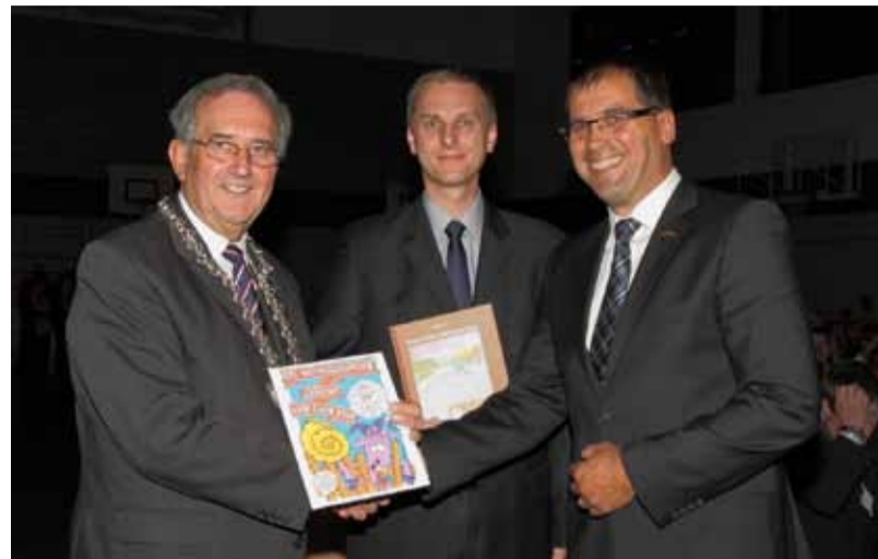
Nemški in poljski prevod Jurčičeve Kozlovske sodbe za nemškega in poljskega župana