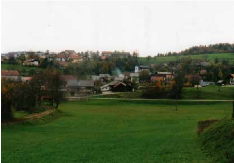
Novi del naselja nastaja na prisojnih obronkih jugovzhodno od starega jedra.

Od imen s podobno zvočnostjo naj omenim še bližnji Mekinje in Mevce, drugod na Slovenskem pa poleg Metlike še Metavno, Metleče, Metnik, Metovžak, Metni Vrh, Metulj, Metuljsko Drago in Metlovo. Tako kot naš Metnaja ima tudi večina omenjenih selišč opazne sledi iz prazgodovinskega časa. Na koncu še ena posebnost. Kraj ima zvočno sorodnost z bolezenskim stanjem, ki mu pravimo metljavost ; povzročajo jo nečlenjen organizem metljaj . Kaj pa če ima ta vrag prste vmes?