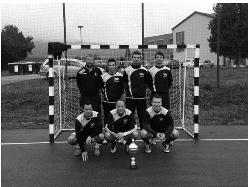
Občinski prvaki v malem nogometu, Tyson team Gačnik šport