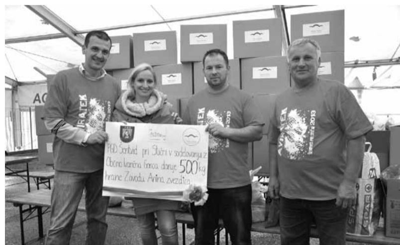
Aviratekači skupaj z šentviškimi gasilci in Občino Ivančna Gorica do 500 kg hrane za Anino zvezdico

(Blanca), Tadej Strojanshek (Blanca), Blaž Kunšek (Sevnica))