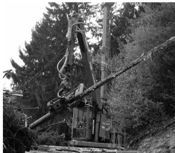
Dvigalo iz strmine potegne celo smreko k sebi, jo oklesti in razžaga na hlode