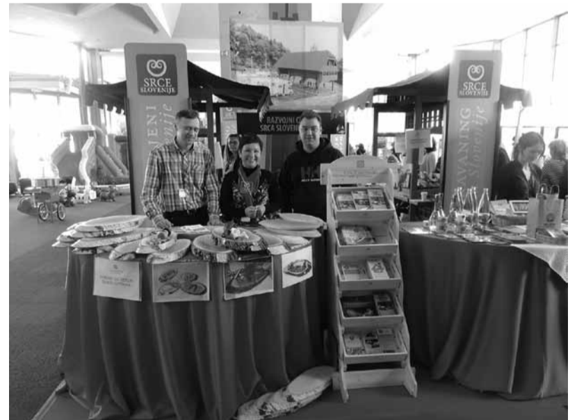
Razstavljeni prostor Srca Slovenije s ponudniki na sejmu Kamping&karavaning

Sejem Kamping & Karavaning je letos potekal vzporedno s sejmom Narava-zdravje. Območje Srca Slovenije se je predstavilo kot prva karavaning destinacija v Sloveniji, in sicer s ponudbo postajališč za avtodome, kolesarskim produktom, z novo aplikacijo E-turist in z lokalno pridelano hrano. Pred kratkim je izšla nova zloženka ponudbe za avtodomarje v Srcu Slovenije za tuje trge v angleščini, nemščini in italijanščini, v pripravi pa je tudi prenovljena slovenska verzija. V mrežo je trenutno vključenih že 18 karavaning prijaznih gostiteljev iz Srca Slovenije, ki imajo urejena postajališča za avtodome. Med njimi so tudi štiri ponudniki iz občine Ivančna Gorica: Kmetija Čož, Izletniška kmetija Okorn, Mestno kopališče Višnja Gora in Turistična kmetija Grofija.