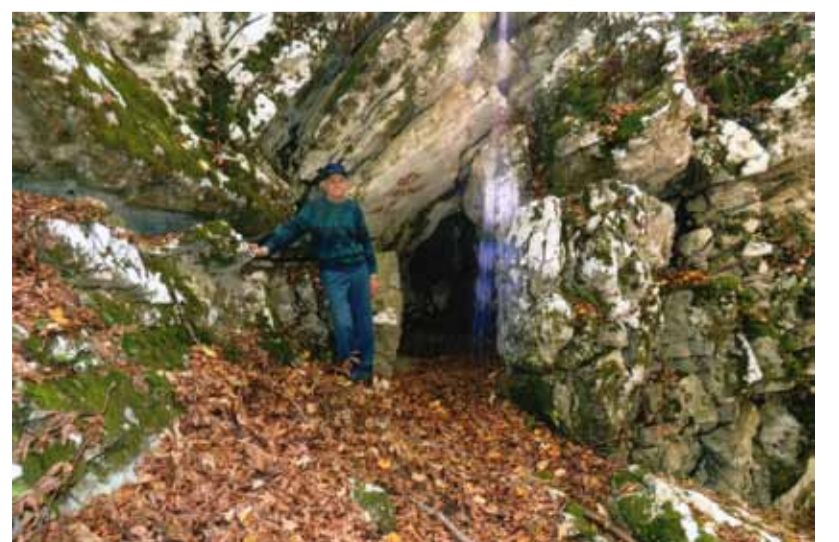
Tone Zaletel pred vhodom v špiljo.

Do 20 cm velike fosilne triasne školjke megaldontide (velikozobke) v bližnji okolici.