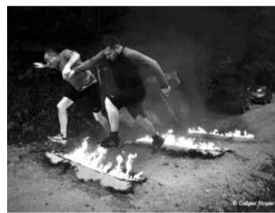
Z roko v roki čez vse ovire