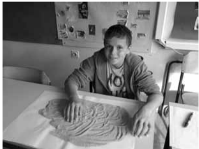
Med likovnim ustvarjanjem

Tako so naši mladi gostje v ponedeljek, 28. oktobra, začeli teden jezenskih počitnic ustvarjalno in polni pričakovanj v čisto pravi jezikovni učilnici: Nazca lines, čudo sveta v Peruju.