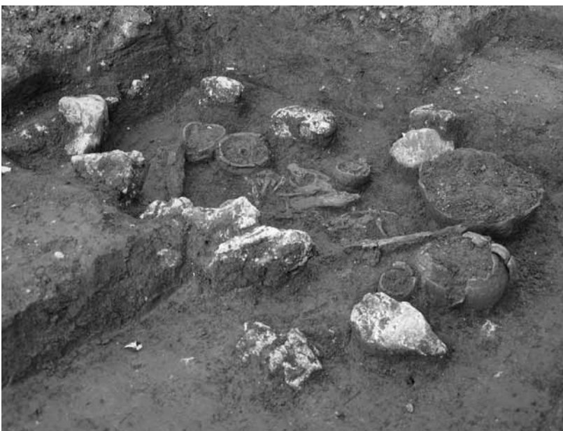
Gradnja kanalizacije na Viru razkrila grob keltskega bojvnika