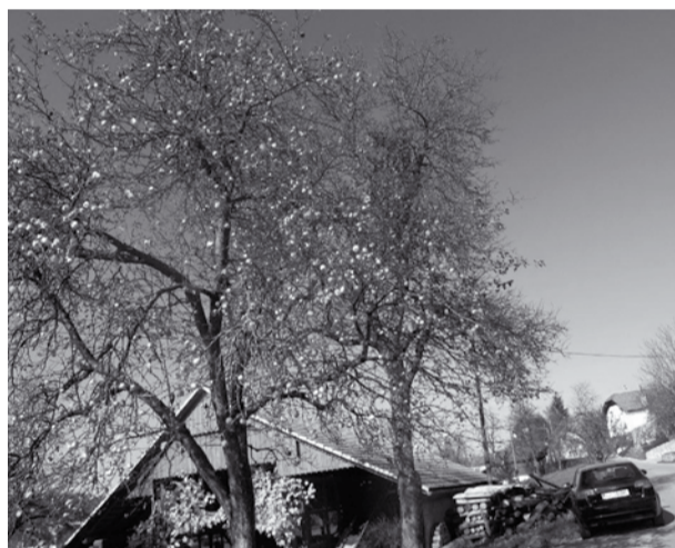
Bogata jesen v Gorenji vasi