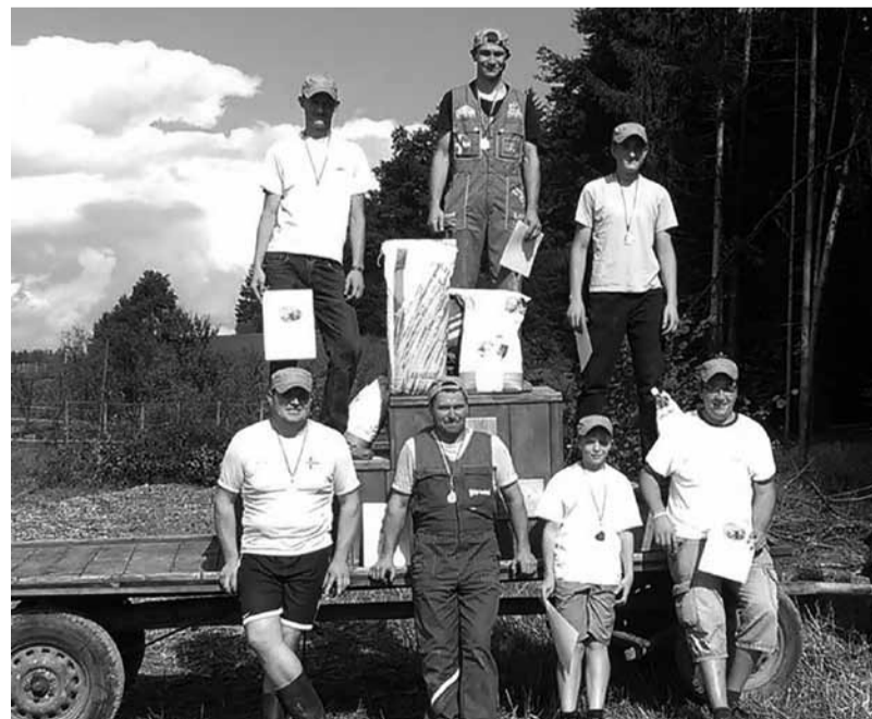
Zmagovalci: spodaj v obračalni tehniki, zgoraj v krajni tehniki