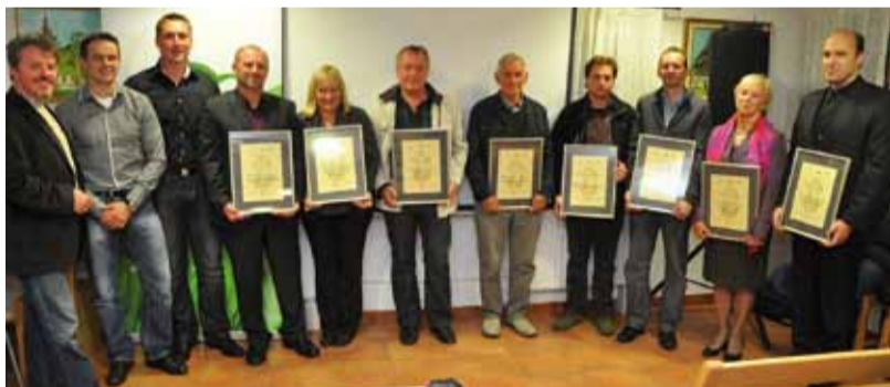
TD Muljava je ob jubileju podelilo spominska priznanja obema nekdanjima predsednikoma in organizacijam s katerimi največ sodeluje

V petek, 18. oktobra, je na Jurčičevi domačiji na Muljavi potekala slovesnost ob nedavnem Svetovnem dnevu turizma in 30-letnici Turističnega društva Muljava. Ob tej priložnosti so bili razglašeni tudi rezultati letošnjega ocenjevanja urejenosti turistično-informacijskih točk na Krožni poti Prijetno domače.