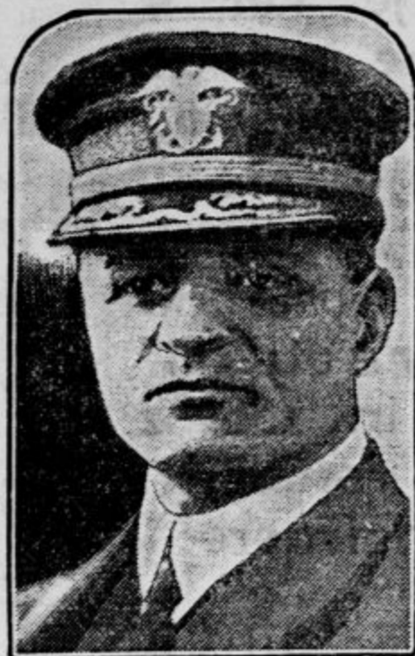
Ameriški admiral Mark Bristol je bil poslan v Tokio, da bi od tam poročal v Washington o motvah, ki so privedli do japonske intervencije na Kitajskem.