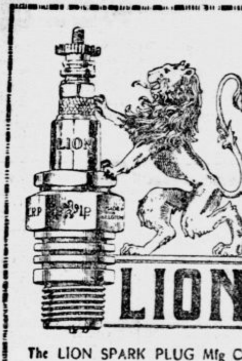
The LION SPARK PLUG Mfg Co