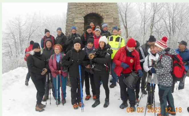
Planinci na Donački gori