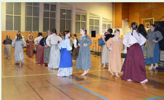
Plesni utrinek s praznovanja ob dnevu šole