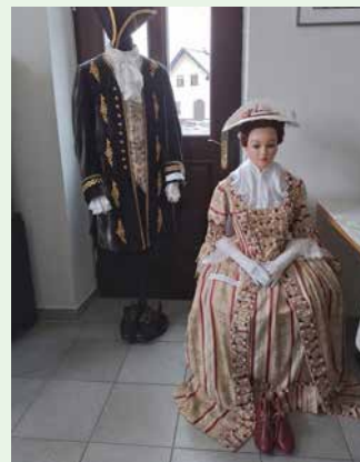
Čudoviti kostumi na Ptujski Gori