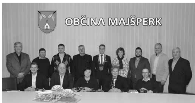
Novoizvoljeni člani OS Občine Majšperk

Občinski svet se je na tretji seji sestal v sredo, 15. februarja 2023, ter obravnaval šestnajst točk dnevnega reda.