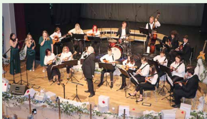
Božično-novoletni koncert tamburaškega orkestra

Majšperčan je glasilo Občine Majšperk, ki je tudi izdajatelj glasila. Vpisan v razvid medijev pod zaporedno št. 94. Naslov: Občina Majšperk, Majšperk 39, 2323 Majšperk, tel.: 02 795 08 30, e-naslov: obcina.majšperk@majšperk.si .