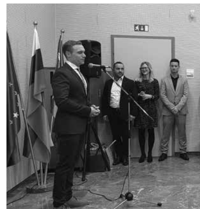
Župan Sašo Kodrič je nagovoril zbrane na sprejemu.