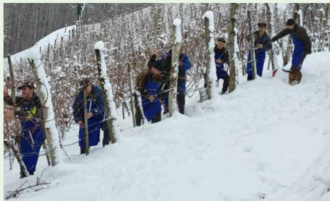
Možje so opravili Vinčekovo rez.