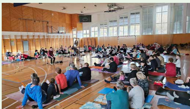
Druženje starih staršev in vnukov