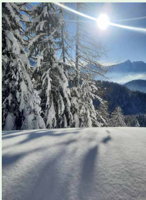
Zimska idila na koči na Grohatu