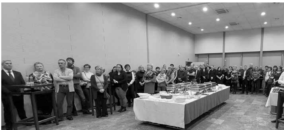
Srečanje z društvi, organizacijami in sodelavci občine