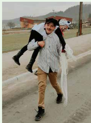
Ujeli so malega dalmatinca.