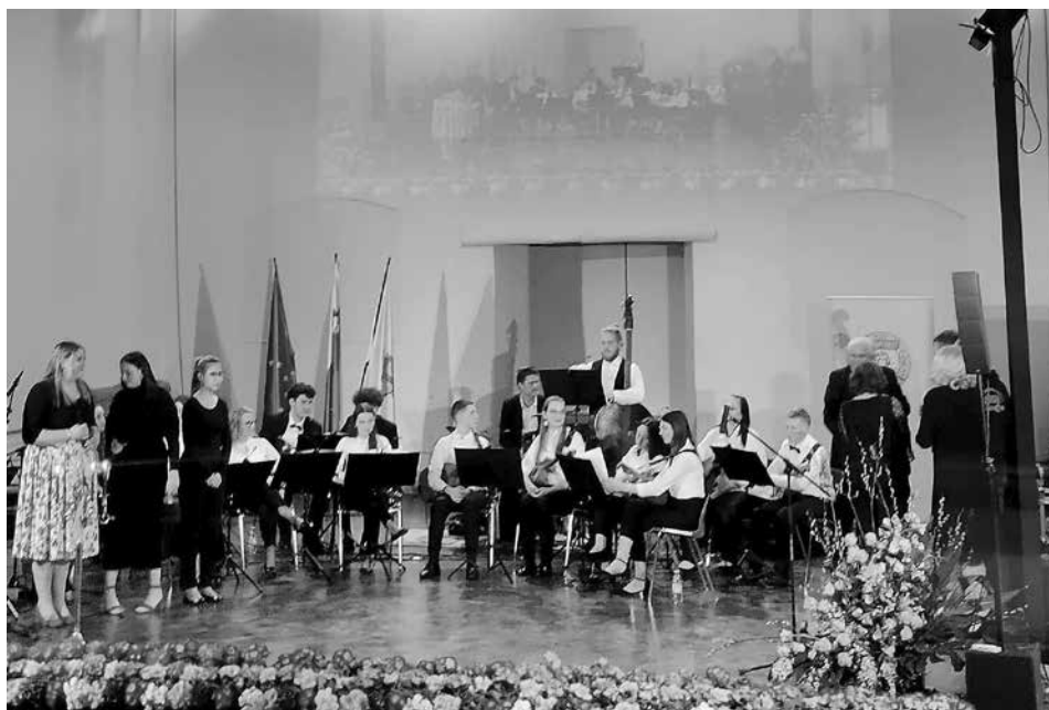
Na koncertu društva Soroptimist

Tudi v novem letu smo že imeli nekaj pomembnih glasbenih nastopov. Ob kulturnem prazniku smo nastopili na občinski prireditvi, najpomembnejši nastop pa nas je čakal 4. 3. 2023, ko smo zaigrali na Regijskem tematskem koncertu tamburašev in mandolinistov. Srečanje je bilo tekmovalne narave. Prejeli smo zlato priznanje s pohvalo (doseženih 92,5 točke) in se