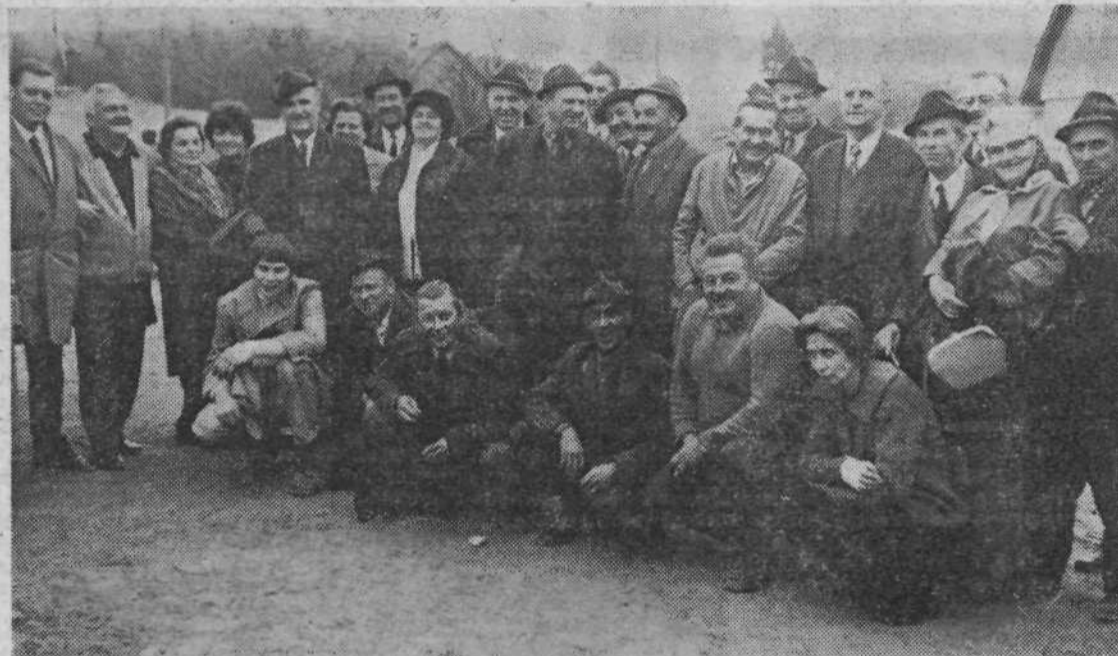
Izlet borcev NOV iz Starega Vodmata v Jelenov žleb in Grčarice