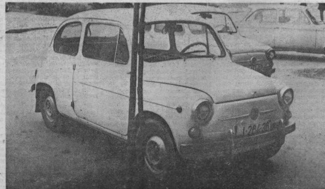
Tako parkirajo nedisciplinirani vozniki na zelenici Potrčeve ulice 2-46 v Starem Vodmatu