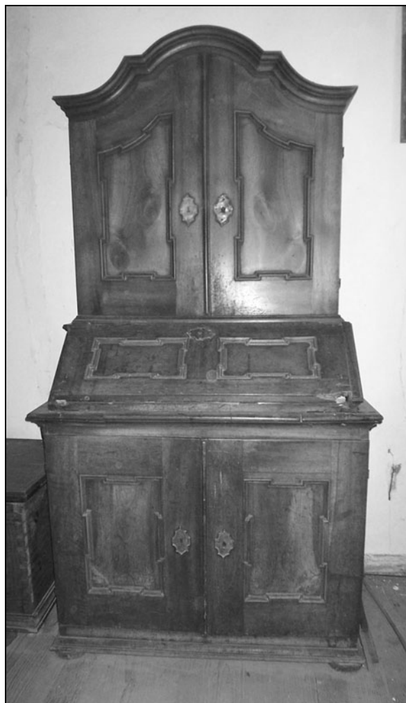
Tabernakeljska omara iz prve polovice 18. stoletja. 3

Tla imajo večinoma kvadrast vzorec iz smrekovih in hrastovih desk, ohranilo se je še precej starih oken s krili z neravnimi šipami in okovjem. Gotovo je pod sedanjim beležem tudi bidermajerska poslikava (pod njo pa morda še kaj baročnega). Tej pri nas edinstveni opremi seveda čas ni prizanašal. Predvsem tekstilije kličejo po skrbnem in potrpežljivem restavriranju. Rahločutno čiščenje lesenih predmetov in osvežitev s šelakovo polituro, pri čemer bo treba paziti, da se ne uniči patina, napanjanje in utrjevanje platen oljnih slik, osvežitev lesenih tlakov, odkritje starih opleskov, morda celo poslikav, bo temu, na Slovenskem enkratnemu ambientu vrnilo nekdanjo avtentično svežino. Pogledi na prostore z različnih perspektiv razkrivajo običajno zbirko predmetov, ki so jih, nekaj sistematično, precej več pa naključno, pridobivale in uporabljale zaporedne generacije lastnikov. Pričakovalo se je, da bo vsak novi rod dodal nekaj modernega, staro pa so uporabljali, dokler se je le dalo. Nič ni šlo v nič.