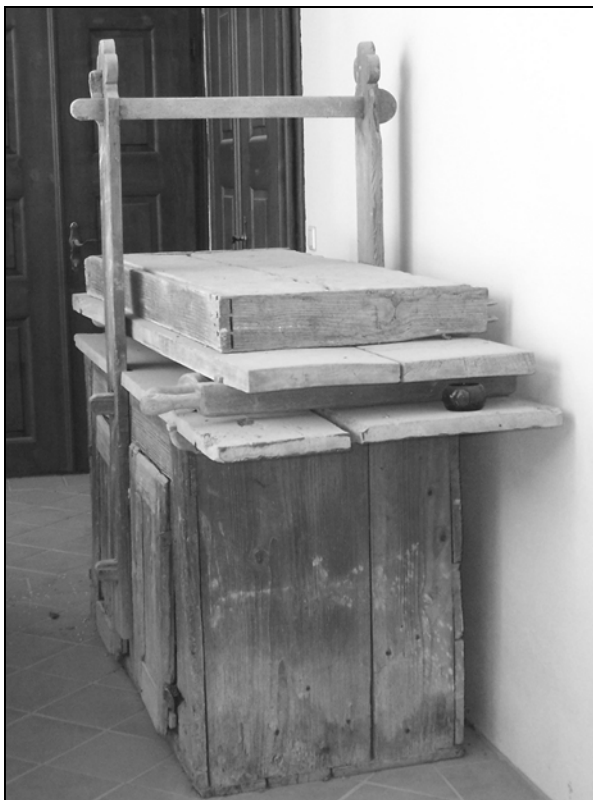
Omarica za perilo z mongo.

V starejšem inventarju so omenjene naslednje postelje, iz trdega lesa z grobimi zavesami iz dvo-nitnika, rdeče prepleskana iz mehkega lesa, dve iz trdega lesa v vogalni sobi, dve iz trdega lesa in posteljica iz orehovine v grofovi sobi, iz trdega lesa v stolpni sobi, v Kacijanarjevi sobi postelja s štirimi stebri ali nebom in delno pozlačena iz mehkega lesa z rumenimi zavesami iz tafete (svile) ter črno lužena postelja iz trdega lesa tudi s štirimi stebri z rdečimi zavesami iz tafete. V mlajšem inventarju najdemo naslednje postelje, v grofovi sobi iz mehkega lesa, v srednji sobi tri zelo izrabljene postelje, v duhovnikovi sobi tri postelje, med njimi ena rdeče po-barvana (morda ista kot v starejšem inventarju), v jedilnici stara črno lužena postelja, v Kacijanarjevi sobi stara postelja z baldahinom in zavesami iz potiskanega platna (morda ista kot v starejšem in-ventarju), v drugi sobi dve iz mehkega lesa in v vogalni sobi postelja iz trdega lesa. Posebej so na-štete žimnice, pernice in različna posteljnina. Leta 1712 so omenjene kar tri monge – likalniki (s stis-kalnico), za obleko in perilo. Podrobna študija monge, ki danes stoji na arkadnem hodniku bo pokazala, ali bi bila lahko ta katera izmed njih.