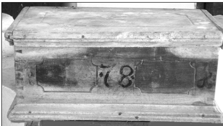
Manjša skrinja z letnico 1781.