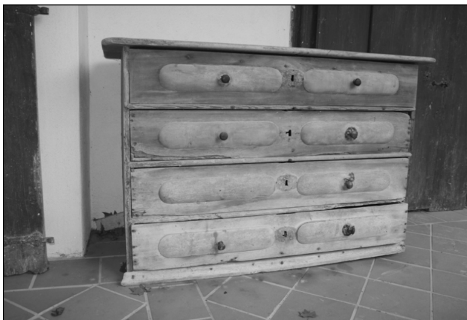
Baročni predalnik iz prve polovice 18. stoletja.

Omar (če ne štejemo pisalnih) je malo v obeh inventarjih, v starejšem sta navedeni ena iz trdega lesa in ena iz smrekovine na podstrehi, v mlajšem stara omara za perilo iz trdega lesa v srednji sobi, steklena in umivalna omara v jedilnici. V stolpni sobi je stal leta 1712 tudi predalnik za obleke iz rjave orehovine in s črno luženimi blazinicami ter z "belim" medeninastim okovjem . Morda je to ravno ta, ki še danes stoji na arkadnem hodniku. V zadnji tretjini 17. in na začetku 18. stoletja so bili predalniki tako rekoč nov tip shrambnega pohištva. V njih so bili perilo in manjši kosi obleke, pa seveda tudi drugi vsakdanji predmeti dosti pregledneje spravljene kot v skrinjah. Tudi na Tuštanju torej niso bili izjema in