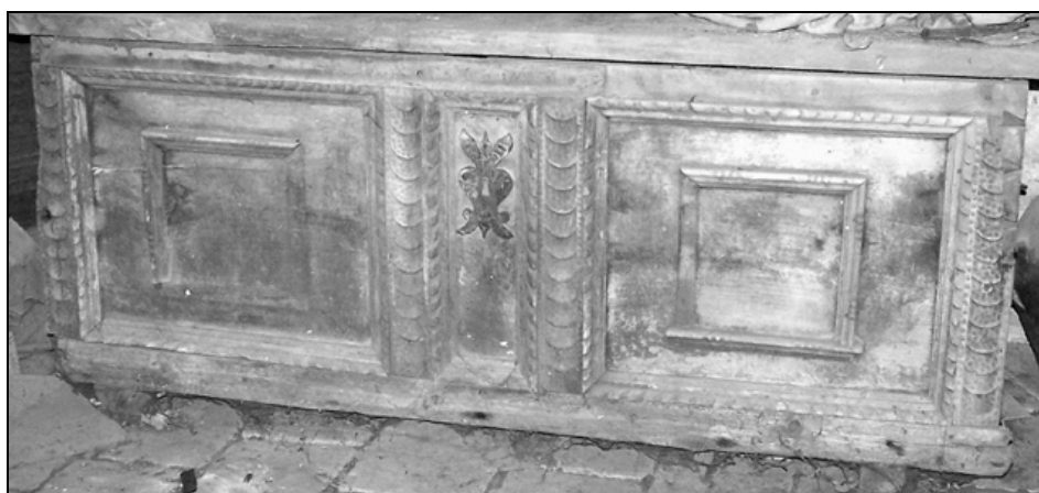
Baročna skrinja na podstrešju, 17./18. stoletje.

okovjem ob novejši pisalni omari s pokositrenim okovjem in nastavkom. Zelo verjetno že gre pri tej za tridelno kombinirano omaro, kakršnim danes rečemo tabernakeljske omare. 13 Dodatni okrasni moment na črnem pohištvu je bilo srebrnkasto pokositreno okovje, ki je v popisu posebej omenjeno. Imele so ga tudi skrinje, iz dražje orehovine ali cenejše smrekovine. V obeh inventarjih je najti po okrog deset skrinj, 14 delno črno lužene, ena majhna je bila prevlečena z usnjem (potovalna?). V mlajšem seznamu so večinoma označene kot stare.