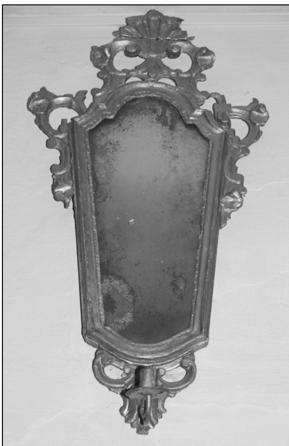
Poznobaročni stenski svečnik z ogledalom v ozadju (foto: Maja Lozar Štamcar).