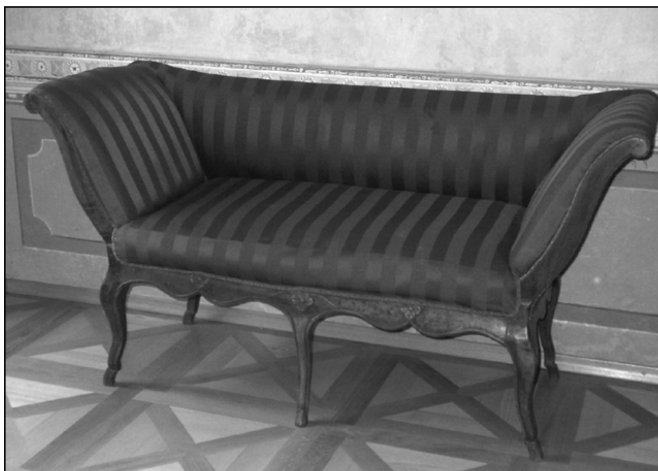
Poznobaročni kanape z novim oblazinjenjem.