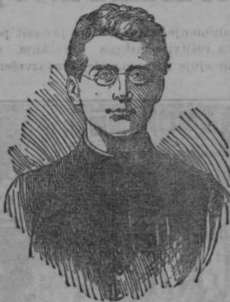
Sedajni papež Pij XI. kot mlad duhovnik.

so imele. Velike važnosti so naslednje določbe, ki se tičejo tudi usode narodnih manjšin v Italiji, torej tudi naših slovenskih bratov, in ki se glasijo: Duhovščina v Italiji, ki v duhovnih in verskih zadevah ne podleži državnim, ampak le cerkvenim postavam, mora biti dobrega italijanskega državljankega duha ter se mora ogibati vsakega pokreta proti Italiji in proti njenemu režimu. Novoimenovani škofje morajo imeti placet (pristanek) vlade. Kar se tiče duhovnikov, sporoči škof ime dotičnega, ki ga hoče imenovati na župnijo ali za kako drugo cerkveno službo, na-