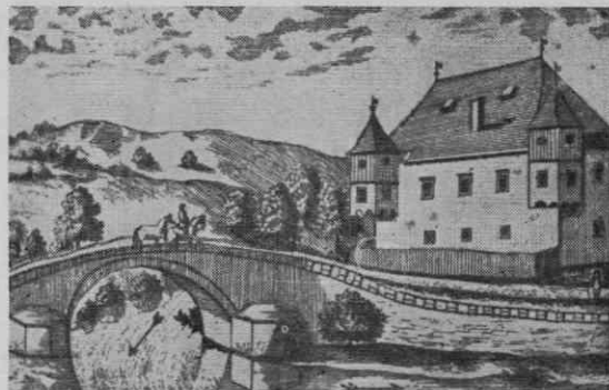
Dvor Dragomelj v drugi polovici XVII. stoletja (po Valvasorju XI, 280)