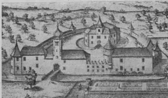
Grad Dragomelj v drugi polovici XVII. stoletja (po Valvasorju XI, 121)