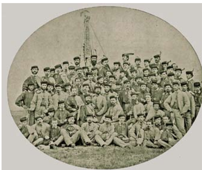
Južni Sokol, 1863.

Ključne besede: Južni Sokol, sokolstvo, telovadba, telesne vaje, gimnastika, E.H. Costa.