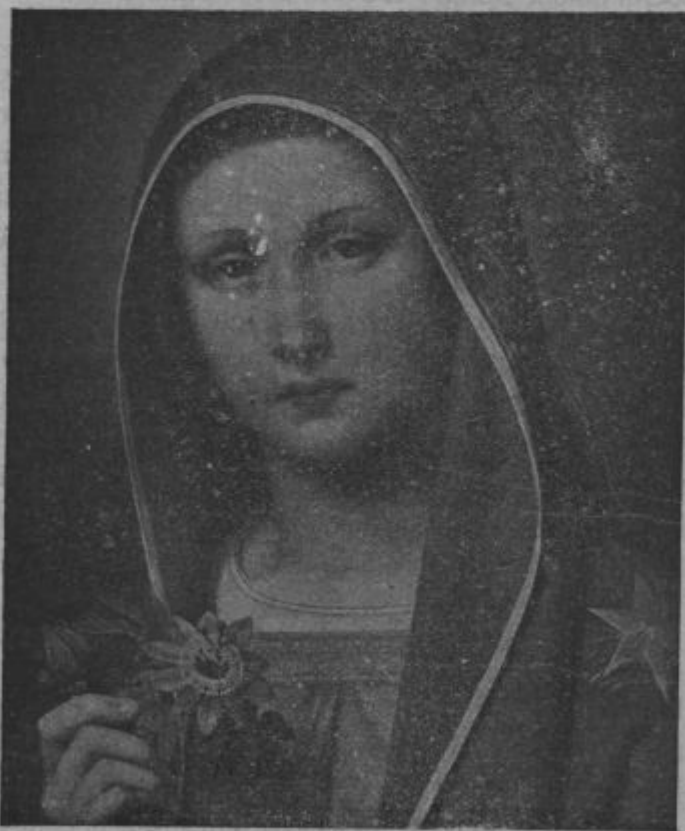
Prečista Devica Marija, mati najsvetejšega dūhovnika nove zaveze, Jezusa Kristusa. — Prosimo jo dostakrat za dobre dūhovnike!

1) Požrtvovalen je tisti človek, ki rad trpi za rešenje dūš. Požari ga ogenj ljūbézni, zato se právi požrtvoválen. 2), 3) Marija se zato právi darūvajoča dūhovnica, ka je — čeravno ne bila posvečena v dūhovnika — vendar tak darūvala kak on Jezusa Oči nebeskomi pod križom za rešenje sveta. Ona kak mati Jezusova, prvoga dūhovnika nove zaveze je bila pod križom kak oltar i kak dūhovnik pri prvoj svetoj krvávoj mešnoj daritvi. Ali njeno darūvanje je bilo popolnoma z Jezusovim vjedinjeno. 4), 5) Velika soba, hiša se dvorána zove. Takša je bila tista, kje se je zadnja večerja potrošila. Po Jezusovom v neboidenji so z Marijov sem prihajali apoštolje i prvi krščeniki ponavljat križno daritev, to je mešo slūžit i poslūšat. Tū so bili tūdi zbrani apoštołi na risale, kda jih je po prošnji Dev. Marije Dūh sveti potrdó v svete dūhovnike.