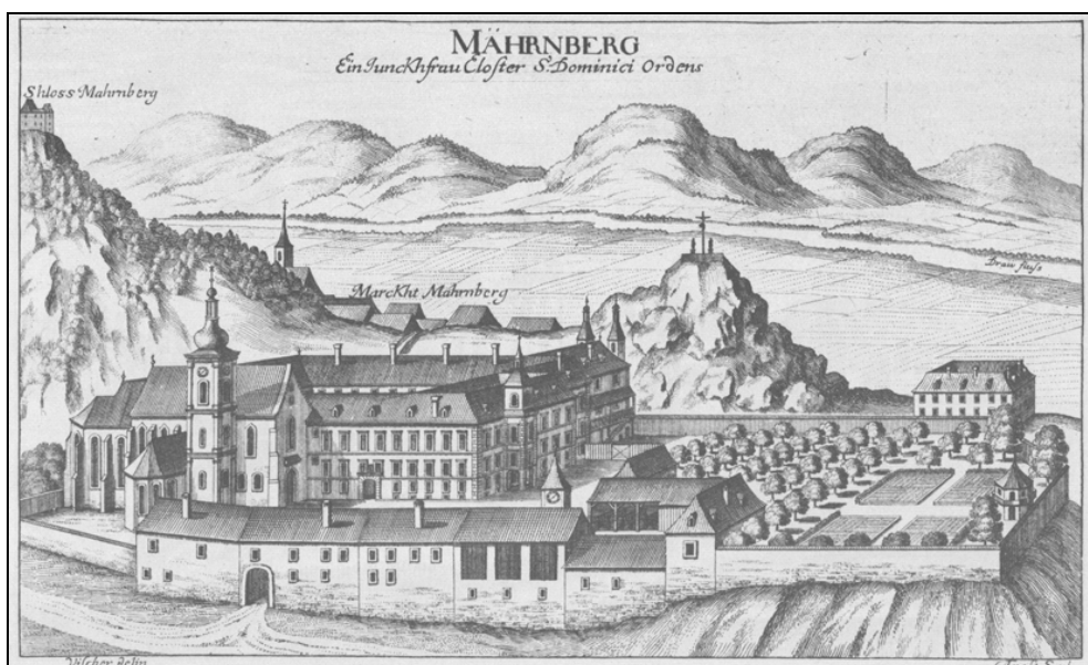
Marenberg (Radlje) v 17. stoletju (Vischer, Topographia ducatus Stiriae , 1. Band, str. 245).