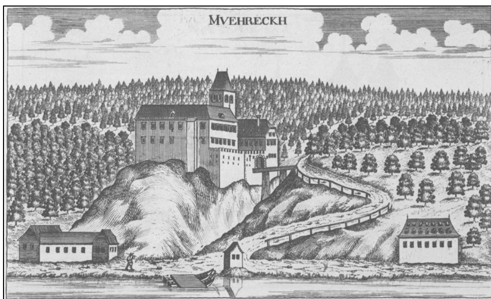
Cmurek v 17. stoletju (Vischer, Topographia ducatus Stiriae, 1. Band, str. 268).