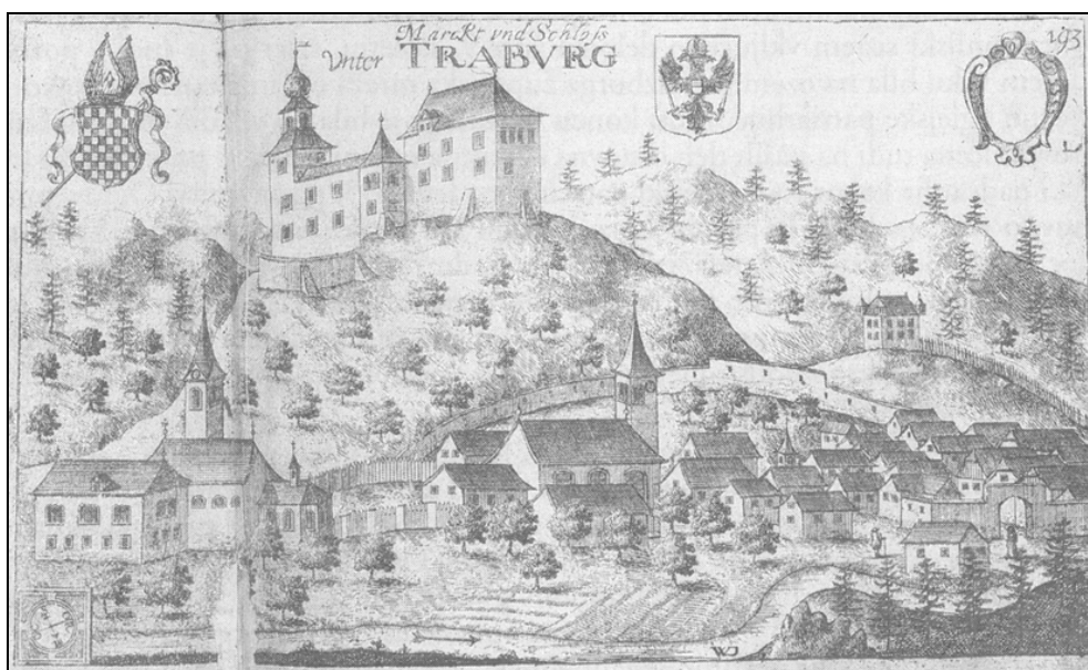
Dravograd v 17. stoletju (Valvasor, Topographia archiducatus Carinthiae , str. 193).