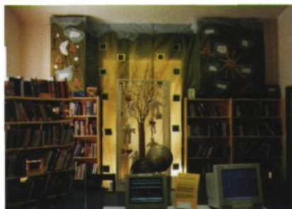
Razstava Ta svet je nekaj običajnega v Pionirski knjižnici Rotovž (foto Robert Kereži, 1999).

Veliko kompleksnejše so tematske razstave , saj so plod študijskega dela, ki uporabnikom omogoča pregleden vstop v določeno področje na eni strani, na drugi strani pa knjižničarji z njim pridobivajo dodatno podlago za informacijsko delo. V pionirskih knjižnicah je taka dejavnost še posebej pomembna, saj nemalokrat otrokom nadgradi njihovo šolsko znanje, razširja zanimanje za nova področja in jih seznanja z informacijami, dosegljivimi v knjižnici. Tematska razstava namreč predstavi gradivo po določenem vidiku, bodisi knjige s podobno tematiko, z različnih strokovnih področij, bodisi ustvarjalnost enega samega avtorja ali njegovega določenega segmenta. Razstavljeno