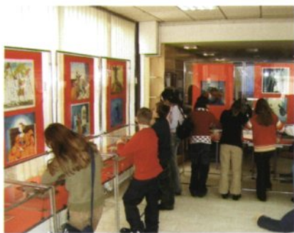
Razstave vabijo k ogledu.

pisatelji in njihova dela ( Beatrix Potter, Vitan Mal, Pika Nogavička ), kasneje so jo zanimala teme, povezane s hrepenenjem ( Kraljmatjaževo hrepenenje, Zlatorog, Ko zaspijo drevesa, Krištof Lambergar ), v zadnjem času jo odlikuje predvsem hudomušnost ( Enci benci, Njegovo veličanstvo ptičje strašilo. )