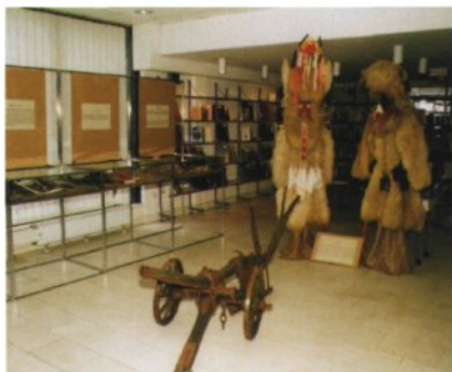
Vsebinska pestrost in zanimiva postavitve razstave Odkrivanje šemskega izročila (foto Bogo Čerin, Pionirska knjižnica Nova vas, 1996).

Že na samem začetku je bilo zamišljeno, »da pionirska knjižnica vsako leto pripravi veliko tematsko razstavo z vodstvom.« 3 Tako je ostalo vse do danes, le da se takšne velike razstave včasih zgodijo tudi do dvakrat ali trikrat na leto. Stalnica, na katero smo v Mariborski