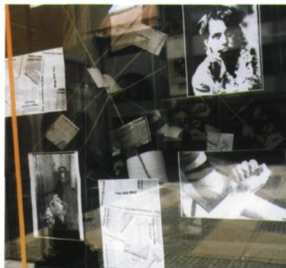
Priložnostna razstava Droga med mladimi (foto Robert Kereži, Pionirska knjižnica Rotovž, 1998).