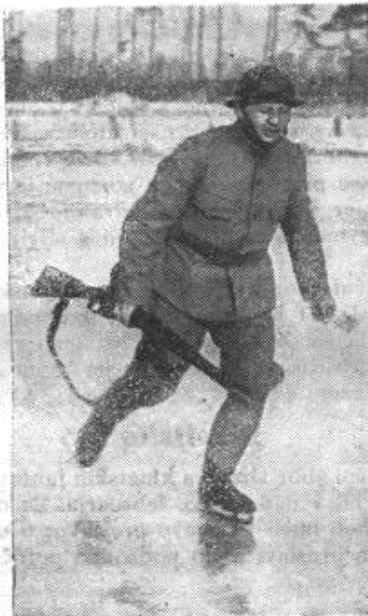
Na Holandskem so vojaki v hudem mrazu na zamrzlem terenu uporabljali drsalke

Razen tega poročila z občudovanjem naglašajo, da odpor Fincev še ni zlomljen, druga pa, da je sploh nezlomljiv.