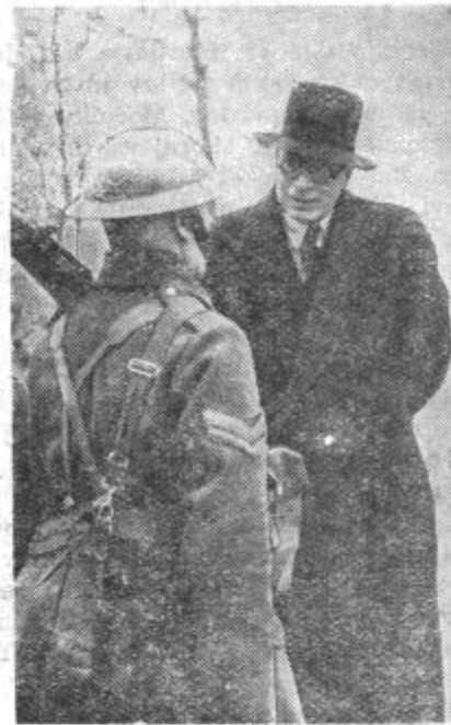
Na francoskem bojišču se angleški vojni ministar Oliver Stanley razgovarja z britskim vojakom

klic po tramvajih, avtobusih itd., skoro izključno ženske. Ženske se nahajajo po stavbiščih kot nosilke malte. Zelo razširjena je ženska organizacija Lotte Svaerdove. V mirnem času se organizacija udeležuje s telesno in državljansko vzgojo finskih deklet, v vojni pa se nahajajo ženske čete tik za fronto, kjer opravljajo sanitetno službo in vsa vojaška pomožna dela.