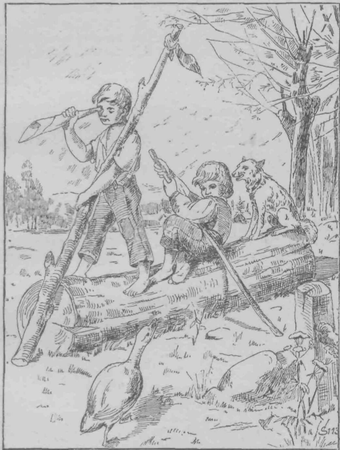
Na bojni ladji.