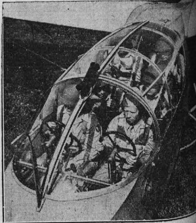
Na sliki vidimo oddelke ameriških letalcev, ki delujejo v letanju z jadralnim letalom. To letalo lahko brez motorja. Te vrste letal imajo velikega pomena ob priliki invazije.

dolžnosti napram Rusiji, ključek vsega razvoja je bil ta, da mora tajno. (Dalje prihajajo)