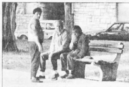
V pričakovanju razpleta vladne krize