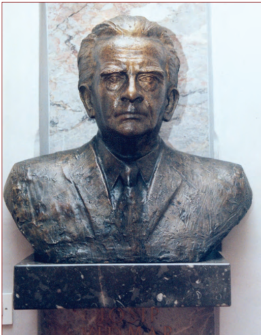
Slika 7: Doprnski kip Josipa Vidmarja na sedežu SAZU.

1989. 141 Skupaj z velikanoma slovenske kulture pa je bil na plošči ovekovečen tudi pobudnik obeležja: »Na spodnjem robu je tudi dobro prepoznaven majhen portret župnika Pogačnika.« 142