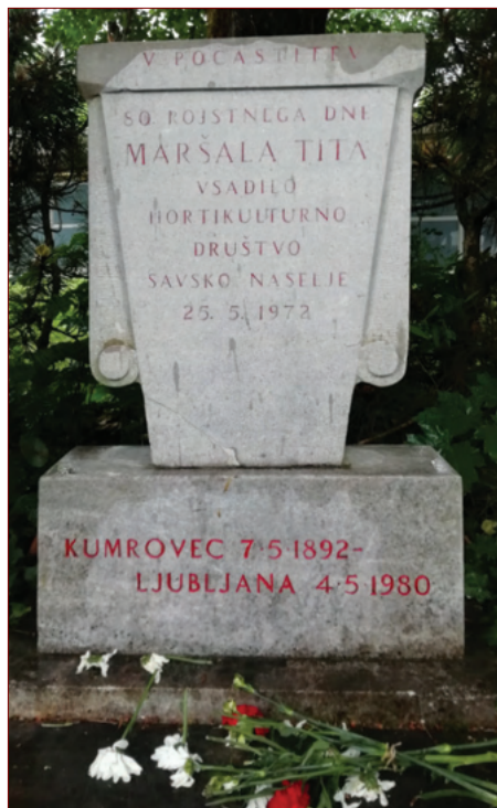
Slika 6. Spominsko znamenje, postavljeno ob 80. rojstnem dnevu Josipa Broza – Tita leta 1972 v Savskem naselju v Ljubljani.

kamnito obeležje. 115 Nadalje je bila leta 1977, ob maršalovem 85. rojstnem dnevu, obeležena še tretja lokacija, povezana s Titom v Kamniku, namreč stavba na Kovinarski cesti 20, v kateri je stanoval za časa svojega službovanja v Titanu. 116 Istega leta sta bili postavljeni plošči na lokaciji partizanskega taborišča Titova vas ter pri t. i. Mahavovem griču pri Sebenjah, od koder je Tito leta 1934 po ilegalni poti krenil preko Karavank. 117