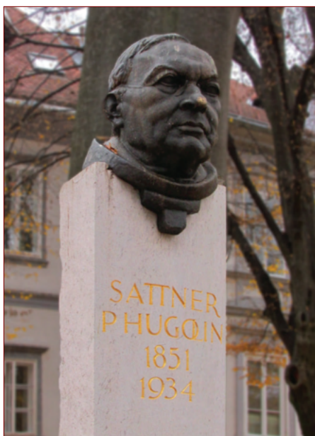
Slika 5: Doprnsni kip Hugolina Sattnerja.