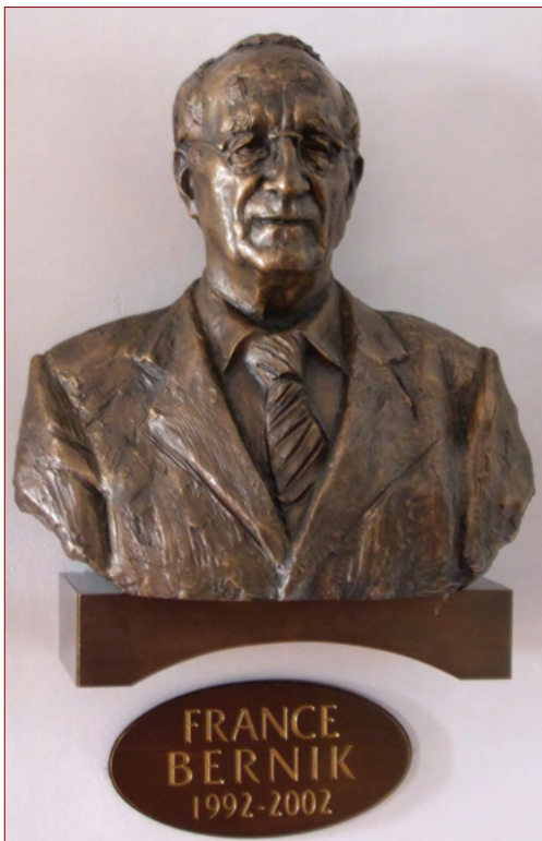
Slika 8: Doprsni kip Franceta Bernika na sedežu SAZU.

lal že leta 1992 in kasneje je bilo postavljeno v že omenjeni galeriji doprskih kipov predsednikov SAZU. 156