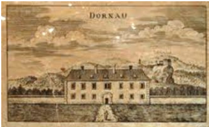
Slika 1: Georg Matthäus Vischer, Topographia ducatus Stiriae , Gradec 1681, Ljubljana 1971 (ponatis), sl. 10: Dornau

Od leta 1597 so bili lastniki dvorca grofje Herbersteini 13 . V ta čas, ko je bilo lastništvo dvorca v njihovih rokah, bi lahko postavili gradnjo dvorca, preproste stavbe, ki jo vidimo na upodobitvi v Vischerjevi Topografiji Štajerske. Prvotno naj bi dvorec imel videz lovske hiše in je ostal najbrž nespremenjen vse do leta 1666. 14