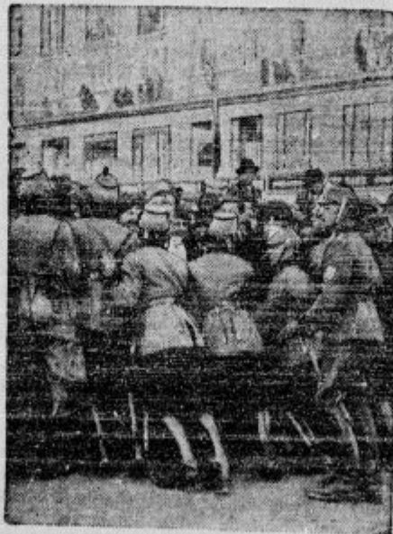
Nemška policija vzdržuje na Dunaju red

s Med Poljsko in Litvo za enkrat ne bo vojae. Med Poljsko in Litvo je bila meja 17 let tako zaprta, da niti pismo ni moglo čez mejo. Vsak promet je bil izključen. Če bi se bil kdo drznil približati se litovski meji, so začeli vojniki streljati. Obe državi druga dru-