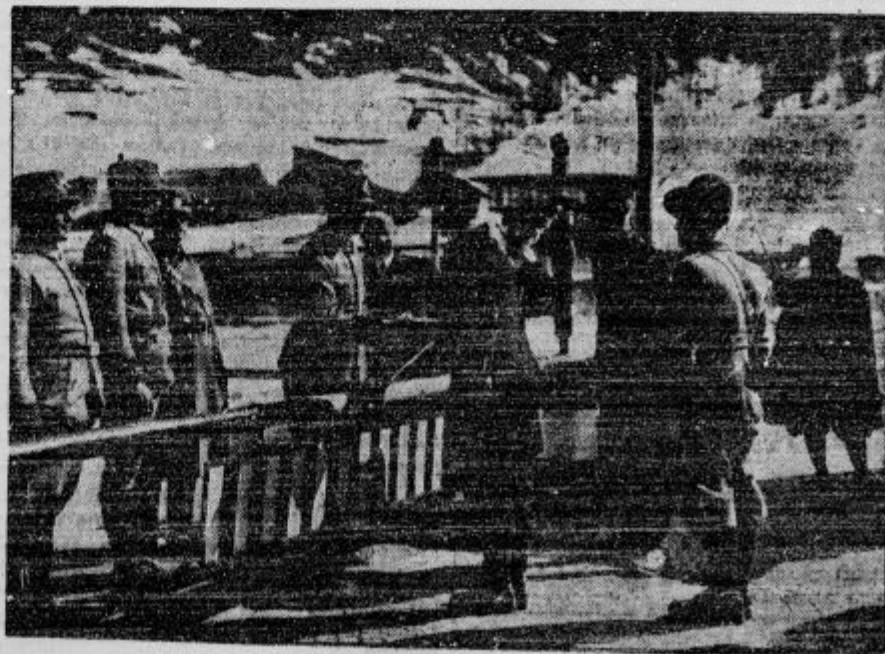
Nemci si na meji vrhu Brennerja z Italijani prijateljko segajo v roke