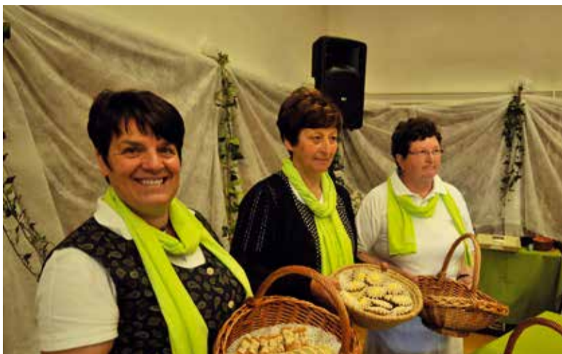
Ivanjščice, ki so bile na svoji prireditvi izkazale kot izvrstne gostiteljice, so napekle in postregle 450 porcij ivanškega šmorna s skrivnostno začimbo.