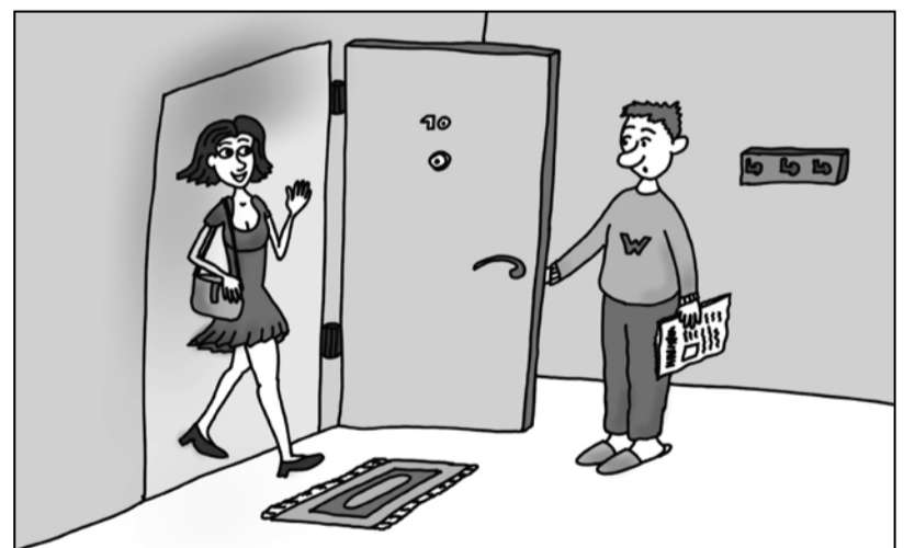
- Živjo, prihajam na ženitni oglas. Najprej bi si ogledala stanovanje.