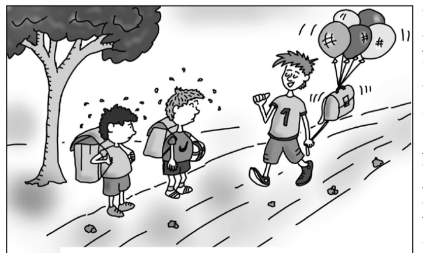
- Odkar smo se v šoli učili o vodiku in heliju, nimam več težav s prenašanjem torbe.