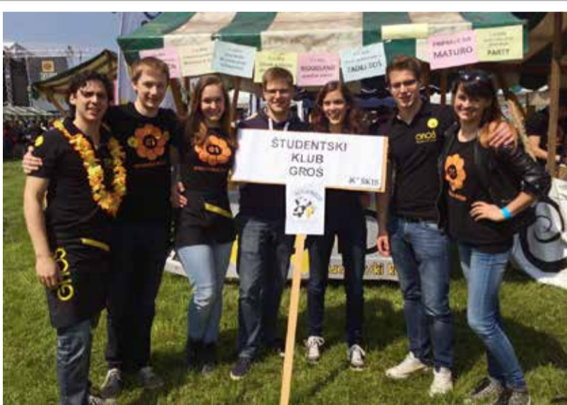
GROŠ-evci na Škisovi tržnici 2016.

Člani ŠK GROŠ se zavedamo, da samo odprtje lokala še ni dovolj, saj ta ne bo služil svojemu namenu, če bo ostajal prazen. Groševci računamo na vas! Pomladne aktivnosti v Študentskem klubu GROŠ Članom ŠK GROŠ smo subvencionirali udeležbo na tehnično in praktično