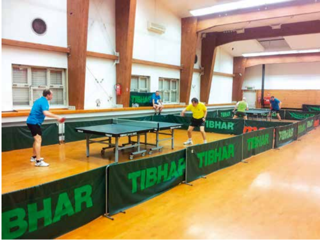
KGG Krka proti lanskoletnim prvaku Ilirija Frili v dvorani Krim