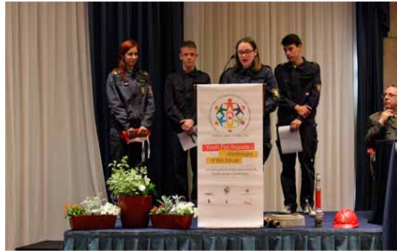
Predstavitve delovanja mladih gasilcev v Sloveniji

Ekipa mladine in mentorjev smo dobili priložnost zastopati Gasilsko zvezo Slovenije na letošnjem 13. simpoziju CTIF, ki je potekal 5. – 8. maj v kraju Trento, Italija.