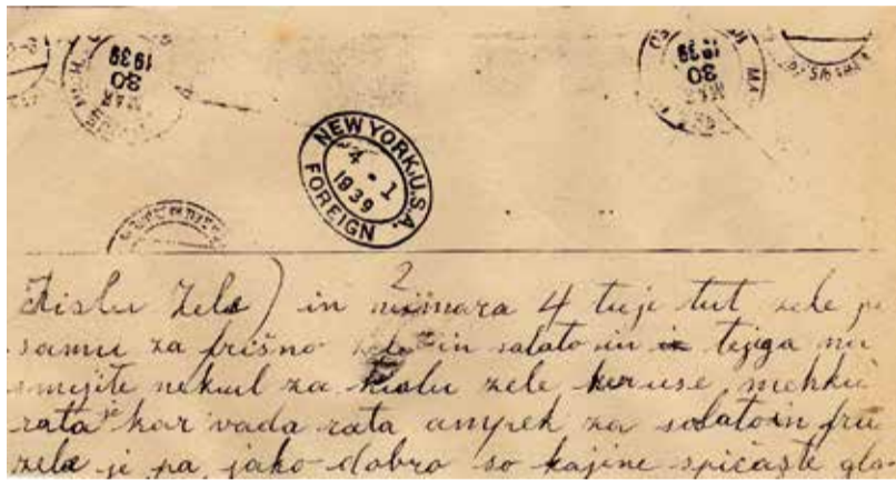
Faksimile začetka druge strani pisma z dodani žigi s pisemske ovojnice.

Zeles numara 2 je Zelo Kislu zeles) in numara 4 je tut zeles pa samu za frišno zeles in salato tejga na smejte nekul za kislu zeles ker use mehku rata je kar voda rata ampek za salata in za frišno je pa jaku dobro so kajne špičaste glave in malo bel majhne, zatu ga žiher malo bel gastu sadite in ga nejkej pasadite ker je jaku Percajtnu od 60 do 70 dni naraste de je zajist zato žiher nejkej pasadite de boste vejdel in vse tu kar vam pošlem lahku po vrsteh pasadite de boste vejdel, kaj je keru dergač vam se bo vse zmejšalo. Tukej sadima šele ad 15 maja včas šele 1 Junija zakaj tukej nej prejit za sadit imama še dost snega vam pošlem 2 karte ad lanske zime boste videl kulku jimama snega in ena je pa ledu naneslu na velike kapice jim je nejkej krovu palamilu hišo v keru so imeli Čoune noter pa je ledu gor naneslu pa je use Čoune razlamilo tu je pri vodi se pravi (Endjen lej)