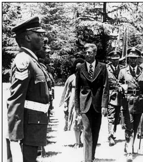
Obhod častne čete ob predaji akreditivov kraljici Kraljevine Lesoto v Afriki, 1979.

Tako se je npr. meni zgodilo, da sem prišel iz Mozambika v Kraljevino Lesoto, ki je majhna država, enklava v gorah Južne Afrike. Lastnik države je kraljica, izredno bogata gospa z britansko vzgojo, ki ima v lasti vse diamantne rudnike. Z njo sem igral tenis in dobro sva se razumela. Diamanta mi sicer ni dala nobenega, se je pa zelo potrudila, da sprejme novega veleposlanika, kot se spodobi – vsa njihova armada je nastopila v častni četi. Tamkajšnji rezidenčni veleposlaniki pa so mi rekli: "No, hvala bogu, da si že enkrat prišel, ker že dva meseca poslušamo, kako vadijo tvojo himno in 'fušajo' dan in noč, da bi se je naučili."