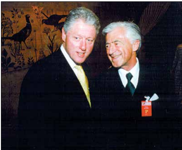
Obisk Billa Clintona v Ljubljani, 1999.

to je bilo brez dvoma zelo zanimivo obdobje, mnogo so mi pomagale prav te diplomatske izkušnje.