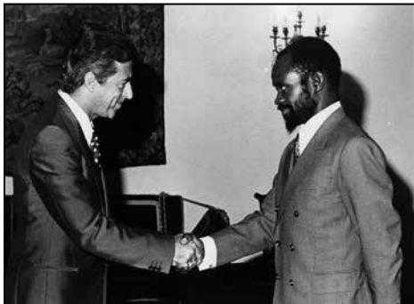
Predaja veleposlaniških akreditivov predsedniku Mozambika Samori Machelu v Maputu leta 1978.

v Bocvani. To je bilo zelo prijetno, veliko sem potoval in v Beogradu pravzaprav nikoli niso natančno vedeli, kje se nahajam, kar je omogočalo dobro delo, veliko širino stikov pa tudi lepih doživetij.