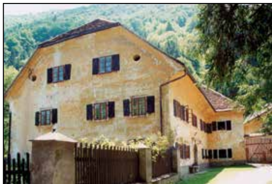
Jegličeva hiša na Racovniku v Železnikih.