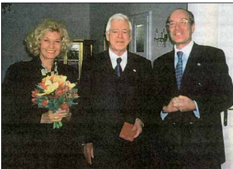
Predaja avstrijskega predsedniškega odlikovanja s strani avstrijskega veleposlanika.

vse v redu, čeprav mogoče vedno ni tako. Tega pa gost večinoma ne opazi oziroma vsaj ne sme opaziti. Stvari pa se skoraj vedno lepo uredijo in na koncu so vsi zadovoljni, kajti protokol mora funkcionirati v čast gosta, v čast gostitelja in na koncu v zadovoljstvo šefa protokola po dobro opravljeni nalogi.