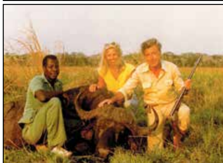
Lov v delti Zambezijskega v Mozambiku, 1980.