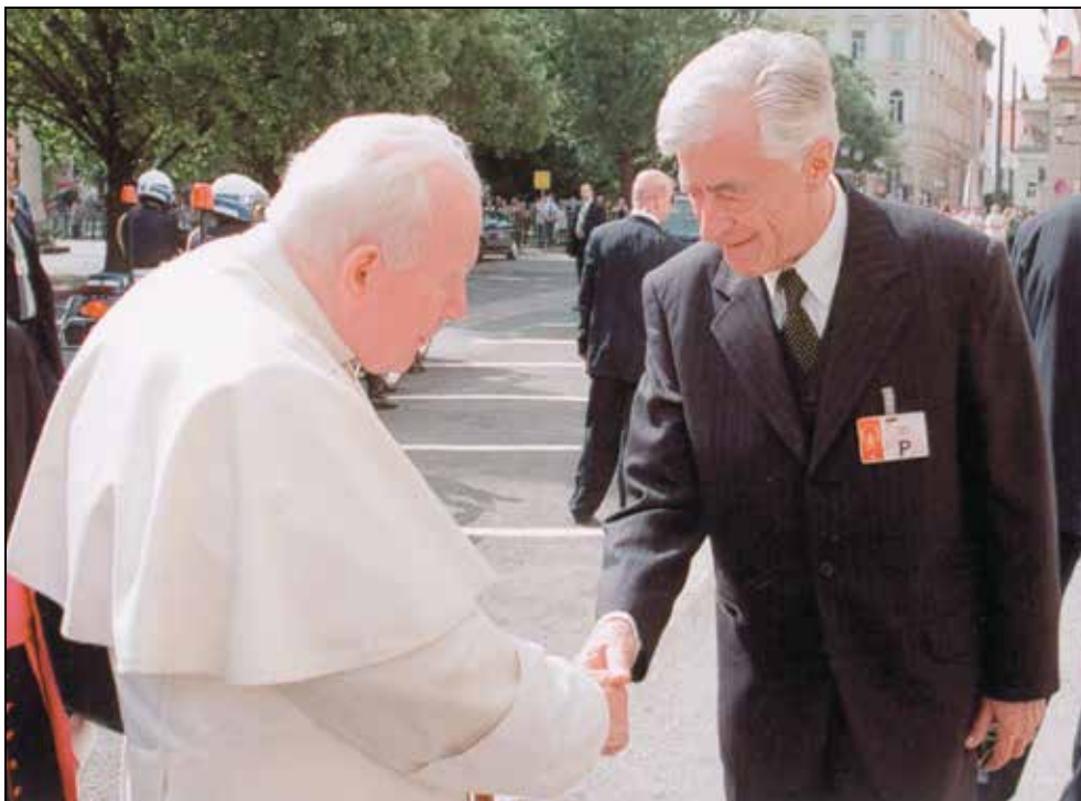
Obisk Njegove svetosti papeža Janeza Pavla II. leta 1999.