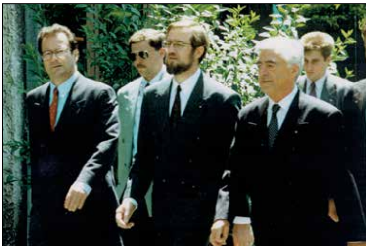
Z zunanjim ministrom Zvezne Republike Nemčije Klausom Kinkelom in zunanjim ministrom Republike Slovenije Lojzetom Peterletom, 1994.

Tako je, stvari so se izjemno zanimivo nadaljevale, saj je bilo potrebno mnogo podvigov, potovanj, idej, znanstev in zvez, da je svet priznal samostojno Slovenijo. Moram priznati, da imam na slovensko zunanje ministrstvo lepe spomine. Takrat sta bila moja šefa zunanji minister Rupel in prijazni zunanji