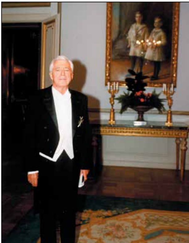
Ob podelitvi najvišjega švedskega odlikovanja polarne zvezde I. razreda v Stockholmu.