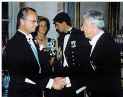
S švedskim kraljem Karlom Gustavom v Stockholmu leta 2000.

Jaz mislim, da lahko. Se pač bolj študijozno ukvarja s pisanjem analiz in podobnim, ni pa zato nič slabši.