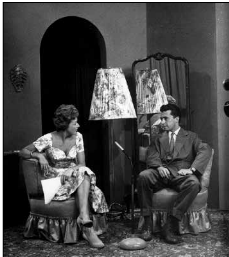
Nastop z intervjujem na TV München.

Težko je reči. Mogoče sem ravno zaradi zanimanja za diplomacijo televizijo zapustil, čeprav sem vsak četrtek na televiziji vodil oddajo o zunanji politiki. Raje sem se posvetil čisti diplomaciji ter konkuriral za mesta v tujini.