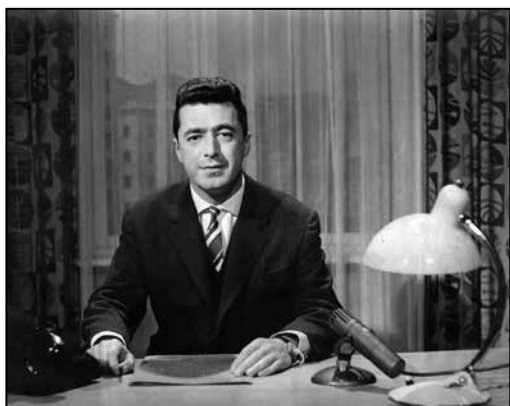
Prvi nastop na TV Ljubljana, 1958.

Kot pravnik nisem nikoli deloval, ampak sem v začetnem obdobju delal pri takrat novoustanovljeni Televiziji Ljubljana, kjer sem prevzel aktualni oddelek ter oddaji Obzornik in Dnevnik . Potem sem na povabilo ameriške vlade odšel na dodatna izobraževanja v organizaciji ameriškega zunanjega ministrstva, dodatno pa sem se izobraževal še v Nemčiji in nekaterih drugih evropskih državah.