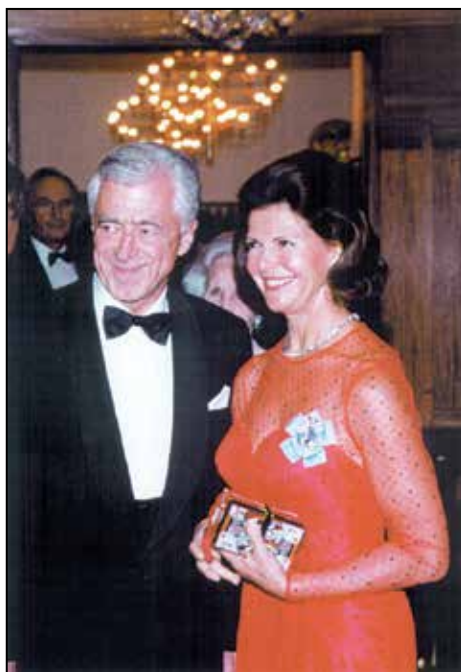
S švedsko kraljico Silivijo ob uradnem obisku predsednika Republike Slovenije v Stockholmu leta 2000.

Švedska kraljica je izredno ljubezniva in kultivirana osebnost, nikoli pa ne moreš trditi in niti ni vljudno reči, da si prijatelj suverena ali njegove soproge. Rekel pa bi, da smo dobri znanci, da jo res spoštujem in prav tako njenega soproga. Že večkrat smo se srečali, tako ob uradnem obisku predsednika Republike Slovenije v Stockholmu pred nekaj leti kot tudi ob uradnem obisku švedskega kralja Gustava in kraljice Silvije v Sloveniji leta 2004, ko smo imeli res lepo protokolarno večerjo na Brdu, kjer pa takrat nisem bil šef protokola, ampak – kar je vsekakor bolj prijetno – gost.