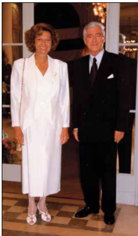
S soprogo na sprejemu ob slovenskem državnem prazniku v Bernu, 1998.

To, da danes sediva in pijeva dober Simčičev cabernet sauvignon tu v Železnikih, od koder izvira moj rod in kamor se z veseljem vračam, govori, da mi je uspelo.