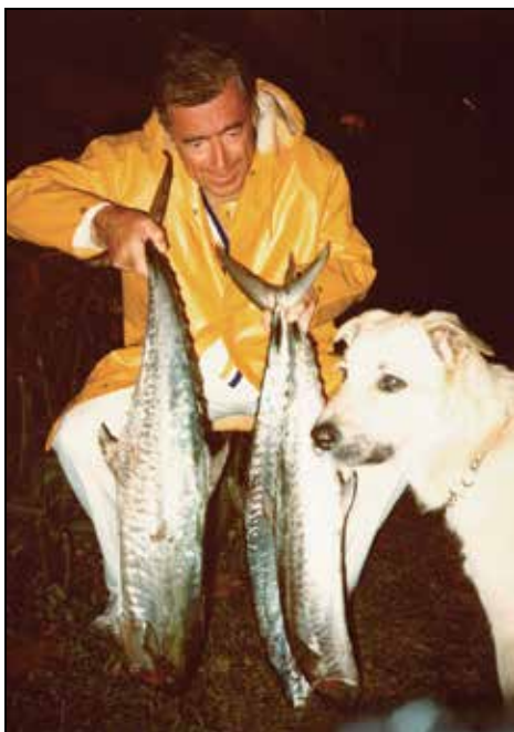
Ribolov v Afriki.

Ampak ko sem odhajal, so moji afriški prijatelji – eden je bil nočni čuvaj, drugi je bil kuhar, v hiši je eden likal, drugi je bil butler in podobno – vsi jokali in sem jim moral obljubiti, da bom še prišel nazaj. Rekli so tudi, da mi bodo prižgali velik ogenj, da bom videl, kje so in prišel nazaj, kot so rekli gospe Karen Blixen, ki je imela farmo v Keniji in je tudi odšla iz Afrike z zelo težkim srcem, potem pa na stara leta napisala lepo knjigo z naslovom Out of Africa – Slovo od Afrike.