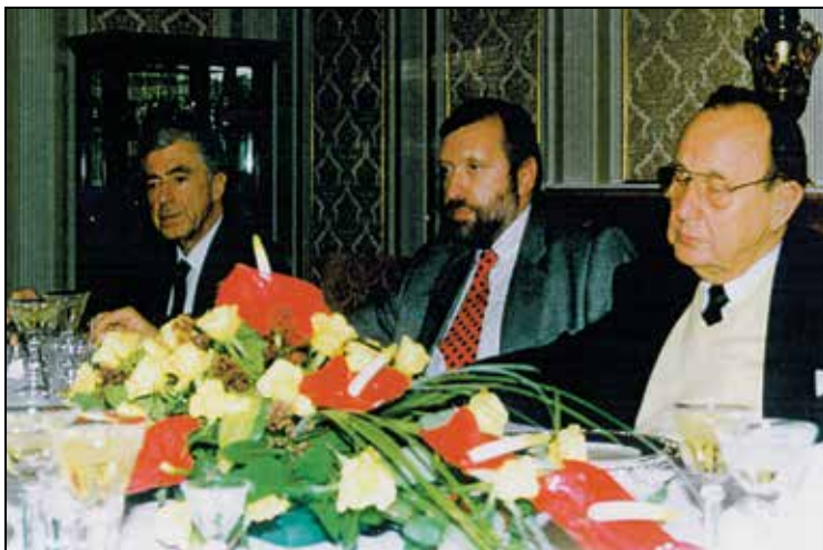
Z zunanjim ministrom Republike Slovenije Dimitrijem Ruplom in nemškim zunanjim ministrom Hansom Dietrichom Genscherjem v Ljubljani, 1992.

Po mojem povratku sem v precej nevarnih okoliščinah moral zapustiti Beograd, kjer je bil takrat vodja zveznega zunanjega ministrstva skrajnejš in izredno zagrizen stalinist, minister Raif Dizdarevič, ki je še vedno živ. Slovencev ni prenesel, smatral nas je za 'prozahodne seperatiste'. Še preden bi mi lahko resno škodil ali 'stregel po svobodi', sem zapustil Beograd in odšel v Slovenijo, kjer me je mati domovina prijazno sprejela.