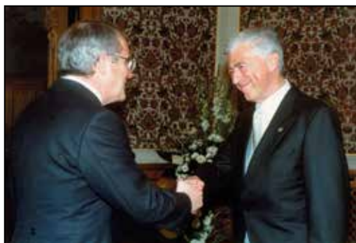
Obisk pri predsedniku Švice.

Seveda, nekatere finančne in druge kroge zanima, kaj imam povedati o novi uspešni članici Evropske unije, in dokler jih bo zanimalo, jih bom z veseljem obiskoval.