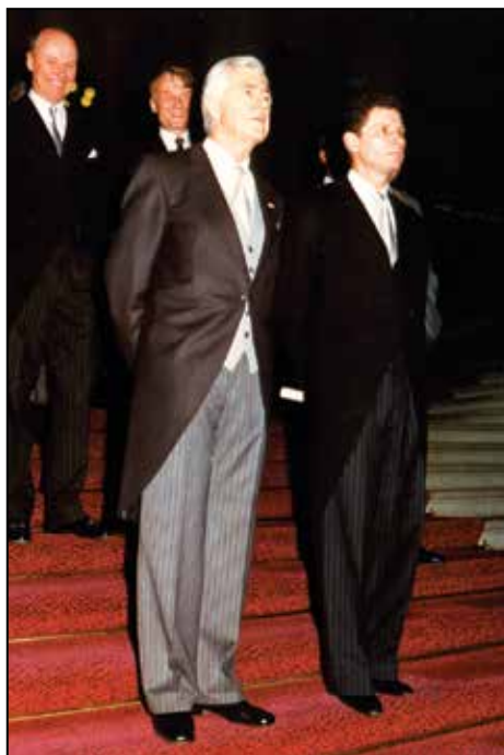
Med kolegi na obisku pri predsedniku Švice, 1998.

"Stalno sem poudarjal, da je pri diplomaciji poleg velikega znanja in mirnih živcev zelo pomembno tudi znanje jezikov (poleg nemščine, angleščine, italijanščine in portugalsščine, ki jih govorim tako dobro kot rojstni jezik, govorim še nekatere druge) ter nekaj, kar je človeku dano ali pa tudi ne – toplina osebnosti. Pravim, da se v življenju dobro počutiš, če preobilje veselja in toplino želiš deliti tudi z drugimi."