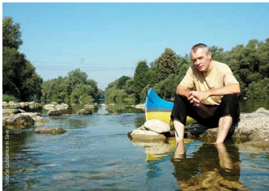
Sotočje Ljubljanice in Save

Izraza škodljiv in koristen sta antropocentrična. V naravi ni nič koristno in nič škodljivo, vsako živo bitje ima svoje mesto. Seveda se vse spremeni,