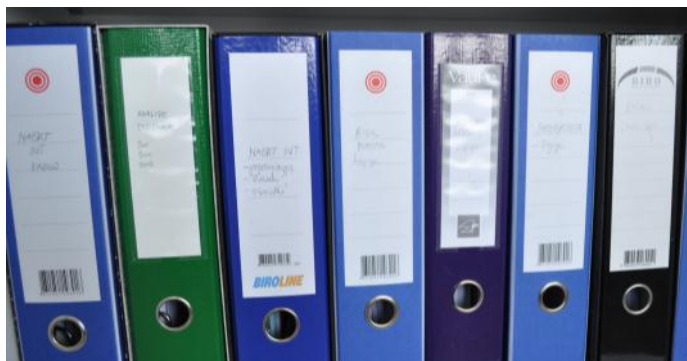
Gradivo za pripravo načrtov integritete.

Komisija je na podlagi 58 pregledanih načrtov integritete upravnih enot in 82 načrtov integritete samoupravnih lokalnih skupnosti (občin) ugotovila, da so javni uslužbenci, ki neposredno opravljajo naloge oziroma izvajajo pristojnosti na področju okolja in prostora, to področje izpostavili kot izrazito tvegano za pojav korupcije in navedli precej dejavnikov, ki ta tveganja ohranjajo ali drugače – vzdržujejo »pri življenju«. Velik del dejavnikov tveganj izhaja iz normativne neurejenosti tega področja kot tudi iz neurejenosti procesov dela, prek katerih se vršijo postopki priprav in odločanja o okoljskih oziroma prostorskih zadevah.