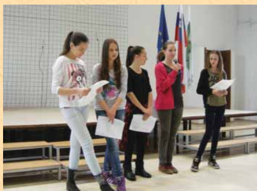
V Novem mestu smo se predstavili z recitalom Župančičevih pesmi.