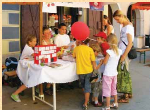
Bili smo na prireditvi Dobrodošli doma v Škofji Loki.