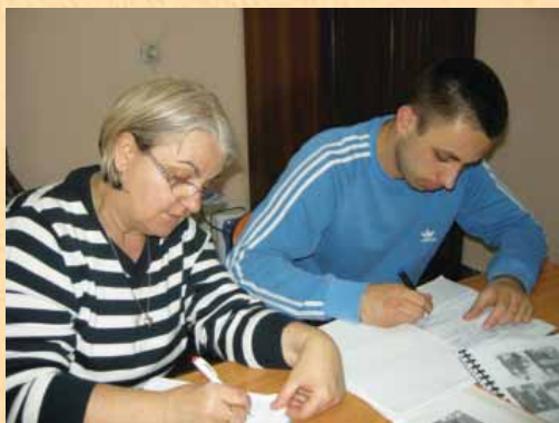
Napisali smo besedila.