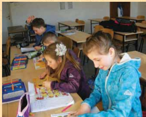
Rešujemo zabavne naloge.

Jaz se učim slovenščino, ker je moj mož Slovenec. Vsak četrtek grem na pouk. Slovenski jezik je zelo zanimiv in rada se učim. Želim spoznati slovensko tradicijo, kulturo, običaje. Pri pouku je zelo lepo druženje in prijazna učiteljica. Lansko leto sem šla na ekskurzijo v Slovenijo in sem se lepo imela. Bila sem navdušena, ker so ljudje zelo prijazni. Upam, da bom šla s svojo družino kmalu spet v Slovenijo.