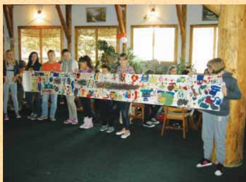
V Klašnicah smo se srečali vsi, ki se v Bosni in Hercegovini učimo slovenščino.