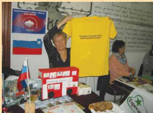
Predstavili smo se na Evropskem dnevu jezikov.