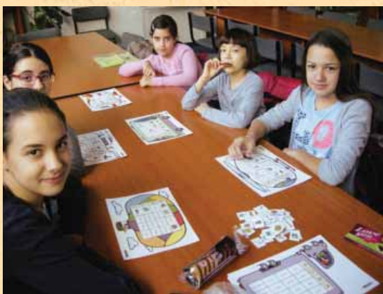
Radi igramo tombolo.