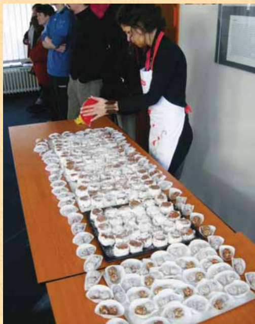
Sladek zaključek leta v Banjaluki.