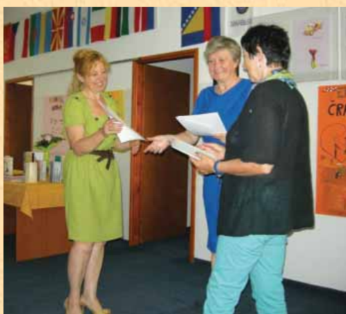
Pridni bralci s priznanji in knjižnimi nagradami Bralne značke Slovenije.