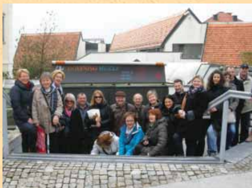
Obiskali smo muzej v Metliki in muzej v Novem mestu.