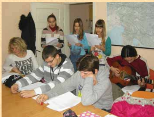
Pridno smo vadili za nastop.