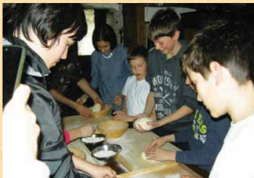
Učili smo se barvati pisanice in mesiti kruh.