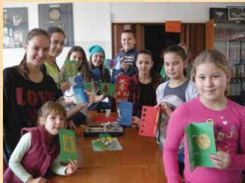
Ob koncu leta izdelujemo voščilnice.