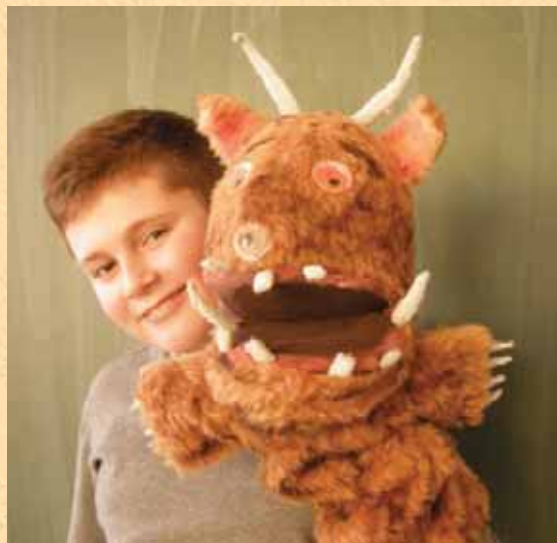
Niti Zverjasca se ne bojimo.

Pri slovenščini je zanimivo, ker se učimo prek igre.