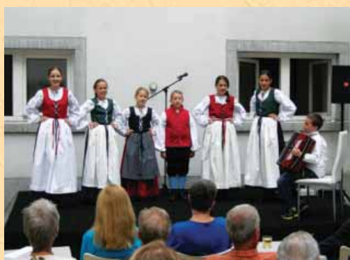
Peli in plesali smo v Narodni in univerzitetni knjižnici v Ljubljani.