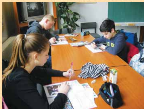
Dve skupini osnovnošolcev sta se pomerili v znanju.