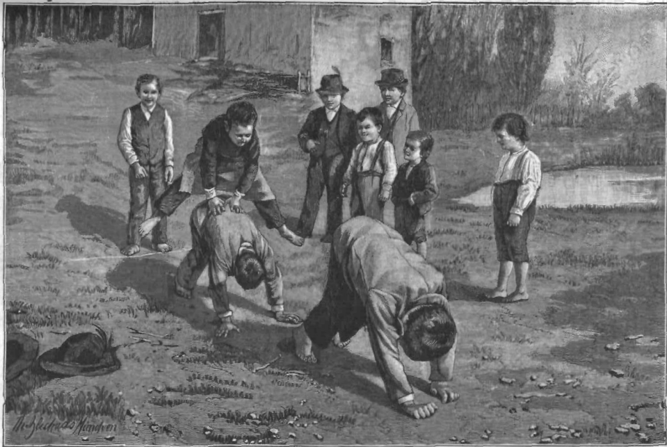
Illustration by W. J. Johnson. — A group of children playing a game of tag.