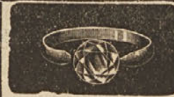
Trgovina z urami in zlatino F. ČUDEN, Ljubljana, Prešernova ul. 1.

z vsemi pripadajočimi stroji, surovinami in zgotovljenim blagom. Dopise pod „G. L. 1000“ na upravo „Jugoslovanske borze“.