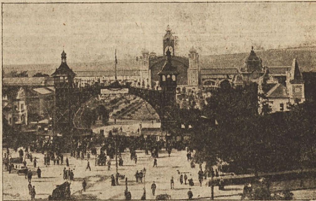
Vhod na razstavišče „praških vzorčnih velesejmov“.

Češkoslovaška industrija izvažna nad 75% svojih proizvodov v inozemstvo. Visoki tečaj česke