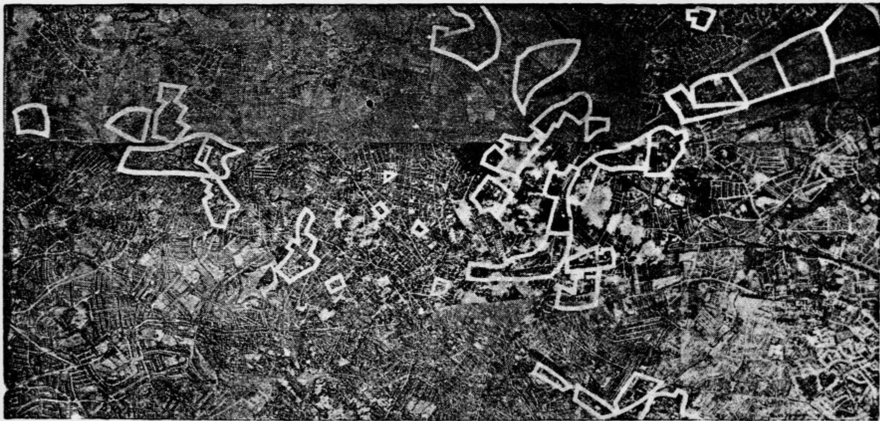
Preden se nemški vojaški letalci podajo k napadu na kakšno mesto, jim izroče jasno razviden načrt objektov, ki jih velja napasti z bombami iz zraka. Na ta način vidno občrtane objekte, ki jih je dalo vrisati poveljstvo nemškega letalstva pred napadom na mesto Birmingham