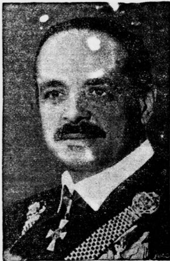
Madžarski zunanji minister grof Csaky