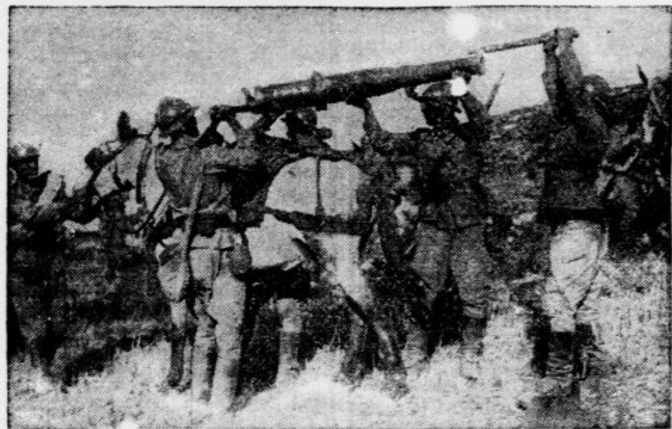
pri postavljanju poljskega topa v gorski položaj