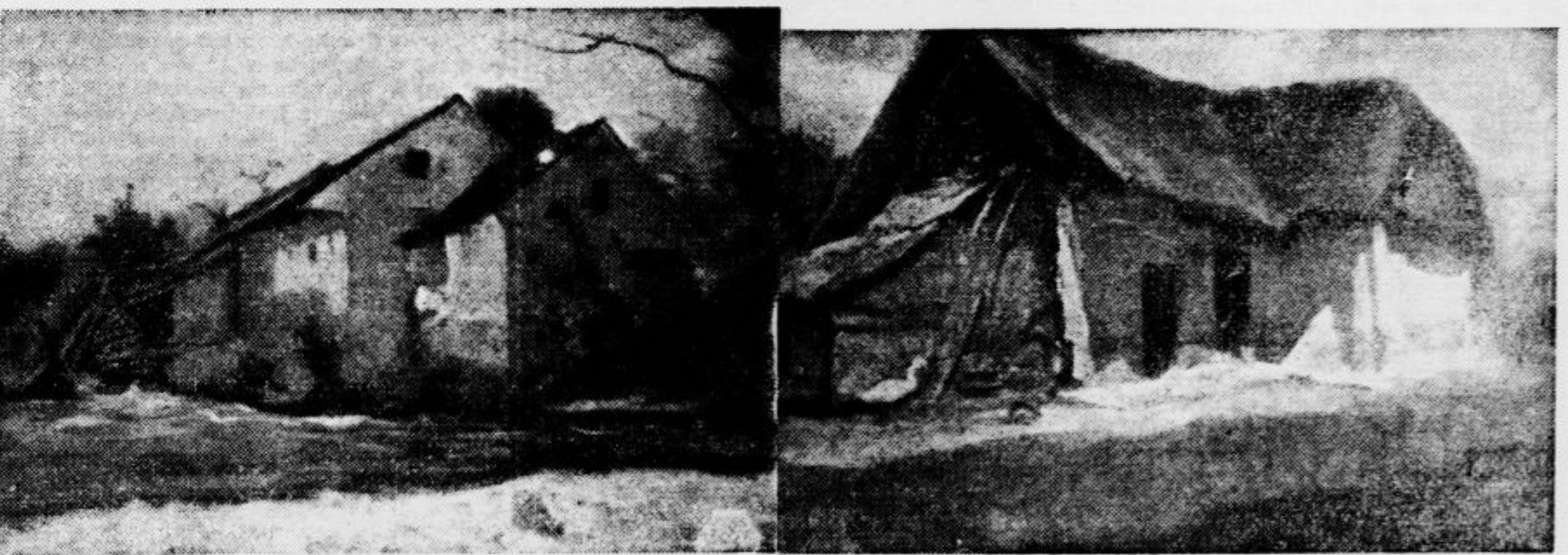
Božidar Jakc: Mlin na Savi pri Mednem

zadovoljiv ob nedeljah. Kakor čujemo, je tudi odkup posameznih umetnin znan. Razstava bo odprta do 17. t. m. in nanjo opozarjamo vse, ki si jo doslej še niso ogledali.