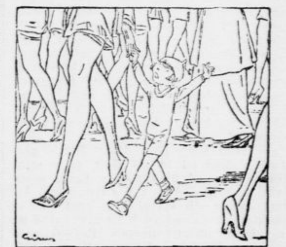
»Mamica pogledaj, tam gre ženska brez nog...«